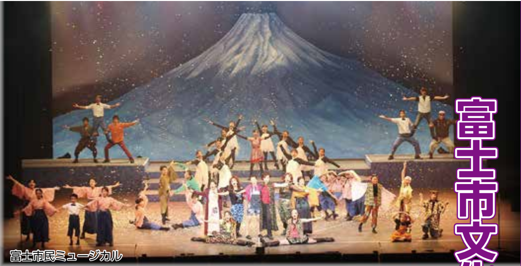
富士市民ミュージカル

市は、市民の皆さんに文化芸術に関する基本的な考え方と施策の方向性を総合的・体系的に示すため、「富士市文化振興基本計画」を策定しましたので紹介します。