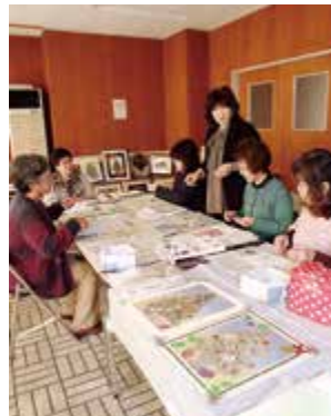
思い思いの作品をつくる「押し花グループ葵」の皆さん

現在は約40人で、月に2回、作品制作や勉強会をしています。「押し花絵は、草花の自然な色を生かして、そのままの形で貼ったり、表現したい形に切り抜いたりして、風景画や動物など、大きささまざまな作品をつくることで