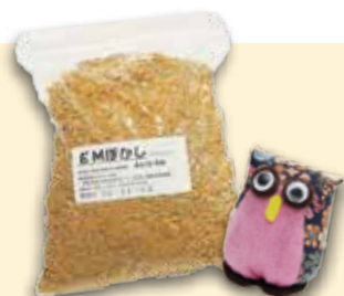
EMIぼかしなど (ふじひろみ)