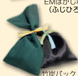
竹炭パック (夢の丘工房)