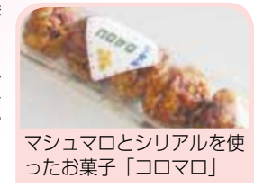
マシュマロとシリアルを使ったお菓子「コロマロ」

「コロマロ」づくりには、自信があります。調理室での作業は、1日中立ちっぱなしで大変ですが、休憩時間はみんな話ができるので楽しいです。販売に出かけたとき、お客さんに「コロマロ」を勧めました。自分がつくったものが売れるとうれしくなります。