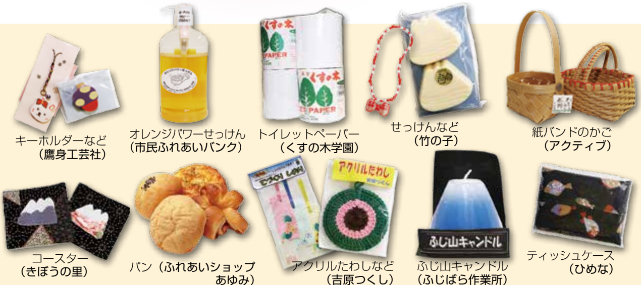
キーホルダーなど (鷹身工芸社)

授産品は、市役所2階「カフェあつぷる」前または「フィランセの無人販売」で入れます。詳しくは、障害福祉課、または社会福祉協議会(☎)64(6600)へお問い合わせください。