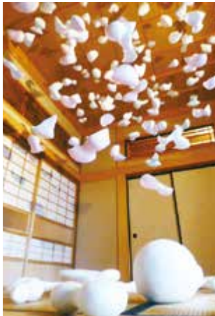
紙のアートフェスティバル