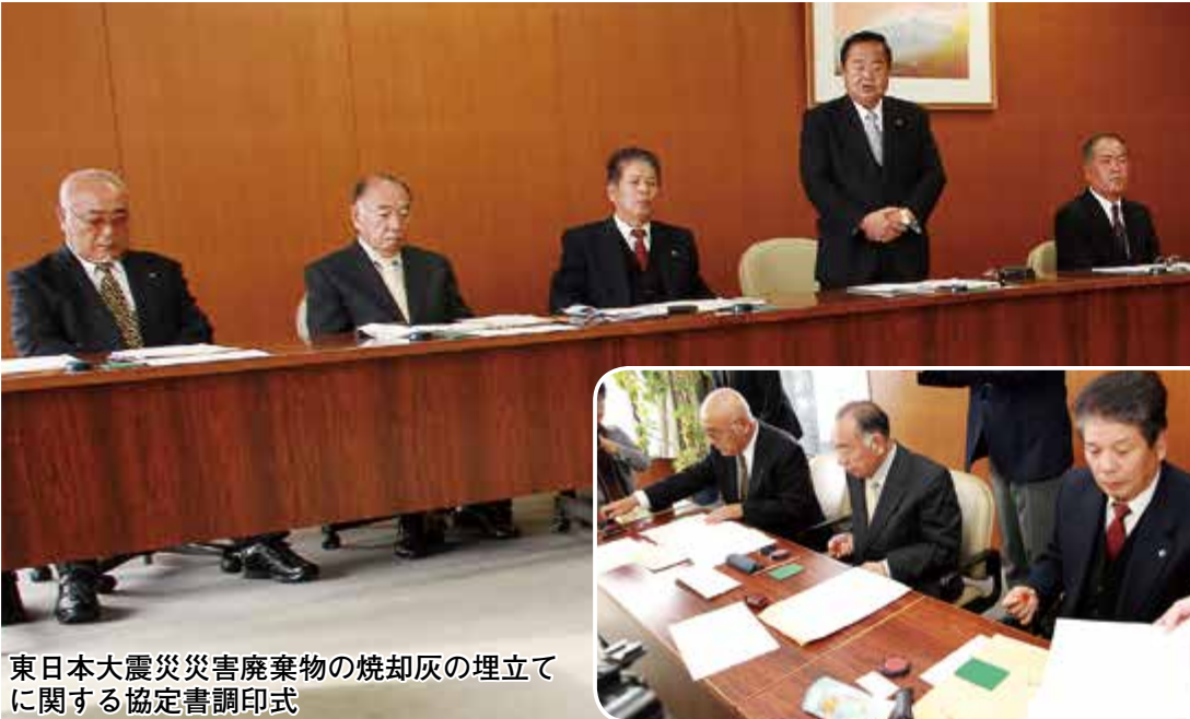
東日本大震災災害廃棄物の焼却灰の埋立てに関する協定書調印式