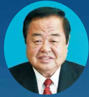
富士市長 鈴木 尚

市民の皆様には、健やかに新年をお迎えのことと心よりお慶び申し上げます。 富士山が世界文化遺産となる日がいよいよ近づいてまいりました。日本のシンボルであり宝である富士山が、名実ともに世界に認められようとしております。富士山にとりまして、これは大変喜ばしいことであり誇るべきことであります。 富士市内から仰ぎ見る富士山は、とても雄大で美しい姿をしております。この富士山がいつまでも人々を魅了し、世界文化遺産にふさわしい山であり続けるよう、山麓の豊かな自然やすばらしい景観を守り、これを後世に伝えていくとともに、富士山が富士山の玄関口として活力あるまちとなるために全力で努めてまいります。