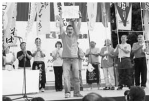
表彰式で歓喜の瞬間!

9月24日・25日に愛知県豊川市で開催された「中日本・東海B-1グランプリ」。中日本・東海地方エリアの18団体に、富士宮やきそばなど、殿堂入りの4団体を加えた総勢22団体が各地域の自慢の味を来場者へ提供しました。来場者の使用したはしによる投票の結果、富士つけナポリタンは、初出場で初入賞! 11月の姫路大会につながる前哨戦となりました。