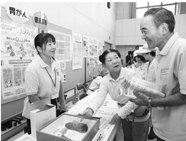
胃がん予防を啓発するコーナー