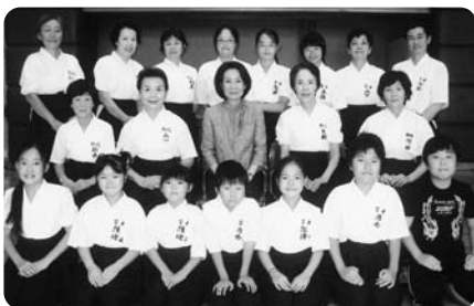
富士市 なぎなた連盟

多年にわたりなぎなたの普及振興を図り、技術力の向上や青少年育成を通してスポーツの振興に貢献されています。多くの大会で一般から小学生まで優秀な成績をおさめているほか、富士市スポーツ祭なぎなた競技大会を主管・開催するなど、その功績は高く評価され、今後とも活躍が大いに期待されます。