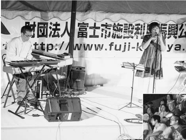
オカリナとシンセサイザーの演奏