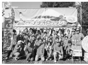
富士つけナポリタン大志館

11月12日・13日に兵庫県姫路市で開催される「B-1グランプリ in 姫路」。日本各地から過去最多の総勢63団体が出展し、まさに「B-1戦国時代」の到来です。各団体の熱い思いがぶつかり合う、決戦の火ぶたが切られます。富士つけナポリタン大志館の皆さんはつけナポリタンを全国にPRする活動をしています。市民の皆さんの温かい応援をよろしく願います。