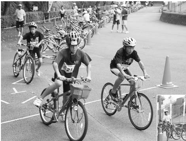
水泳を終え、自転車に乗る参加者