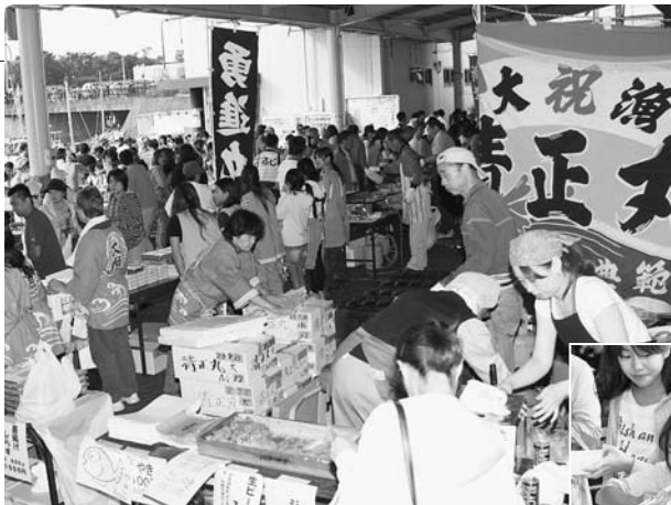
大勢の人でにぎわった模擬店会場