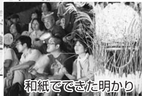
和紙でできた明かり

7回目となる広見公園観月会はことし、東日本大震災復興支援チャリティとして開催されました。ステージにはスキヤ月見団子が飾りつけられ、オカリナとシンセサイザーのコンサートが行われました。来場者は美しい音色を聞きながら、秋の夜長を楽しみました。和紙でできた明かりからあふれる光や、時折雲間から差す月の光で、会場はやわらかな光に包まれていました。