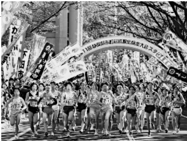
▲静岡県庁前を一斉にスタート