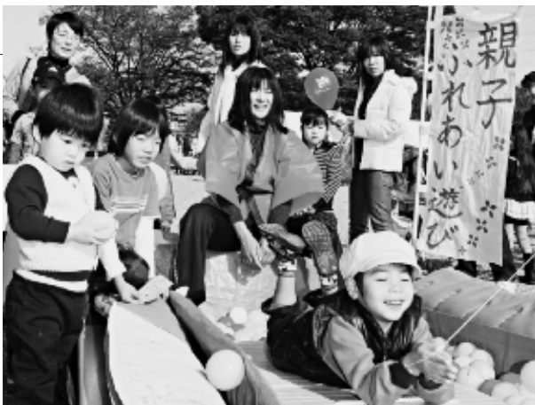
人気を集めた「いっしょにあそボール」

来場者は、魚のさばき方や衛生上の注意点を学ぶ「親子かんだんお魚料理教室」や、親子で協力して踏み台をつくる「親子木工教室」などに参加し、真剣な中にも笑顔が絶えない体験をしました。親子は、たくさんのお土産を抱え、満足げな表情でした。