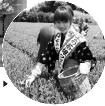
▲前回のコンテストの様子

富士市の特産物である「富士のお茶」の消費拡大を図るため、PRイベントなどに協力いただく 富士の茶娘 を募集します。