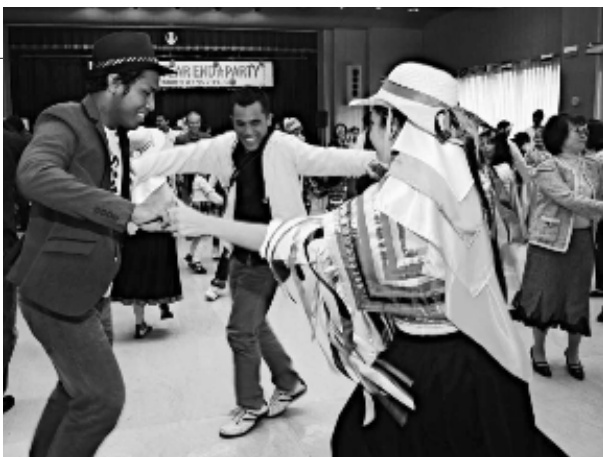
軽快なリズムに合わせて行われた全員でのダンス

子どもたちは「表現遊び」、「自然の遊び」、「ゲームで遊ぼう」など、それぞれのコーナーで工夫を凝らした遊びを体験。「親子ふれあい遊び」コーナーでは、親が引っ張るダンボールの板に子どもが乗り、カラーボールの海を進む「いっしょにあそボール」や竹馬、けん玉などが人気となりました。