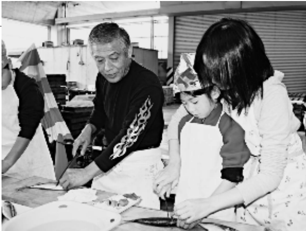
アジのさばきに親子で挑戦