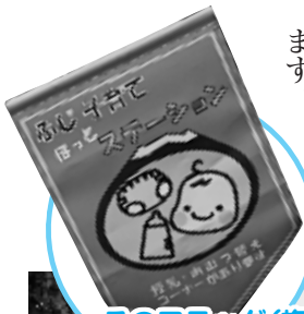
このフラッグ（旗）が目印