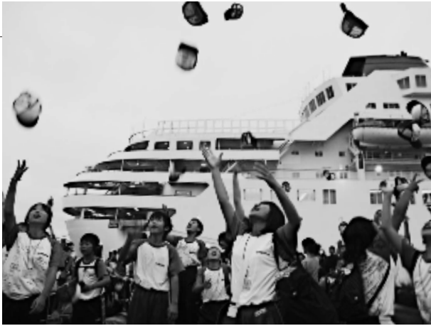
帰港式後、帰港を祝って帽子を大空に飛ばす研修生