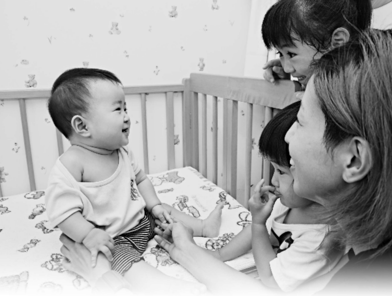
「ぐるん・ぱ よねのみや」内、ふじ子育てほっとステーション

乳幼児を連れて外出したとき、授乳やおむつがえができる場所がなくて困ったことはありませんか？ 市は、公共施設を中心に授乳やおむつがえができるスペースと設備を整備して「ふじ子育てほっとステーション」として指定します。お気軽にご利用ください。