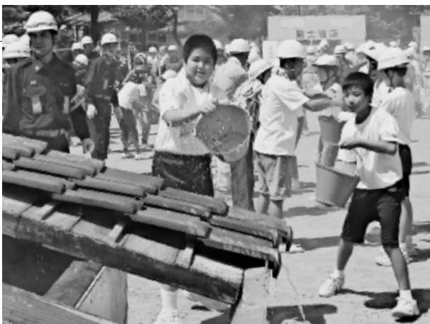
初期消火訓練(バケツリレー)

訓練は、マグニチュード8、震度6弱以上の地震を想定し、自主防災会ごとに小学校に避難する訓練から開始。救急救護や炊き出し、仮設トイレの設置など、多彩な訓練を通して災害発生時の地域の防災体制を再確認しました。