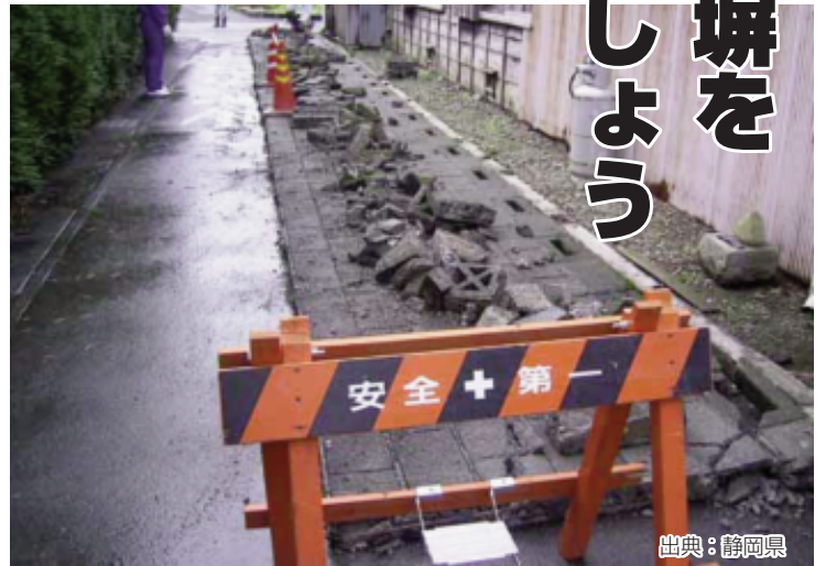
▲駿河湾を震源とする地震（平成21年8月11日）によるブロック塀の倒壊