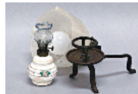
「おうちのどうぐ。」展から