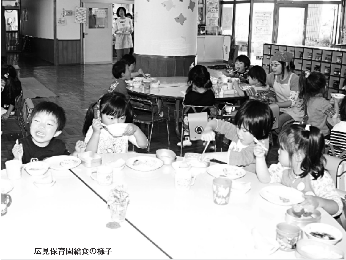
広見保育園給食の様子

市は、国の食育基本法・食育推進基本計画に基づき、昨年3月、富士市食育推進計画「富士山おむすび計画」を策定し、食育を計画的、総合的に推進しています。