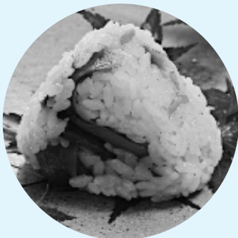
第1回富士山おむすびコンテストグランプリ「かっちき」のおむすび