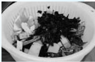
ベランダで生ごみを処理