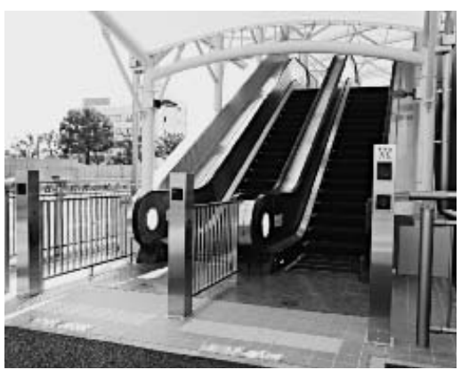
新設された市庁舎東側エスカレーター

市役所駐車場から2階市民課（正面玄関）へ、庁舎東側に新設されたエスカレーター（写真右）で直接行くことができます。