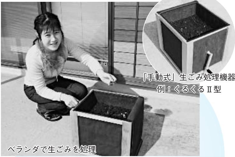
「手動式」生ごみ処理機器 例：くるくるⅡ型

「手動式」生ごみ処理機器は、「電気式」生ごみ処理機に比べて安価で、電気代もかからず、経済的にも「エコ」なものです。あなたも「エコ」な生活を始めてみませんか？