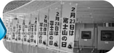
富士山写真パネル展 (富士市交流プラザ)