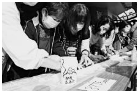
3,776ミリメートルの大福づくりに挑戦 (富士駅南商店会)