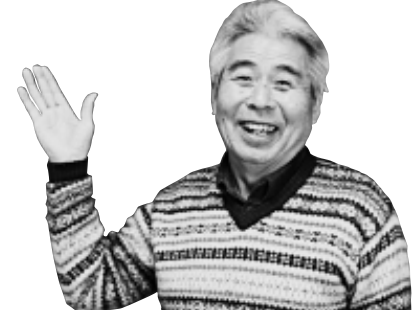
市のカレンダーの平成22年4月使用写真の撮影者 望月 尚一さん(入山瀬)

私は約8年前からデジタルカメラを始めました。風景写真が好きであちらこちらに出かけています。富士山百景写真コンテストに、第2回から毎回応募しています。春はやはり桜と富士山。昨年は小潤井川で撮影した写真で、ことしは岩淵の十三仏で撮影した写真で応募しました。十三仏は、坂道に太い桜がずらりと並んでいます。高台なので、富士川や岩本山も見えてすてきですよ。