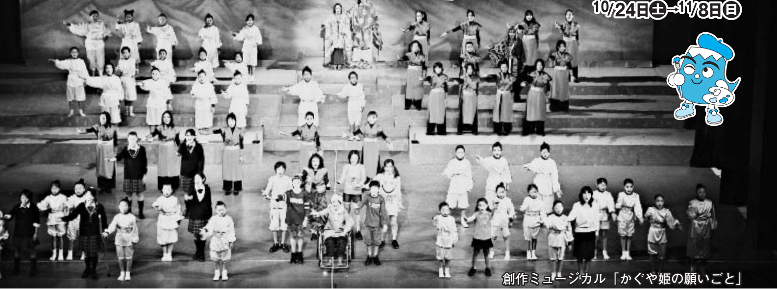
創作ミュージカル「かぐや姫の願いごと」