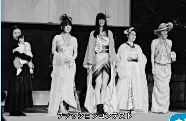
ファッションコンテスト