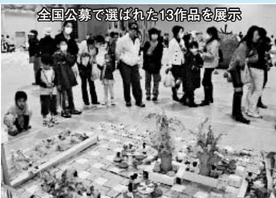
全国公募で選ばれた13作品を展示