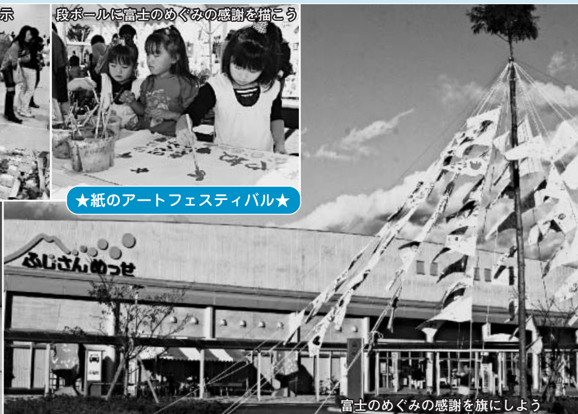
富士のめぐみの感謝を旗にしよう