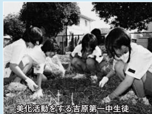
美化活動をする吉原第一中生徒

●小中学校市内一斉美化活動 富士市青少年会議で話し合い、市内各地区の学校周辺や神社・公園などの清掃をしました。日ごろは人目につかない場所もきれいすることができました。