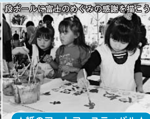
段ボールに富士のめぐみの感謝を描こう