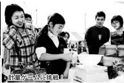
計量ゲームに挑戦!