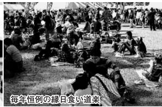
毎年恒例の縁日食い道楽