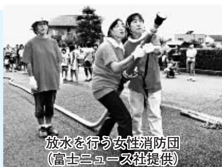
放水を行う女性消防団

今回は、男女共同参画都市宣言の内容と11月14日に行われる記念式典についてご紹介します。