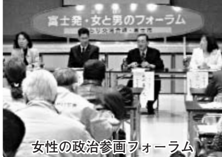
女性の政治参画フォーラム

市は、だれもが心豊かに自分らしく生きるまちを目指して、「男女共同参画都市宣言」を行いました。男女共同参画社会の実現に向けて、未来へ踏み出す大きな一歩となります。