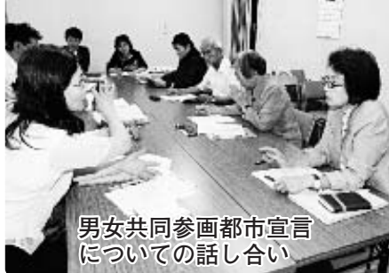
男女共同参画都市宣言 についての話し合い

また、4つの条文には、「人権」「ワーク・ライフ・バランス(仕事と生活の調和)」「福祉・国際化」「性別役割分担の解消」についての内容を、一つずつ盛り込みました。