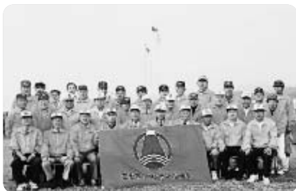
富士市ソフト ボール協会

多年にわたりソフトボールの普及振興を図り、競技力の向上や活動の実践などをもってスポーツの振興に貢献されています。静岡県高等学校総合体育大会ソフトボール競技大会や栄光杯などを主管・開催するほか、富士川緑地公園ソフトボール場の整備に努めるなど、その功績は高く評価され、今後大いに活躍が期待されます。