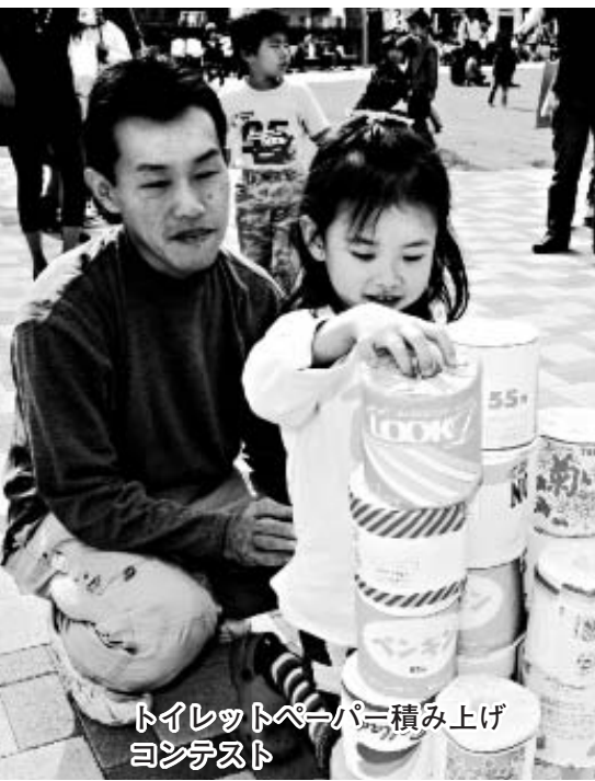
トイレットペーパー積み上げ コンテスト