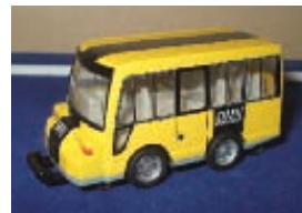
三館企画展「レール&ロード」から

三館企画展「レール&ロード～富士・沼津・三島の交通ものがたり～」～29日 第1日曜日「博物館の日」 手すき・はたおり・型染体験・空き缶万華鏡づくりほか 1日 篆書(てんしよ)入門 6・13日 陶芸歳時器(キャンドル立て) 14日 富士の型染教室 18日 親子ときやき体験 23日 休館日 2・4・9・16・24・25・30日