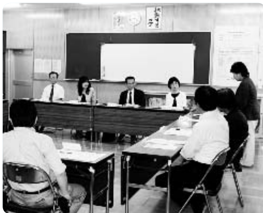
富士川第一小学校の保護者と意見交換

教育委員は、地域の保護者や住民の声を直接聞き、地域の実情に合った教育行政を実現していきます。教育に関する皆さんのご意見、ご提言をお寄せください。