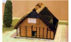
『第46回企画展 富士山麓に生きる～大淵のくらしと稲垣家』から稲垣家住宅模型(日本建築専門学校蔵)

第1日曜日「博物館の日」 型染・手すき・はたおり・七宝焼体験 4日 陶芸歳時記 10日 第46回企画展 富士山麓に生きる ～大淵のくらしと稲垣家～18日 はたおり体験 18日 収蔵品展「古写真と絵画にみる富士」 31日～7月6日 休館日 12、19、26日