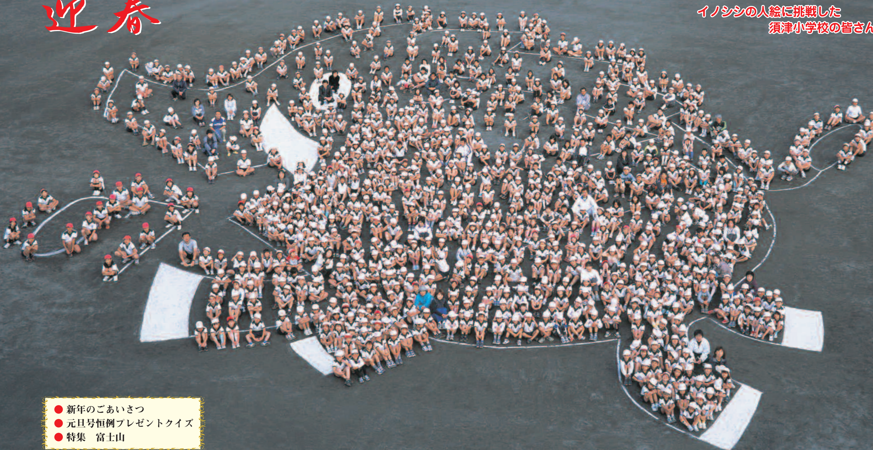
イノシシの人絵に挑戦した 須津小学校の皆さん