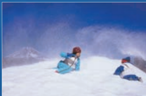
人々と富士山部門 グランプリ受賞作品「吹雪」