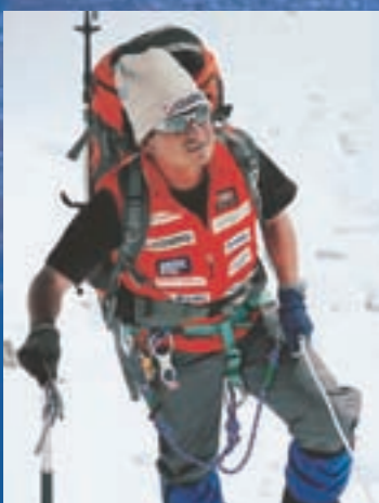
富士山清掃活動に取り組み 野口 健さん（アーティスト）

「日本のシンボルである富士山が変われば、日本が変わる。そう信じて、清掃活動と環境改善に全力を尽くした」