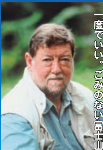
C.Wニルさん（作家・ナチュラリスト）