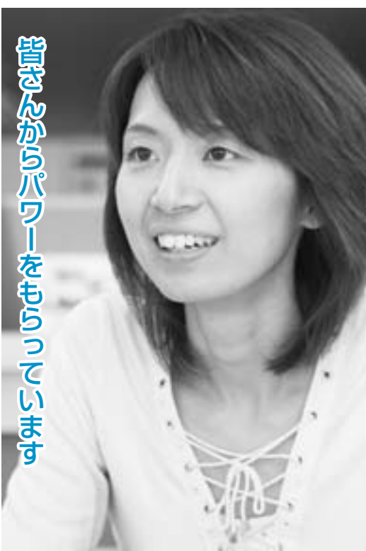
皆さんからパワーをもらっています