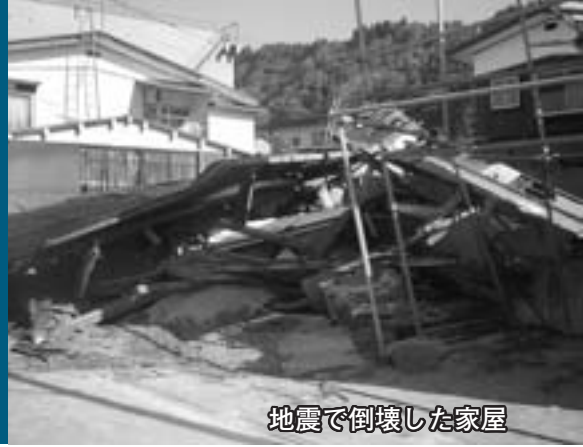
地震で倒壊した家屋

阪神・淡路大震災で亡くなった人のうち、約8割が建物の倒壊などによる圧死でした。 予想される東海地震から、一人でも多くの生命を守るため、建物の耐震対策は不可欠です。そのため、市は県とともに、住宅の耐震化を図るプロジェクト「TOUKAI(東海・倒壊)-0」を進めています。