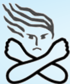
女性に対する暴力根絶のためのシンボルマーク