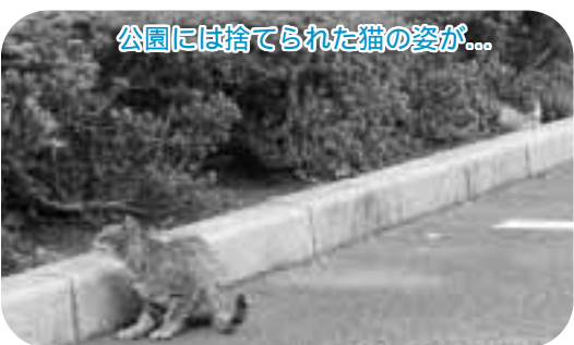
公園には捨てられた猫の姿が...

とうとう命を救うために、あなたにできることから始めてみましょう。捨て猫や野良猫をふやさない努力をしませんか。