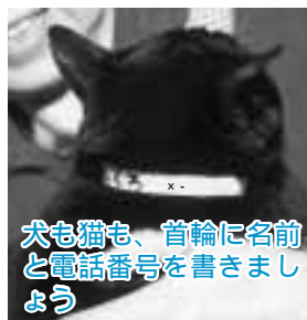
犬も猫も、首輪に名前と電話番号を書きましょう

たり、名札を付けたリするなど、身元が分かるようにしておく、すぐに解決します。しかし、飼い主全員に徹底されていないのが現状です。