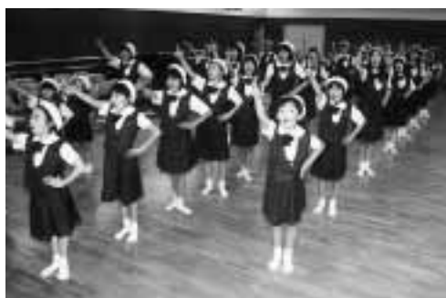
自慢の楽しい振り付けや美しい歌声は、この練習から生まれます

ことし、創立三十周年を迎えた富士市少年少女合唱団は、四月三日、記念コンサートとしてオリジナルのオペレッタ「せりふと踊りを含む歌劇」お姫様の出発」を上演しました。団員の自慢である手づくりの小道具や衣装を身につけて、伸び伸びと演技をし、公演は大成功をおさめました。オペレッタが通常の合唱と違うのは、歌って踊って演じることです。団員の皆さんは、「どこの合唱団にも負けません。私たちが一番!」と胸を張ります。