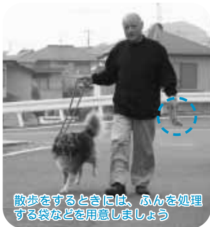
散歩をするときには、ふんを処理する袋などを用意しましょう