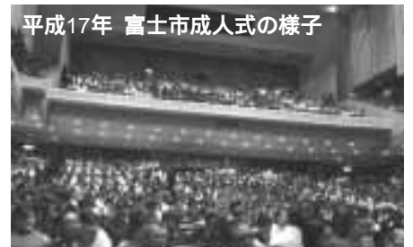
平成17年 富士市成人式の様子