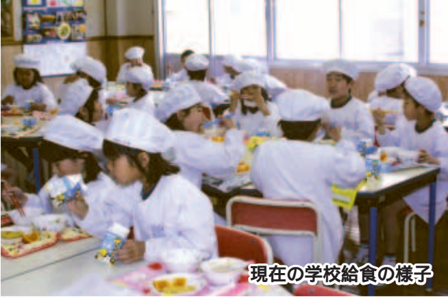
現在の学校給食の様子