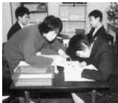
一人一人のペースに合わせて、和気あいあいとした学習

「ただいま!」「おかえり!」家族のように温かい雰囲気、学校帰りの子どもたちを迎えます。三月二十二日、市内では初となる民間の知的障害児放課後クラブ「なんくる」が、吉原駅北口近くに開所しました。「なんくる」とは、沖縄県の方言で、「何とかなる」という意味です。気持ちが悪くなる、何かがちなときも、前向きに、何とかしていこうという気持ちが込められています。