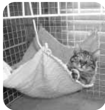
上下運動のために、ハンモックがある家もあります