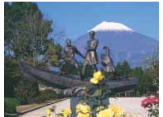
広見公園内にある友好の像

下田や戸田に比べるとディアナ号のことが、市内であまり知られていないのはとても残念です。百五十年前に富士市の先人は、五百人もロシア人を荒れ狂う海の中から救出し、温かくもてなしています。ロシアとの交流の第一歩が富士市から始まったと言えるのではないのでしょうか。 今後はディアナ号の船員の子孫と、市民の交流を実現させることが私たちの夢ですね。 国境を越えたいきずなを強めていきました。 ロシア人の魅力は明るく朗らかで包容力があるところですよ。ゆったりと落ちついていて大陸的な人間像を映し出してくれま