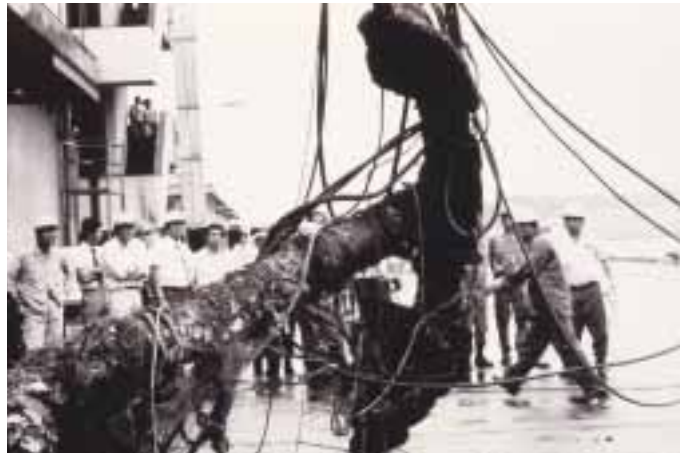
昭和五十一年に行われた、いかりの引き揚げの様子

その後、帰国用の帆船として、戸田村で日本初の洋式帆船「ヘタ号」が建造されました。造船に携わった人たちは、目をみはる思いで洋式帆船の建造法を学び、これが日本近代造船の発祥となりました。