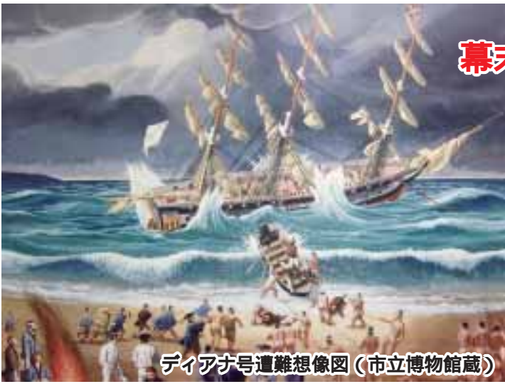
ディアナ号遭難想像図（市立博物館蔵）