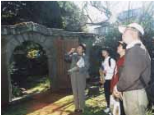
説明を熱心に聞く史跡めぐりの参加者（松城邸）