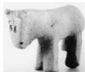
「いのりとまじないの世界」

富士の型染教室 3日 はじめてのやきもの教室 13日 機織り体験 13日、27日 博物館ゼミナール 17日 はじめての絵付け教室 20日 休館日 1日、8日、15日、22日、29日