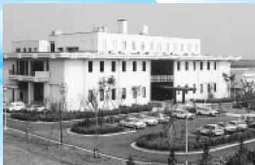
東部浄化センター

一般会計の財源も厳しい中、下水道事業への繰入金増加は、ほかの事業にも大きな影響を及ぼします。これ以上、繰入金に依存するわけにはいかないと判断し、平成六年から十年近く据え置いてきた下水道使用料を改定することになりました。