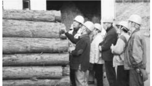
▲「富士ひのきくみの里」を見学

市内には、福祉施設や生活環境施設など、公共施設がたくさんあります。公共施設の見学を通して、皆さんの納めた税金がどのように使われているかを知っていただき、市政に対して広くご意見をいただくため、マイクロバスでご案内します。