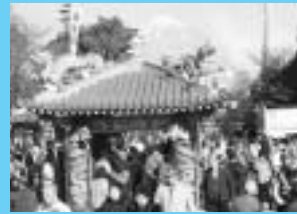
一月二十八日、三十日 毘沙門天大祭 (今井妙法寺)