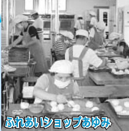
ふれあいショップあゆみ