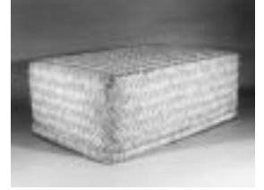
富士・沼津・三島3市博物館共同企画展 「竹の今昔物語」

富士・沼津・三島3市博物館共同企画展 「竹の今昔物語」 11月9日まで 手すき和紙体験 5日 陶芸教室 7日・9日・21日 機織り体験 11日・25日 はじめてのやきもの教室 11日 はじめての絵付け教室 18日 富士の型染教室 22日 休館日 6日、14日、15日、20日、27日