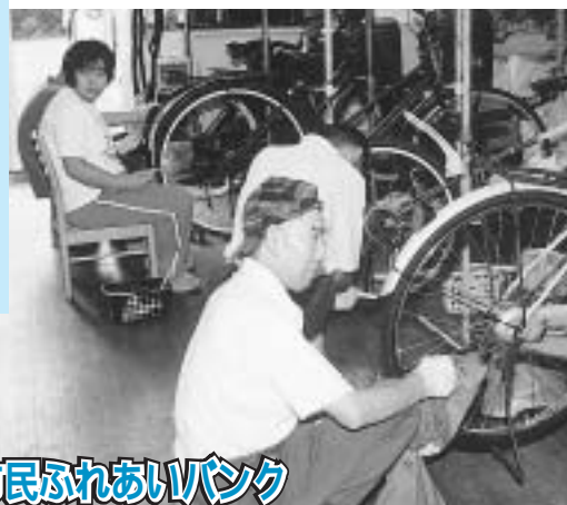
市民ふれあいバンク