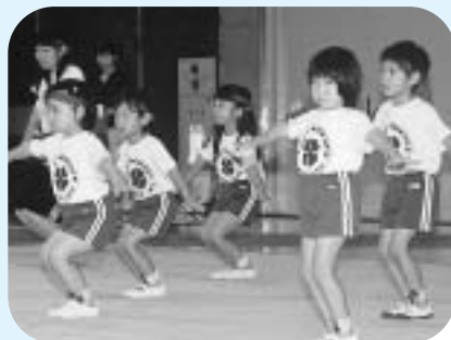
ふじっぴー体操で健康づくり