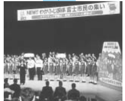
平成14年2月17日 富士市民の集い