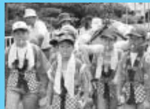
七月二十一日 中島地蔵尊祭典 (中島)