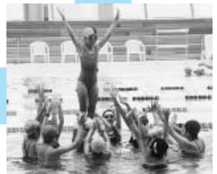
平成14年9月28日 1年前イベント