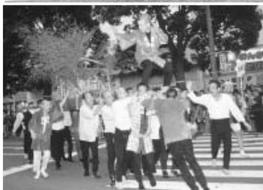
◀ 祭りを活気づけたみこしの練り歩き