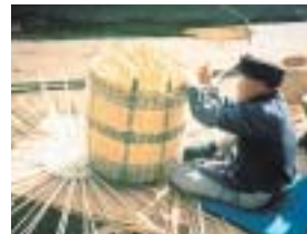
富士・沼津・三島3市博物館共同企画展 「竹の今昔物語」