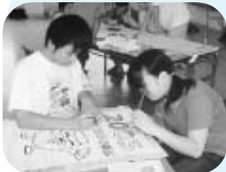
子ども会の皆さんによるのぼり旗作成（歓迎）