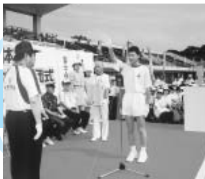
平成15年8月3日 大会旗及び炬火リレー結団式