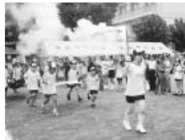
8月3日に行われた吉永地区炬火リレー