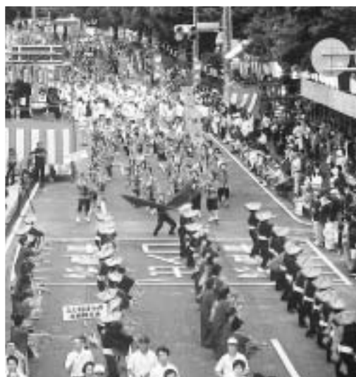
▲ 3,000人を超える市民が参加し盛り上がった市民総おどり