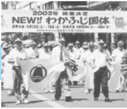
平成12年8月5日 開催決定記念パレード