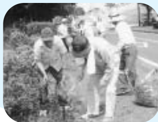
環境美化大会で会場周辺を清掃（きれいな街）

ふじ3運動は、私たちのシンボルである富士山をイメージ、三つの目標を展開する市民運動です。