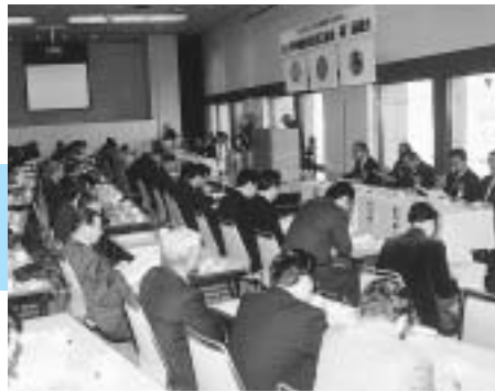
平成8年11月21日 富士市準備委員会設立総会