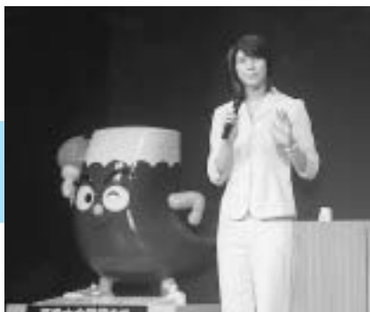
平成15年6月5日 スポーツキャスター益子直美さんによる100日前記念講演会