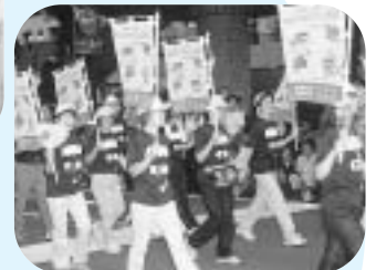
富士まつりでのPR活動