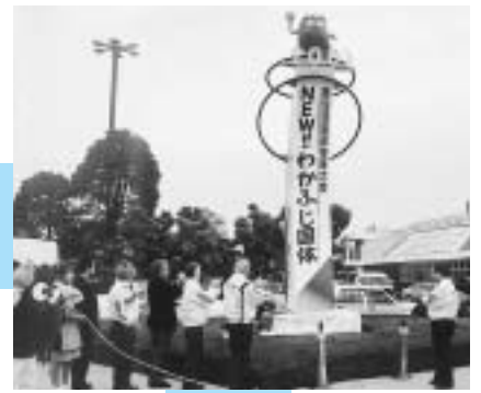
平成13年11月9日 広報塔設置セレモニー(新富士駅)