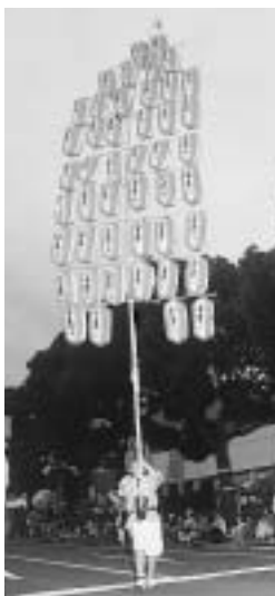
▲ 見事なバランスを披露した竿灯