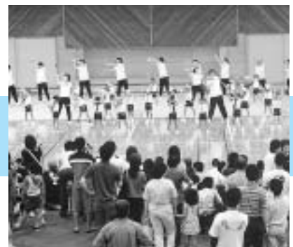
平成15年7月20日 55日前イベントGO!GO!フェスタ