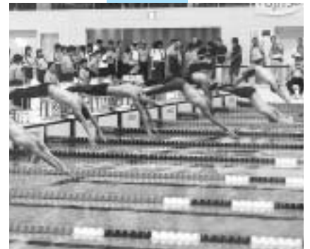
平成14年7月・8月 バレーボール・競泳・飛込競技 リハーサル大会

四十六年ぶりに静岡県で開催される国内最大のスポーツイベント「国体」。いよいよ来月、第五十八回国民体育大会「NEW!!わかふじ国体」の夏季大会が富士市をメイン会場に県下各地で開幕します。 富士市では、国体開催に向けて始動した平成八年以来、市民の皆さんとともに準備を進めてきました。今回はこれまでの歩みと、夏季大会、大会旗及び炬火リレー、スポーツ芸術などについてお知らせします。 この大会が成功するよう、みなで力を合わせて大いに盛り上げていきましょう。