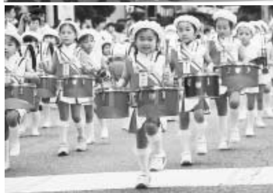
◀ 園児の鼓笛隊などが参加した音楽パレード