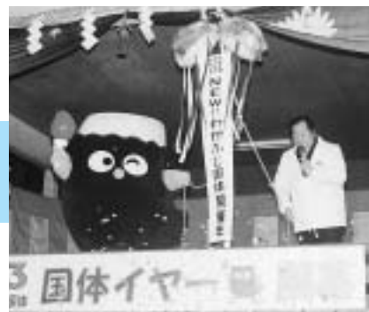
平成15年1月1日 国体イヤー開幕イベント(米之宮浅間神社)