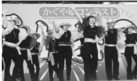
◀ 踊りや演奏などが行われた市民パフォーマンス