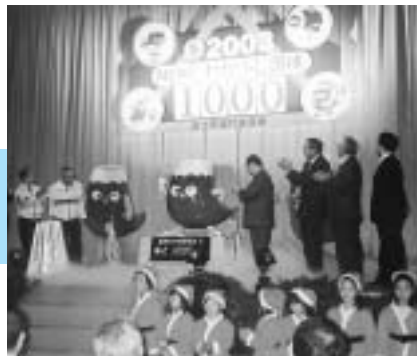
平成12年12月17日 カウントダウン1000 in Fuji