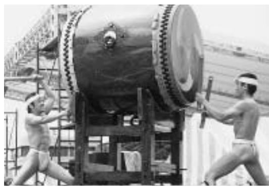
◀ 威勢のよいばちさばきで観客を魅了した鬼太鼓座