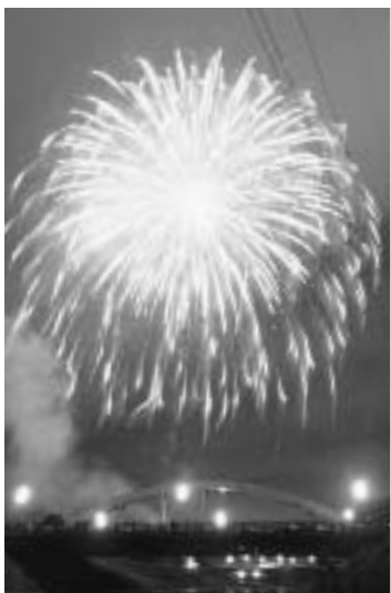
▲ 潤井川大橋付近で約3,000発打ち上げられた花火