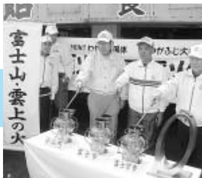
平成15年7月29日 富士山頂で炬火の採火式