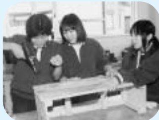
中学生によるプランターカバー作成（花いっぱい運動）