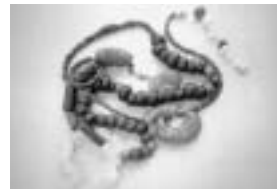
第41回企画展 「おしゃれな原始・古代人」展

「20世紀写真の中の富士 ~近代産業と交通~」展 ~2日 第41回企画展 「おしゃれな原始・古代人」展 11日~5月5日 はじめてのやきもの教室 8日 富士の型染教室 12日 機織り体験 23日 休館日 3、10、17、22、24、31日