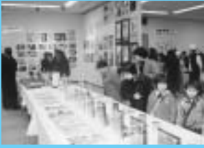
一月二十六日 中学校美術展 (ロゼシアター)