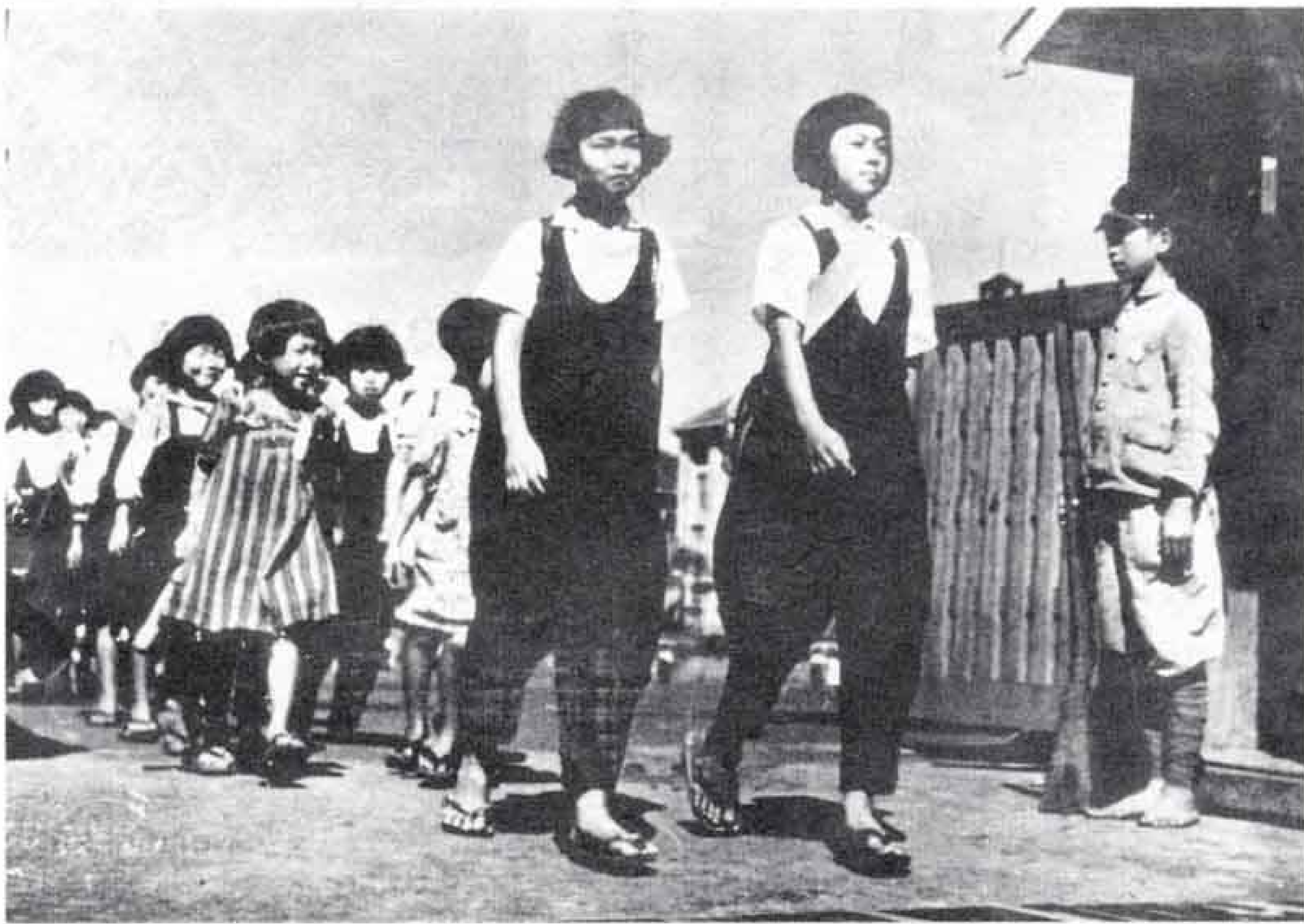
●もんぺをはいて登校する子どもたち