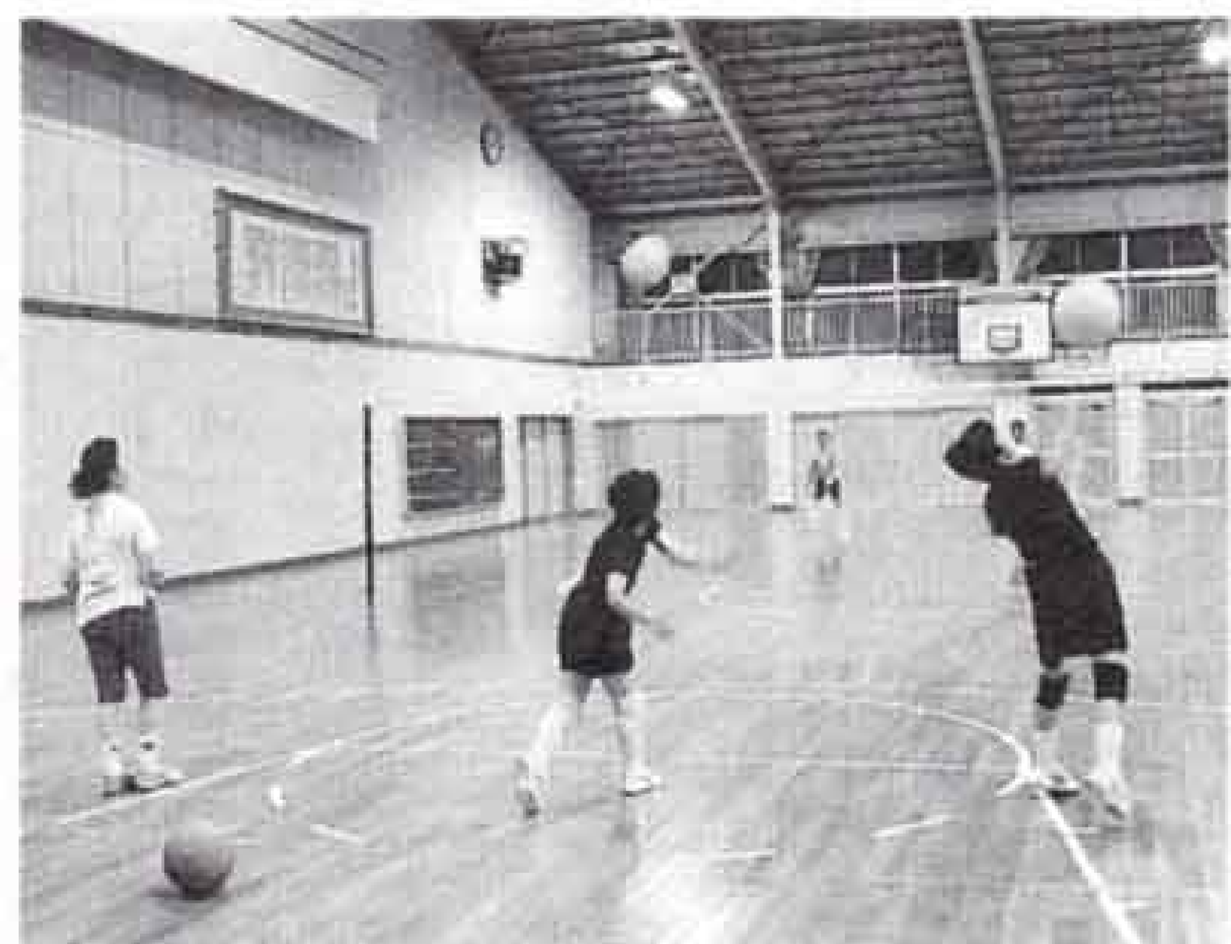
▲ねんりんピック広島大会に向けて練習に励む

力派のチーム。「まだまだ若い者には負けていられない」と毎週土曜日の夜、吉原一中体育館で、皆さん元気いっぱい練習しています。