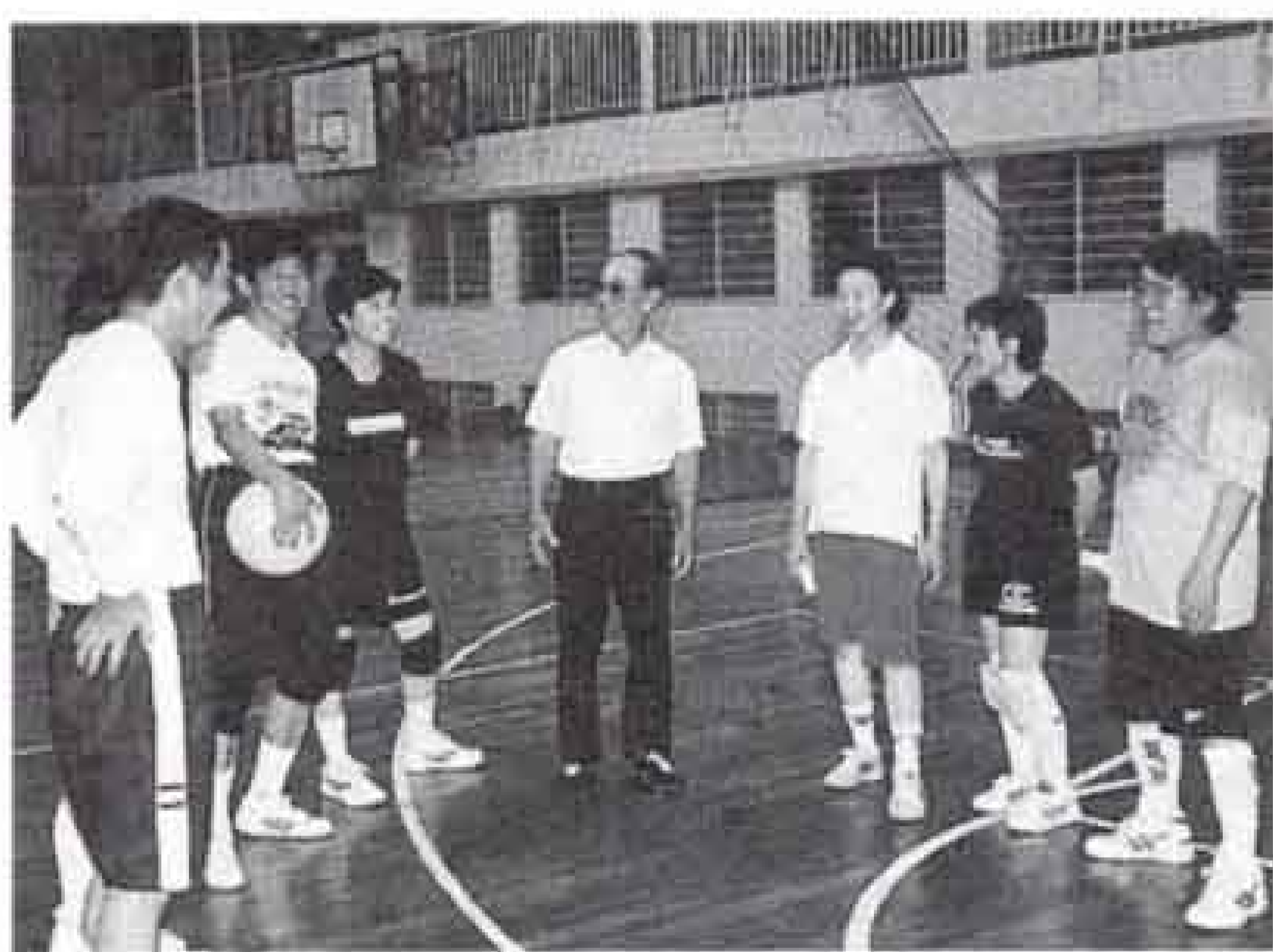
▲練習前に打ち合わせをする富士市チームの皆さん

『県すこやか長寿祭スポーツ大会』は、高齢者など、スポーツを通じてふれあいと交流を図ることを目的として開催されるスポーツ大会で、ねんりんピック広島大会の予選会を兼ねています。ソフトバレー競技の富士市チームは、富士市バレーボール協会の役員で結成されたチームで、この県大会に過去五回の出場で、平成十年、平成十一年に続き、三度目の優勝という実