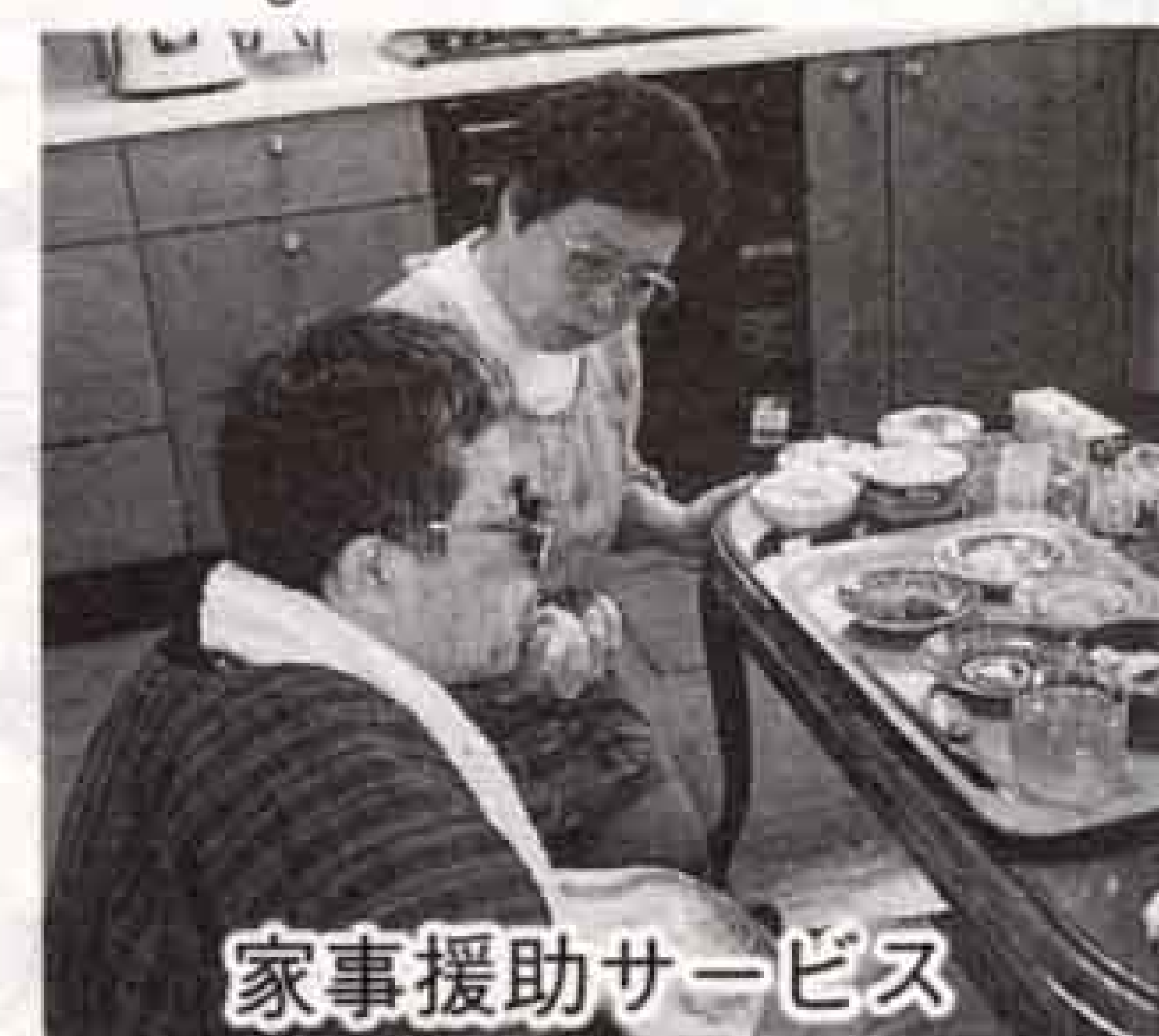
家事援助サービス