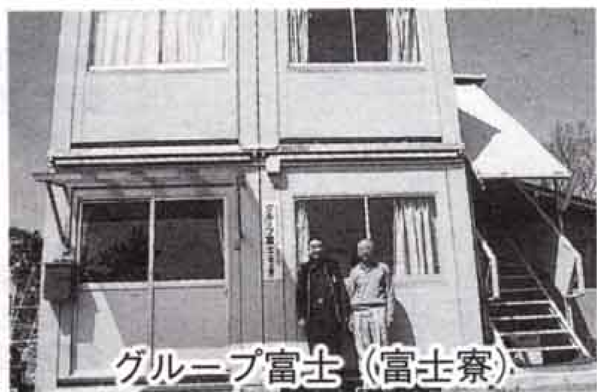
グループ富士(富士寮)