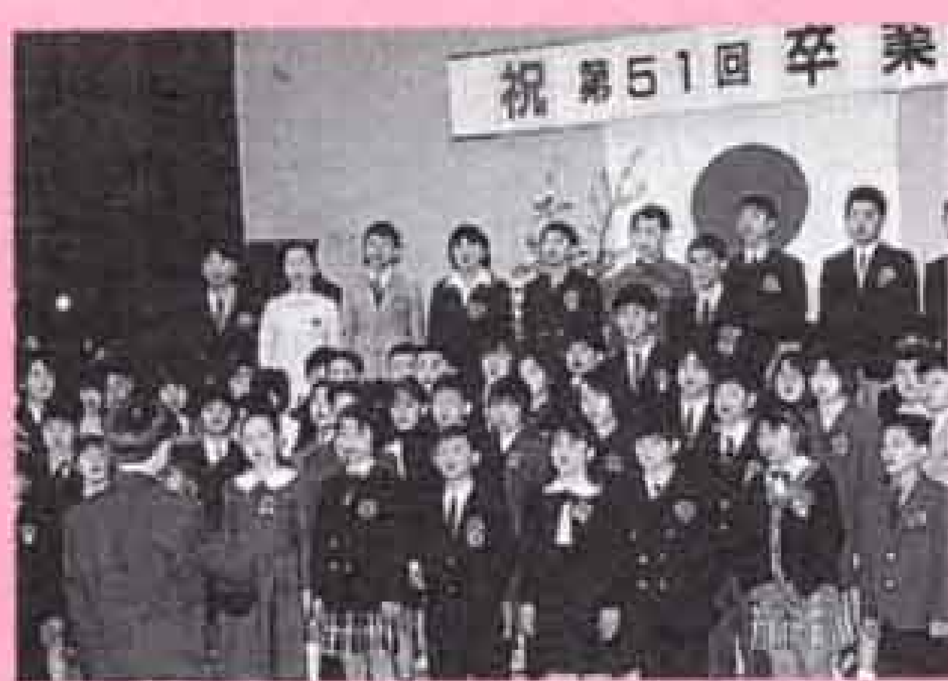
三月二十一日 小・中学校卒業式 (富士第二小学校)