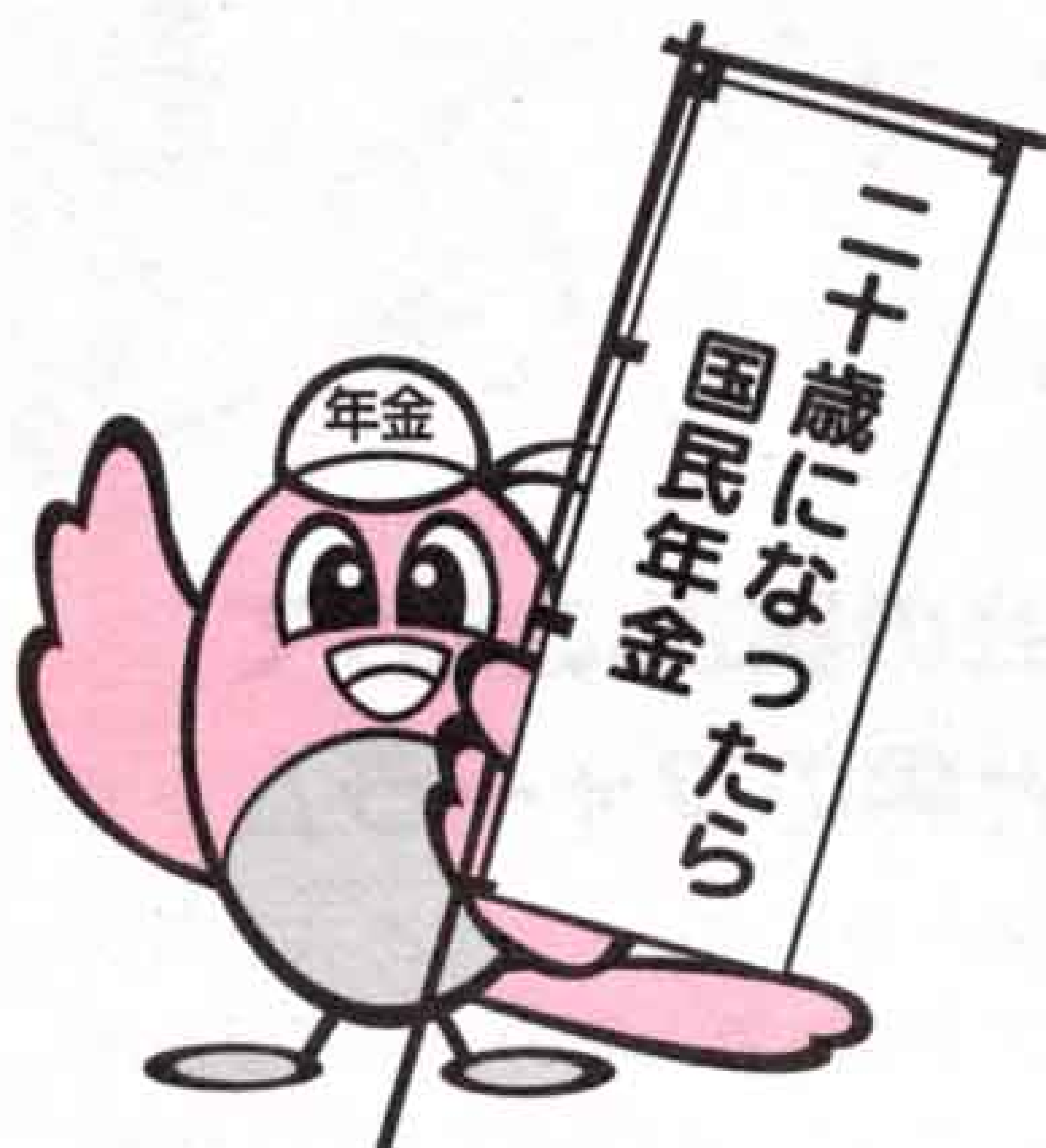
静岡県年金マスコット サンちゃん

●免除を受けた保険料は、将来、さかのぼって（10年間）納めることができます。（3年を超えると、加算額がつきます）