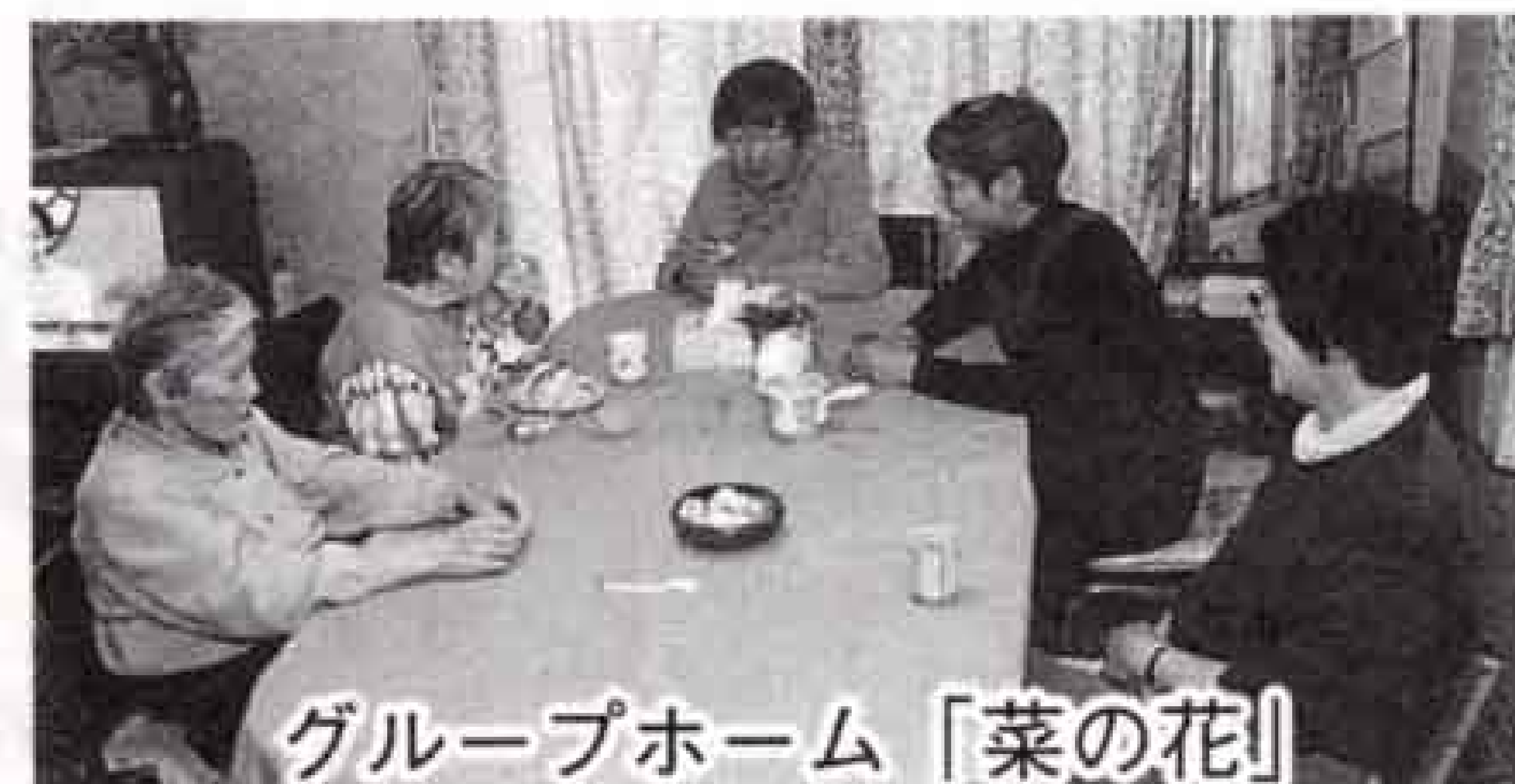
グループホーム「菜の花」