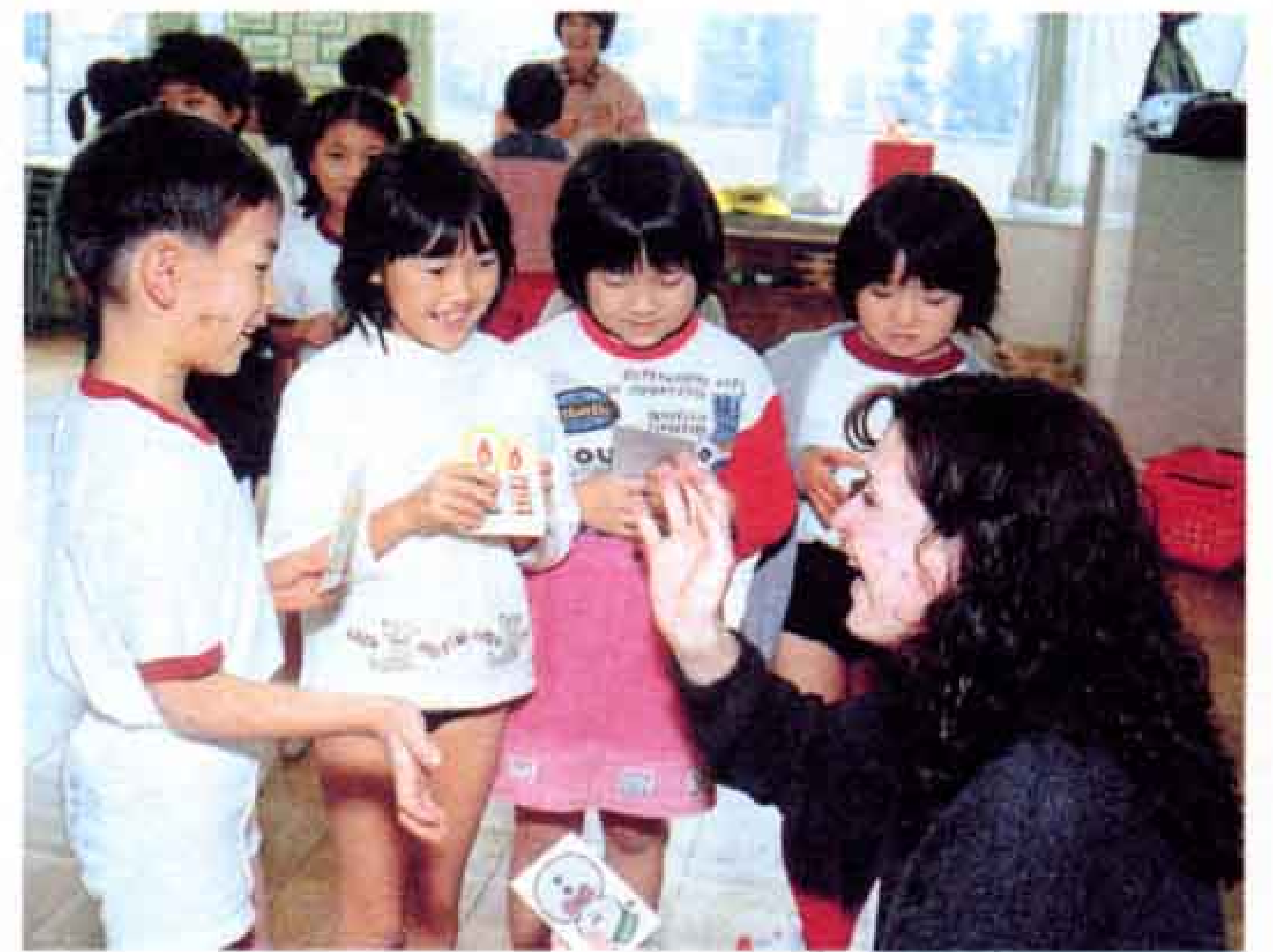
▲ALTのショーナ先生と英語であいさつを交わし、クリスマスカードを手渡しました（吉原小学校）。

▲十一月に富士中学校で行われた「国際交流の集い」では、県内に住む外国人を招き、生徒たちはそれぞれの国の文化などを学びました。