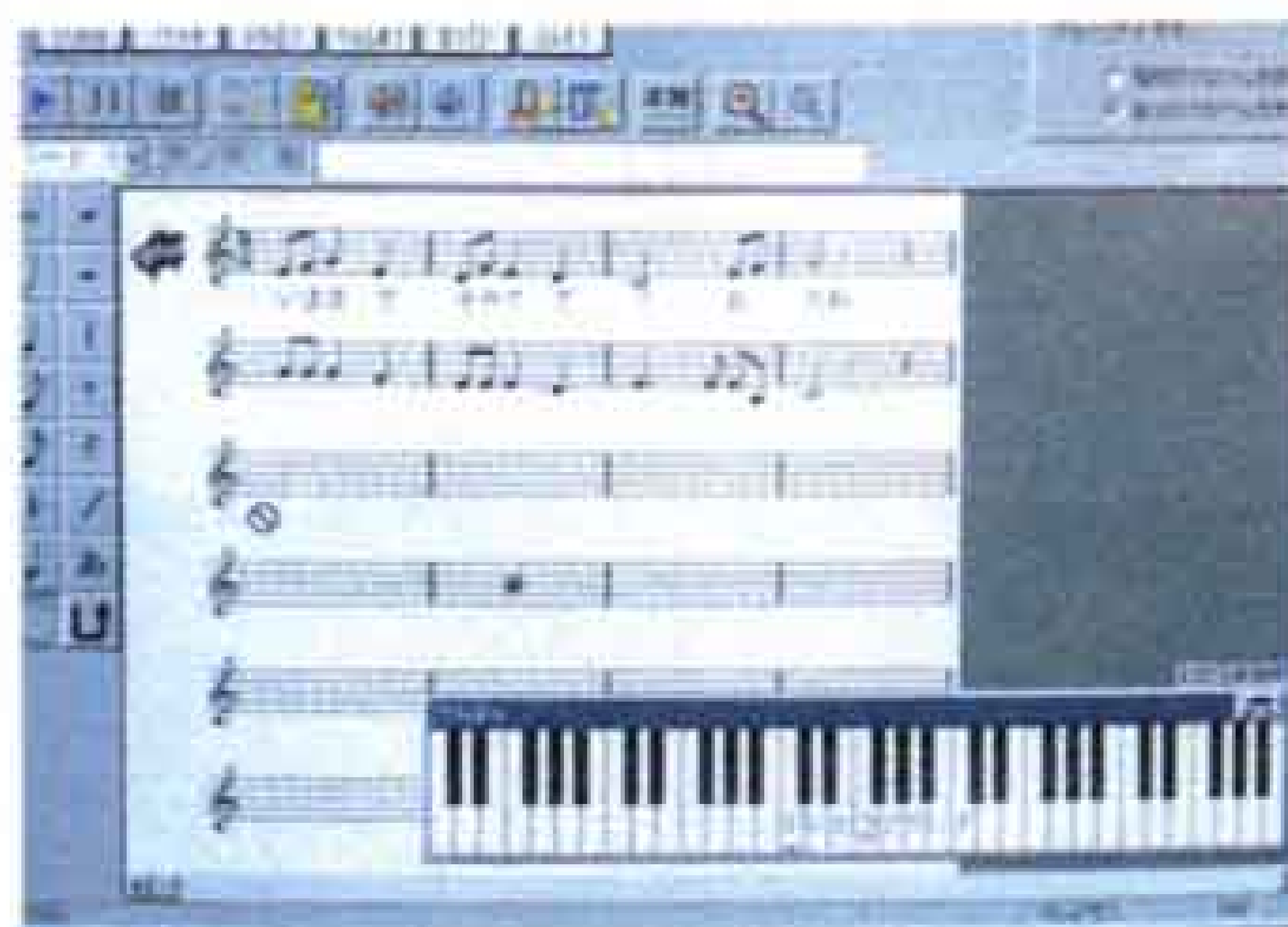
▲▶天間小学校6年生の各学級では、パソコンを使って曲づくりに挑戦。できた歌は卒業式で発表します。