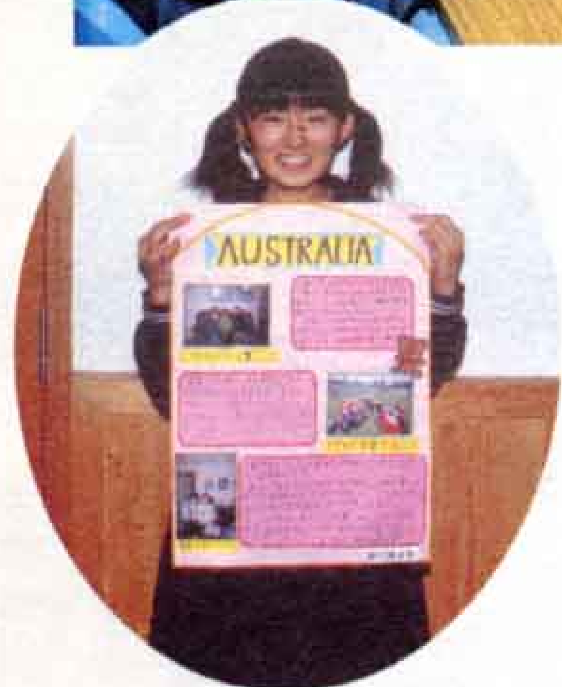
▲姉妹校との交流から関心を持ったことについてまとめました。

▲富士中学校では、平成九年からオーストラリアの「キングスパーク校」との姉妹校交流を続けています。お互いの学校を訪問したり、Eメールのやりとりをしたりするなどしています。