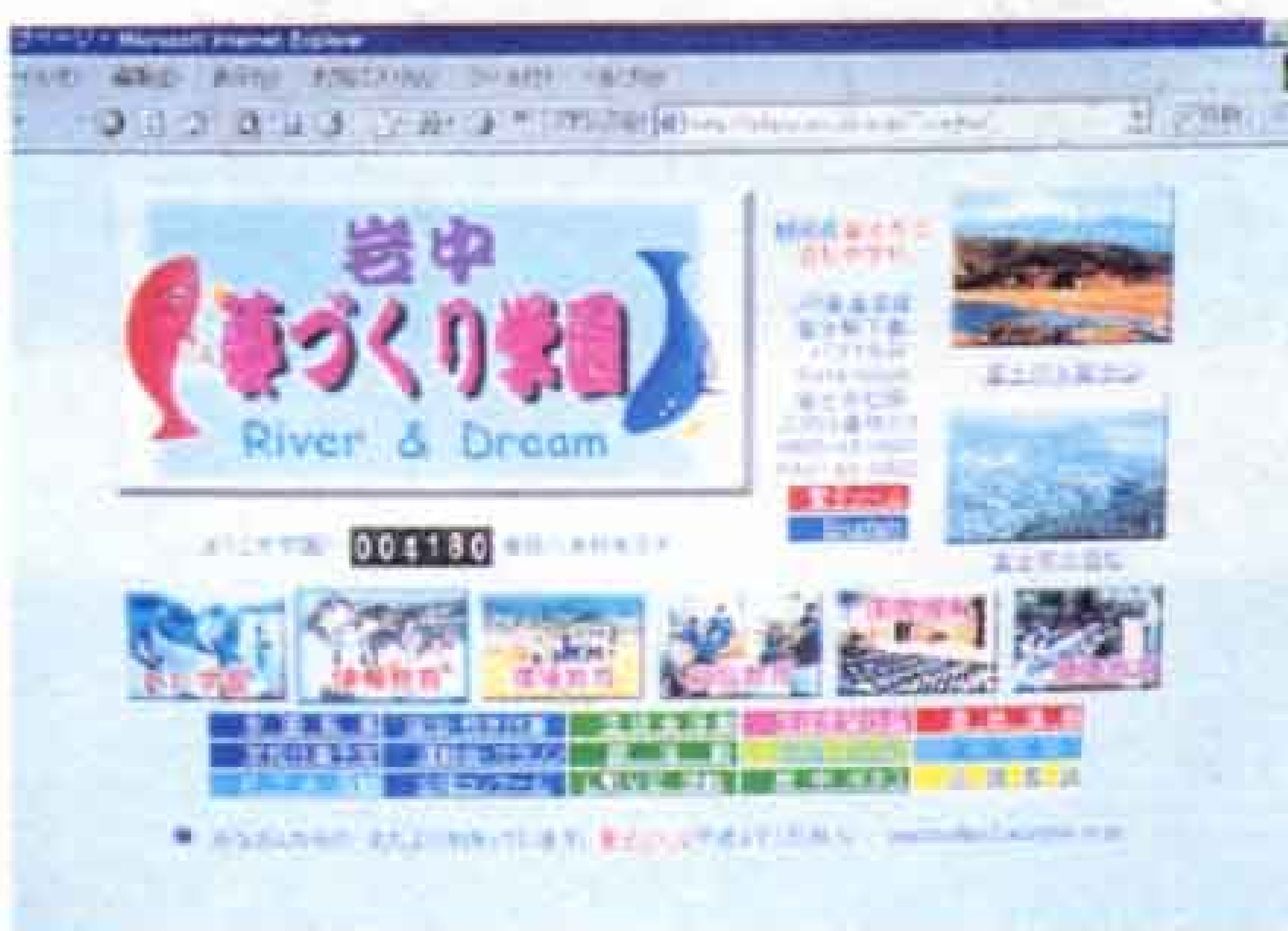
▲インターネットを通じて学校紹介や学校での出来事のお知らせを提供している学校もあります（岩松中学校のホームページ）。

▶中学校でも、各教科でパソコンが使われているほか、選択授業や部活動でも利用されています（富士南中学校パソコン部）。