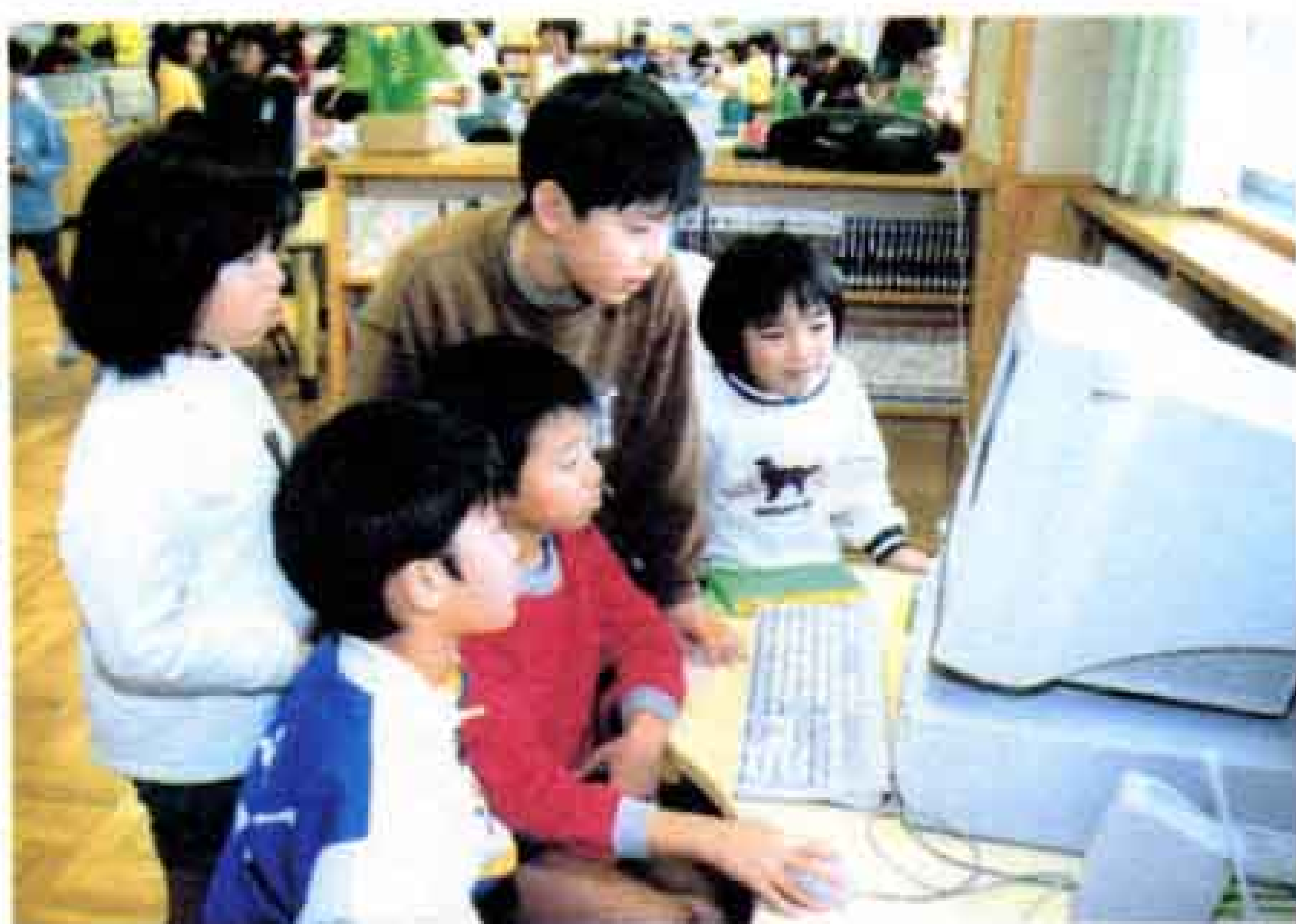
▲学校の図書館では、本の検索もパソコンを利用しています（青葉台小学校）。

明けましておめでとうございます。皆様には清々しい新年を迎えられたことと心より喜び申し上げます。新世紀へのかけ橋となる本年は、富士市のさらなる躍進の年として、大いに期待されるところであります。市議会といたしましては、市民の皆さんの負託にこたえ、健康で明るいまちづくりに向け、なお一層努力してまいります。 どうか本年も相変わらぬご支援・ご協力を賜りますようお願い申し上げます。