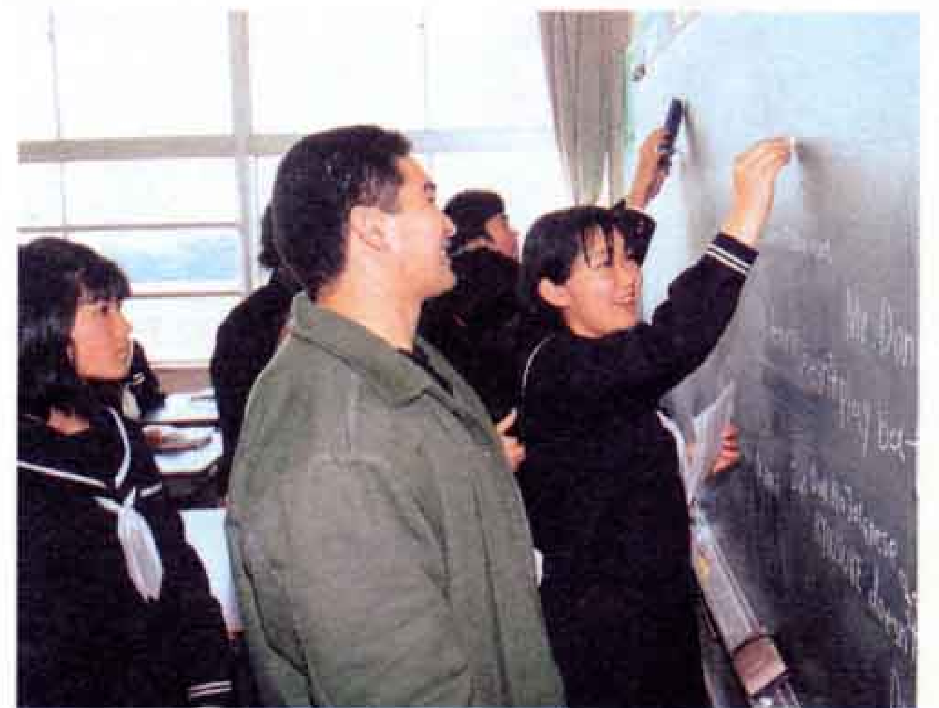
▲ALTのダン先生と一緒に英語の授業。ALTは1年間に市内の全中学校を順次訪問しています（岳陽中学校）。