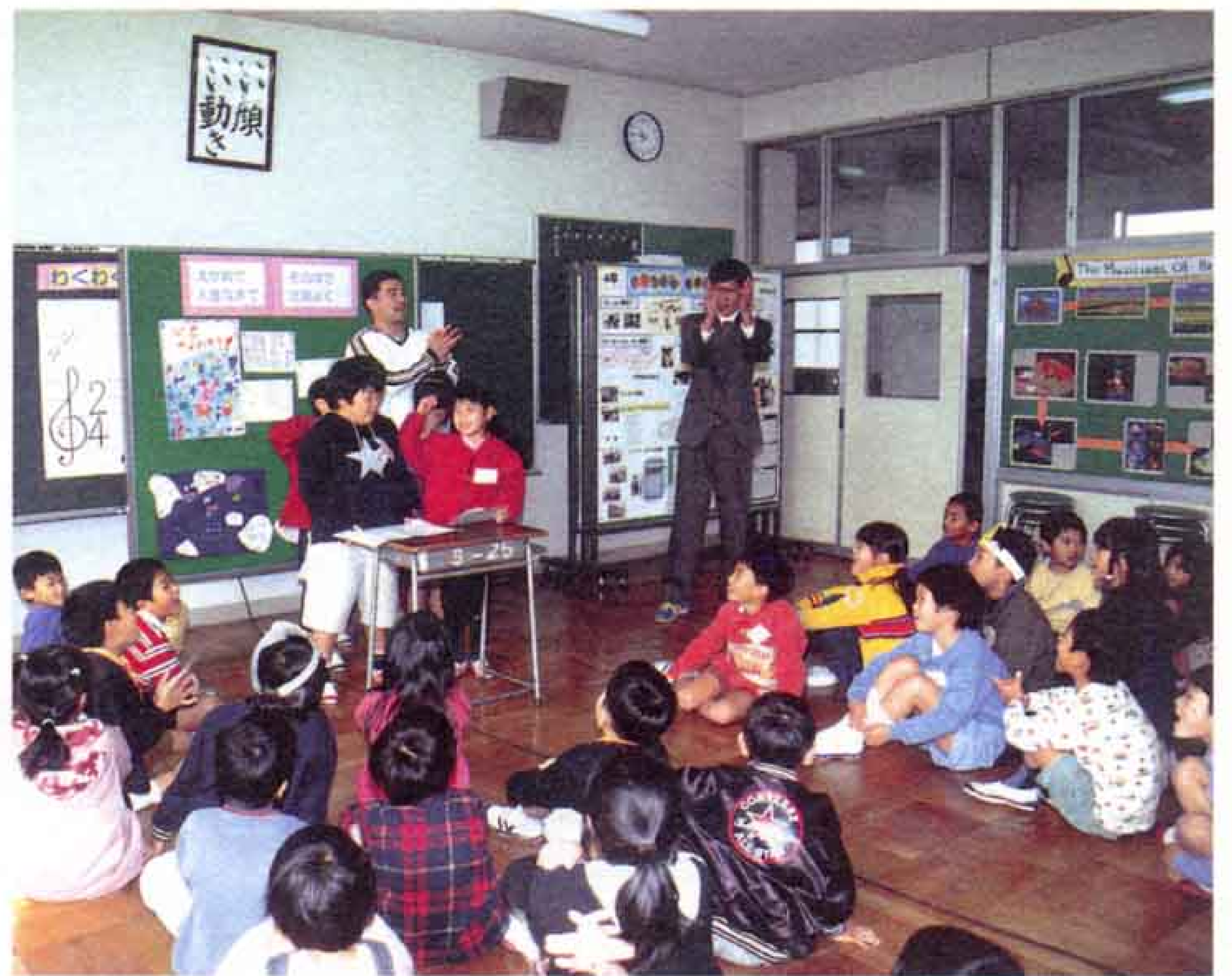
▲吉原小学校は文部省と市教育委員会の指定を受けて、「国際交流科」を設置。全学級週に1時間、楽しく英語を学んでいます。

国際化社会にあつて、必要なのは外国の日本とは異なる文化を知ること、相手を理解し自分を表現するための会話力。小中学校では、異なる文化を持つ人との交流を通じ、お互いを理解し合う心をはぐくむ国際理解教育が進められています。 市の教育委員会には二人のALT（外国語指導助手）が所属。市内の小中学校を訪問し、歌やゲームを織りまぜながら授業を行っています。また、外国人との国際交流を行っている学校もあります。 これらは子供たちにとって生きた英語や文化を学び、国際感覚を身につける絶好の機会になっています。