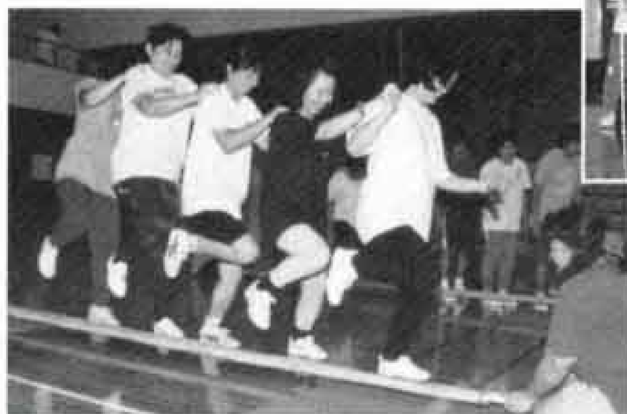
▼③グループ・バンブー・ダンス