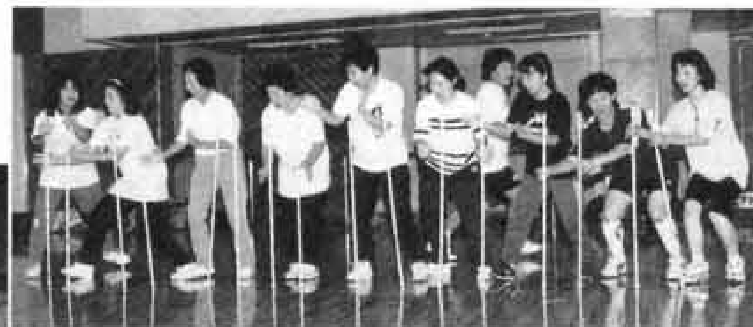
▲②キャッチング・ザ・スティック