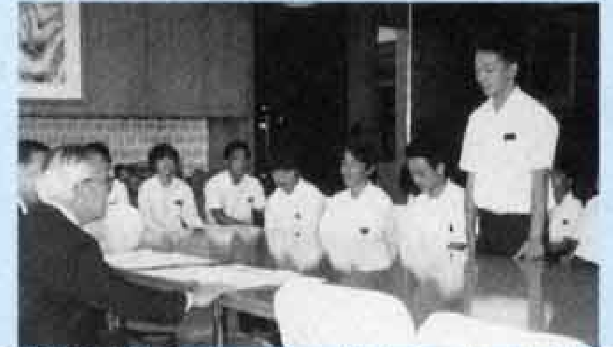
岳陽中学サッカー部全国大会出場 市長表敬訪問