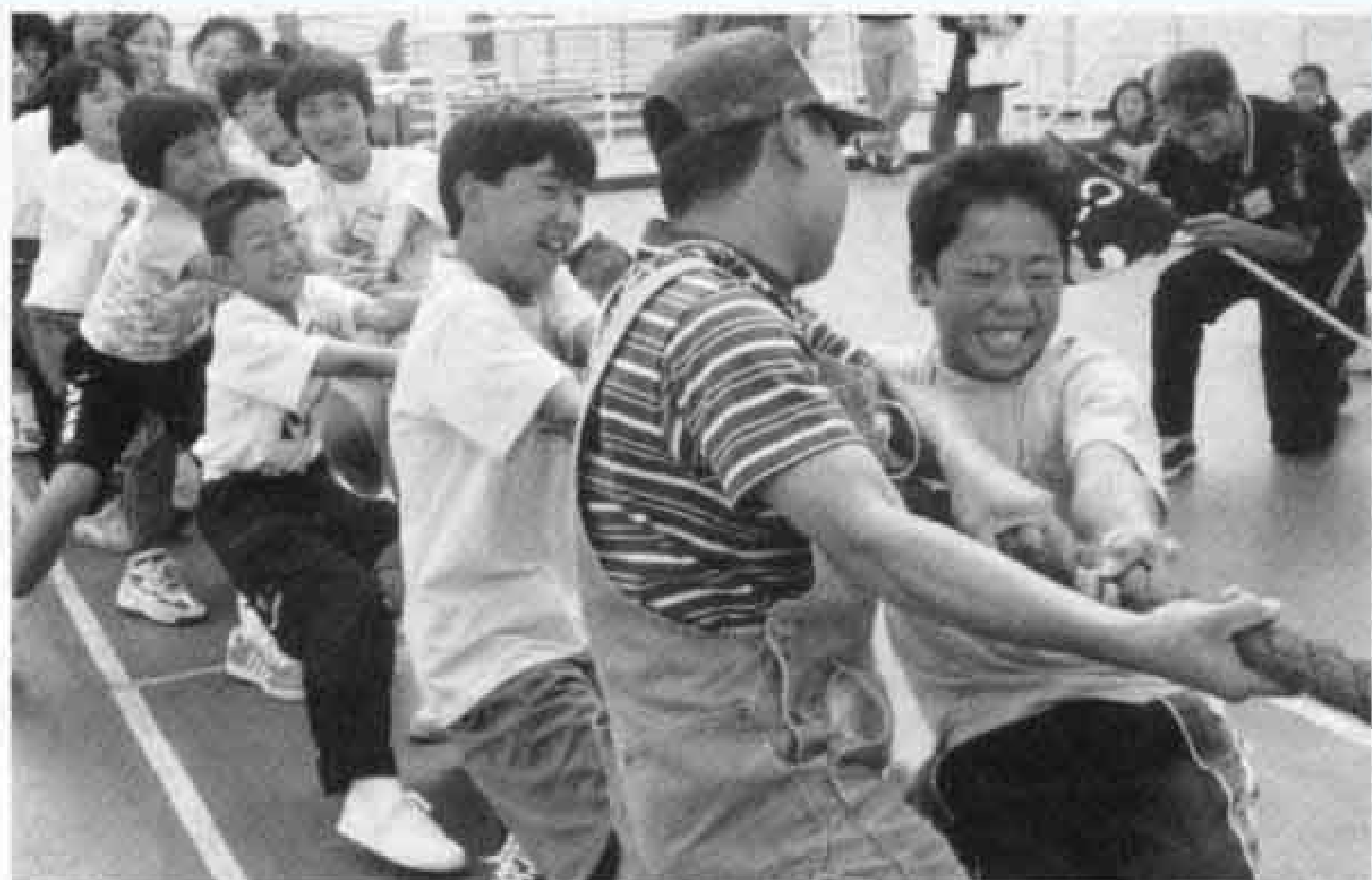
▲洋上での綱引きから仲間づくりが始まりました

富士市青少年の船は、中学生から青年まで合わせて478人の研修生を乗せて、北海道・釧路に行ってきました。慣れない船上生活で船酔いに悩まされた研修生もいましたが、学校や年齢を超えた友達と大きな思い出を胸に、たくましくなって帰ってきました。