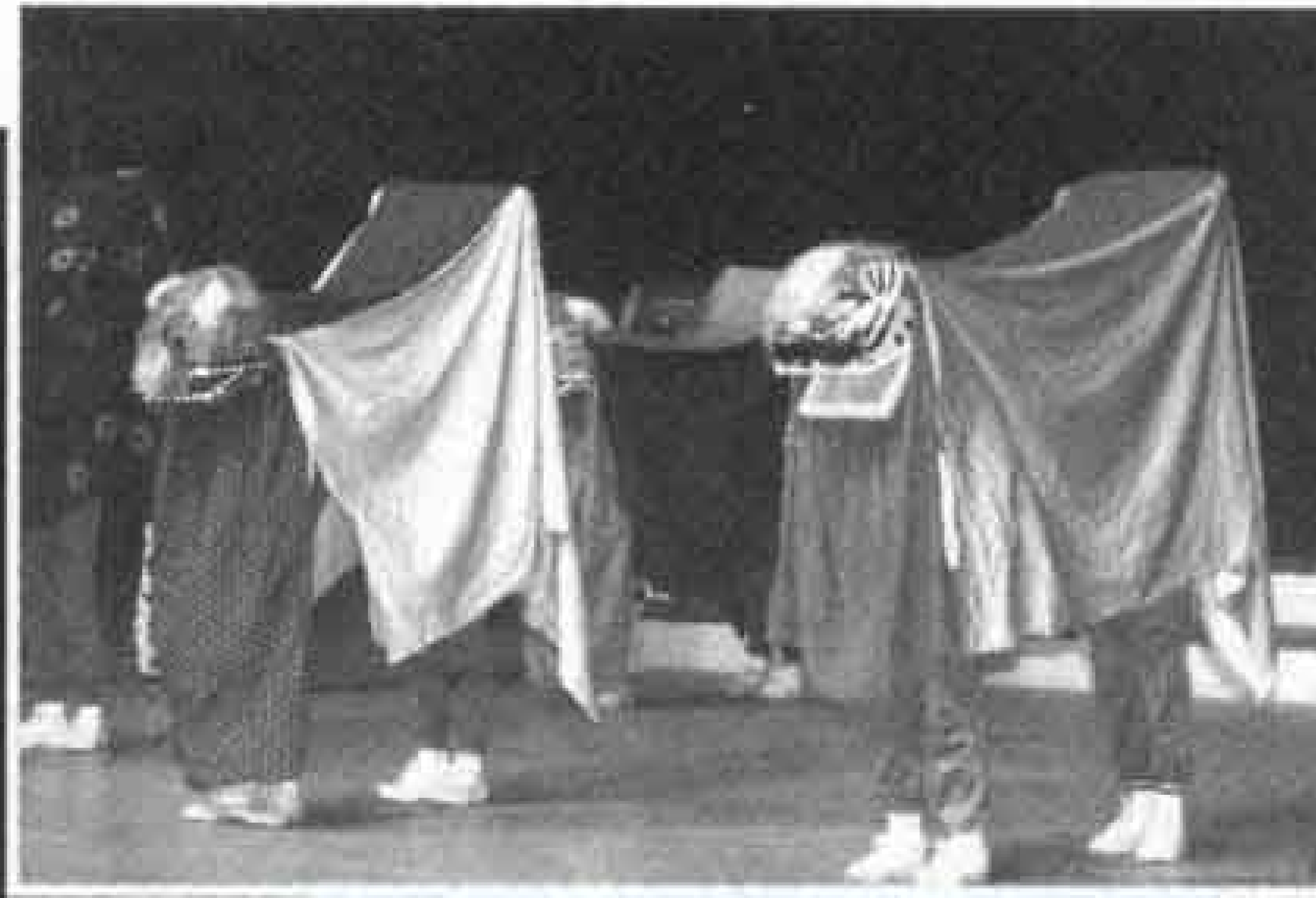
吉原東中は伝統芸能である神楽を披露