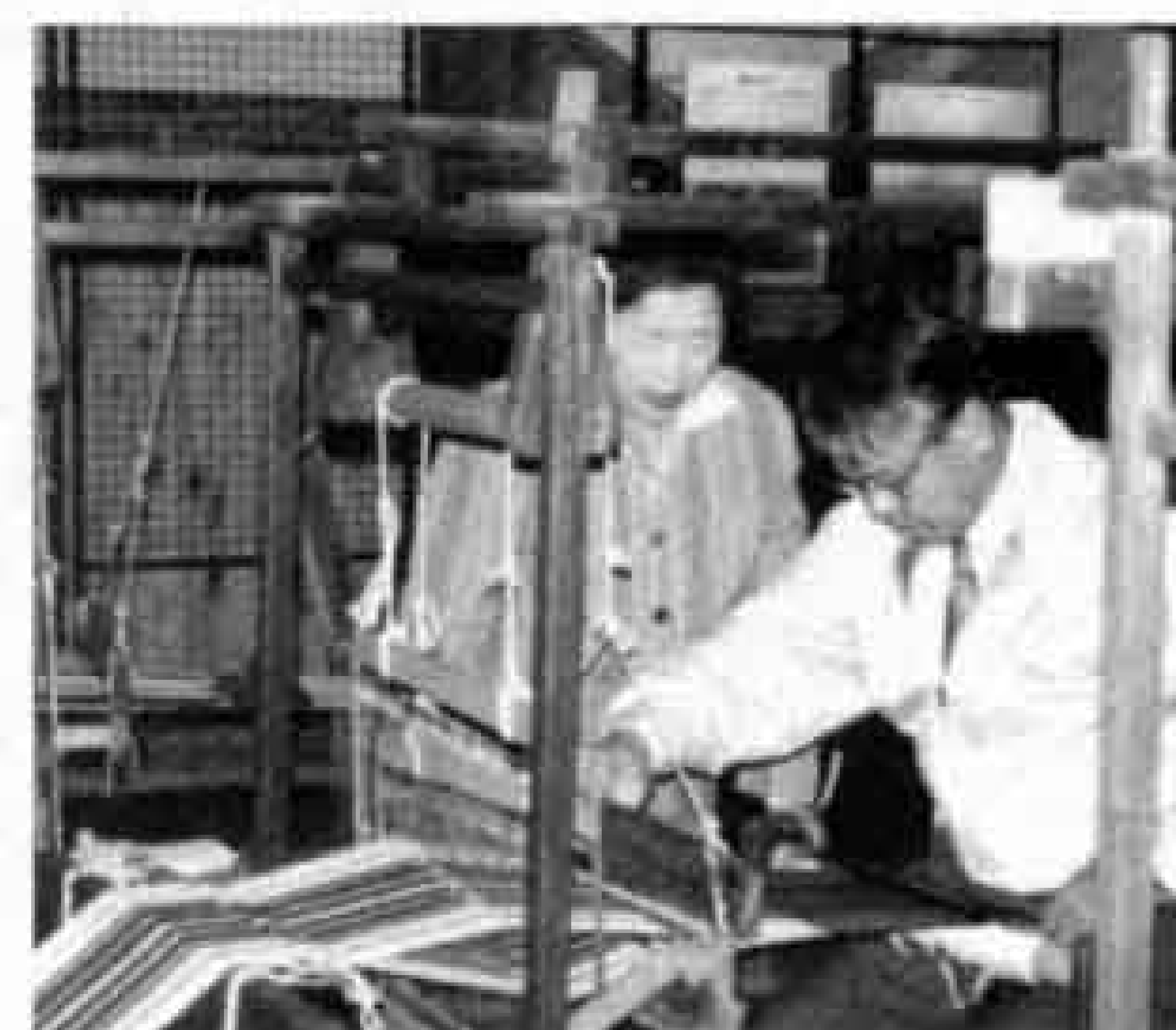
「機織り体験」の様子

第35回企画展 「夢を紡いだ時代 ～旧富士郡下の 蚕糸業とその周辺～」 クイズラリー 12日、25日 機織り体験 1日、18日