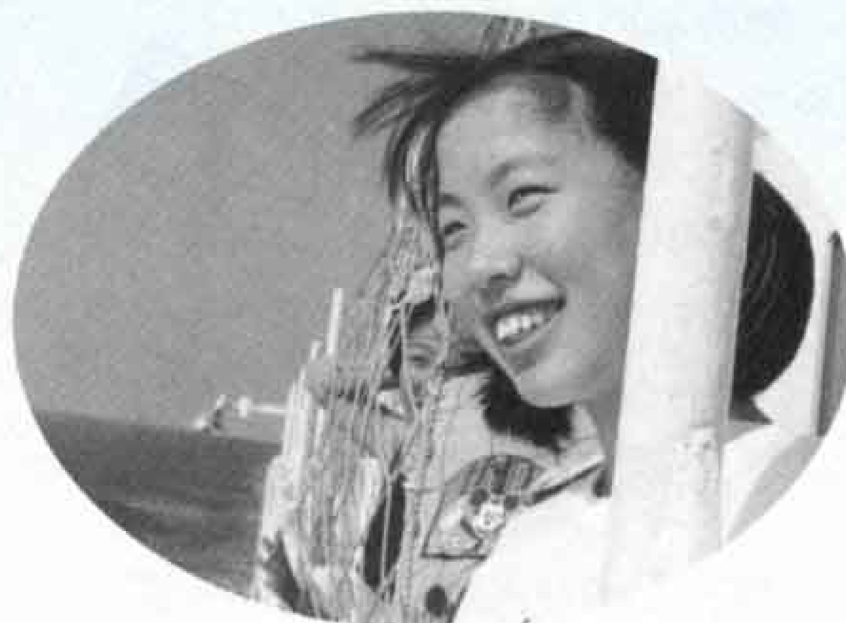
▶海風が気持ちいいよ