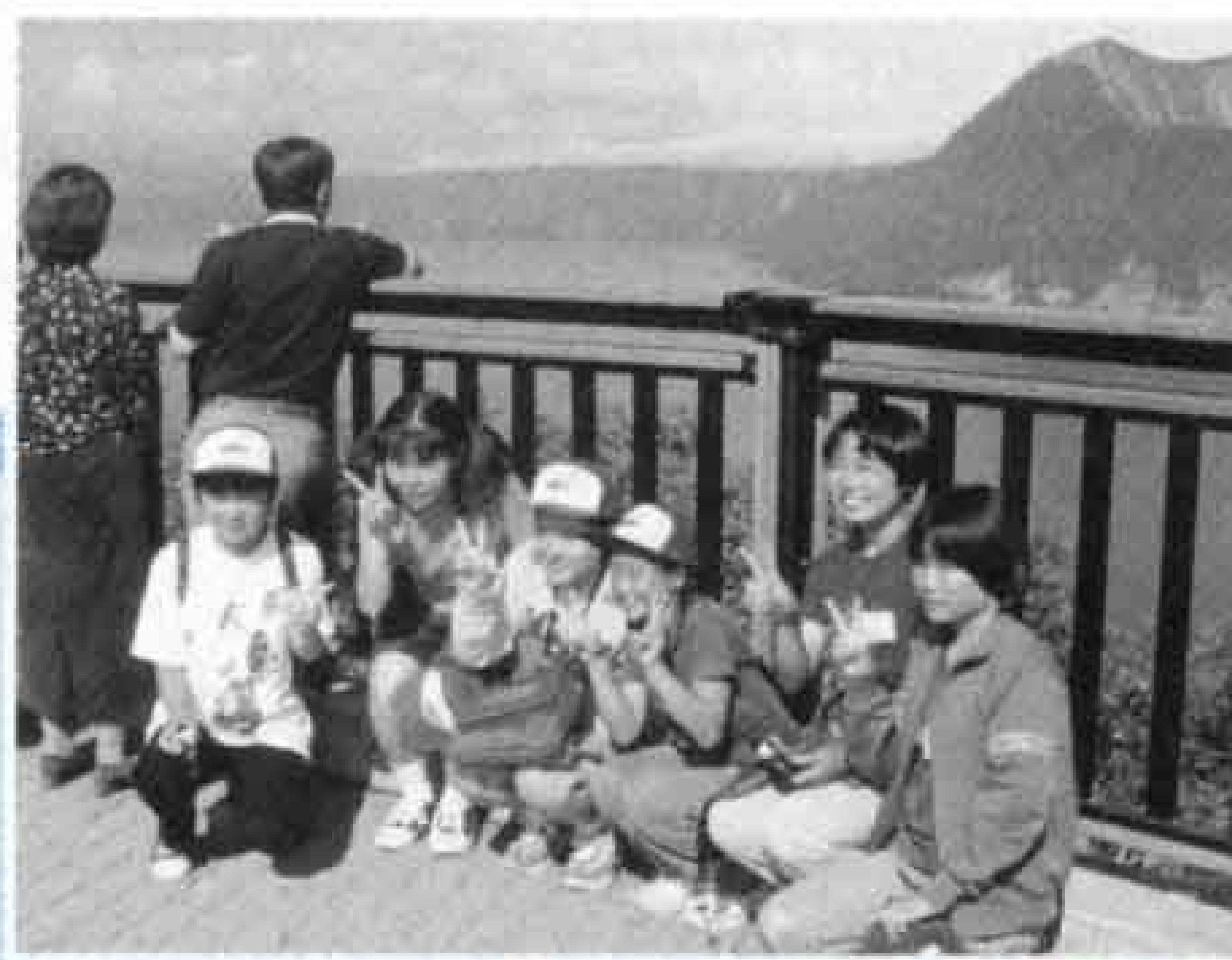
▶神秘的な摩周湖 ましゅう に魅了される研修生たち