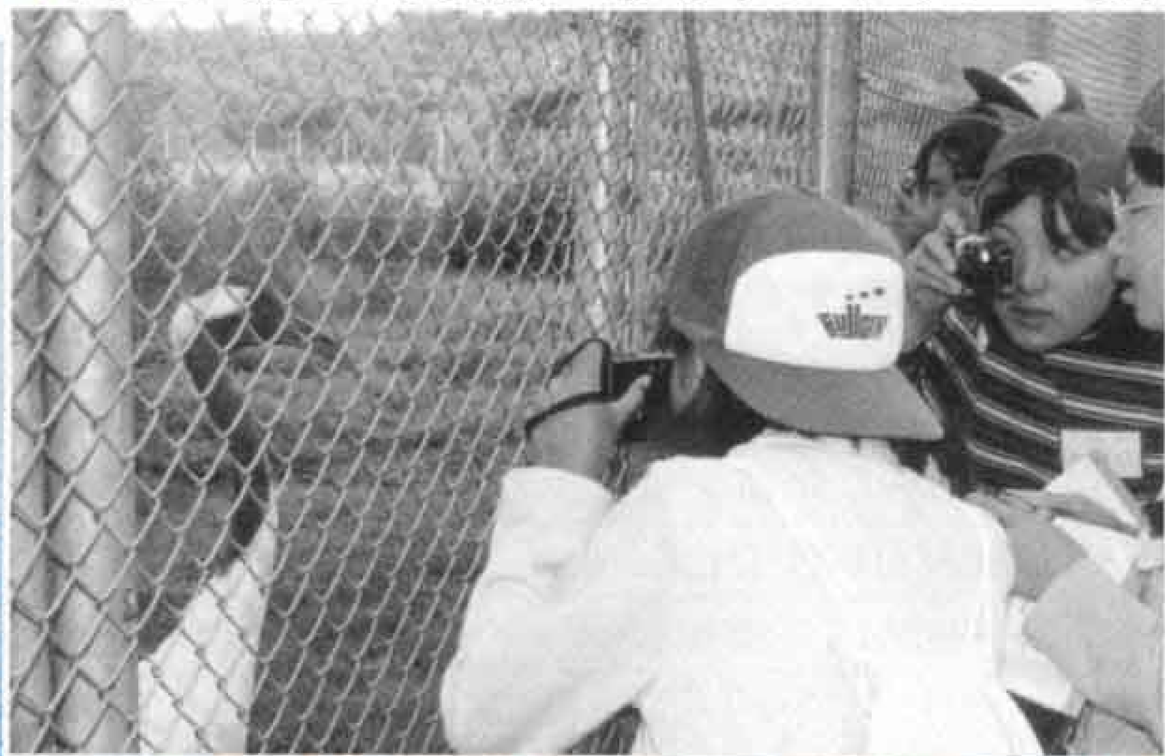
▼間近に見る丹頂鶴 たんちょう に思わずシャッターを押します