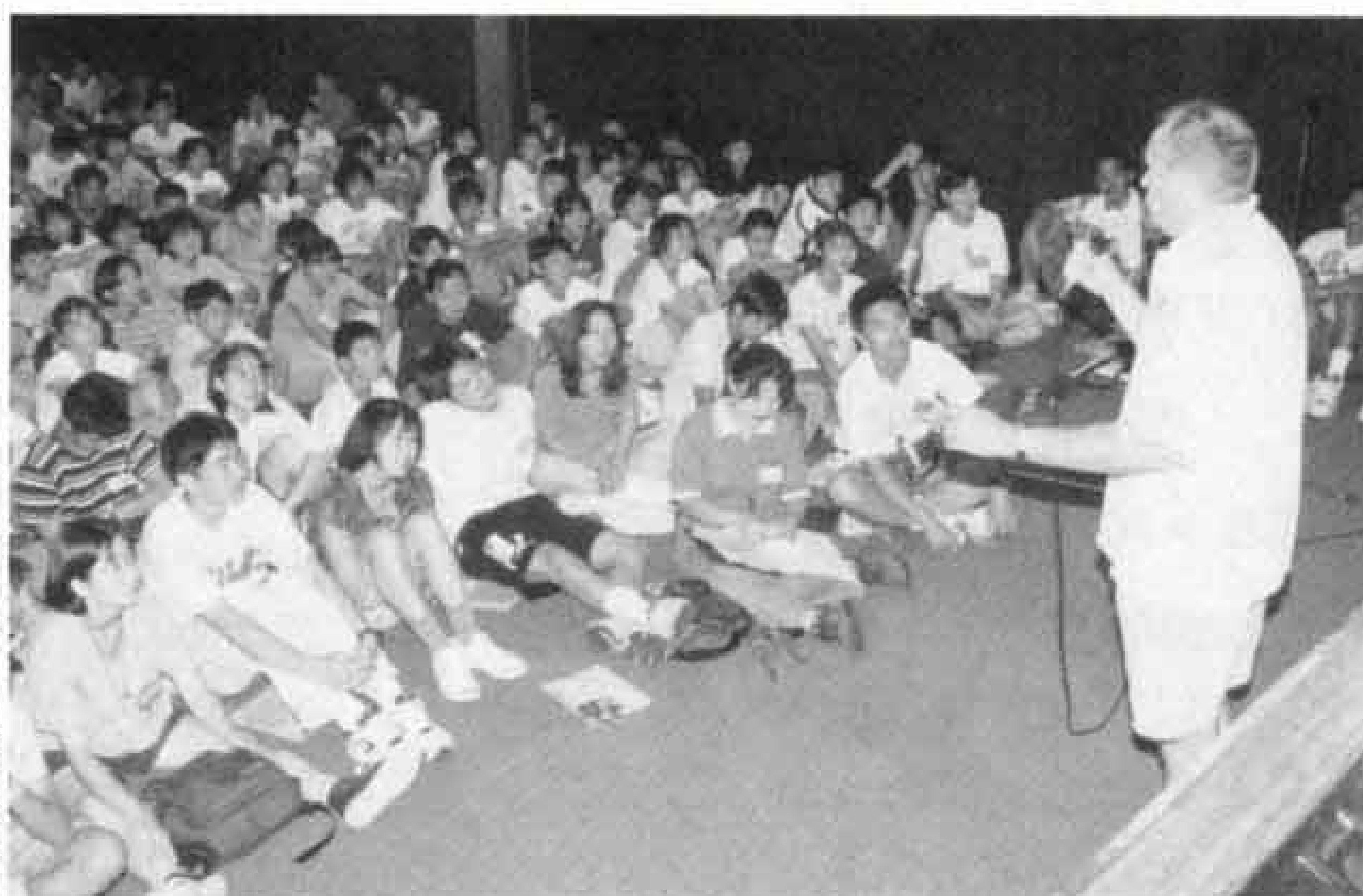
▶ゲームで学ぶ英会話。船内は一瞬外国に