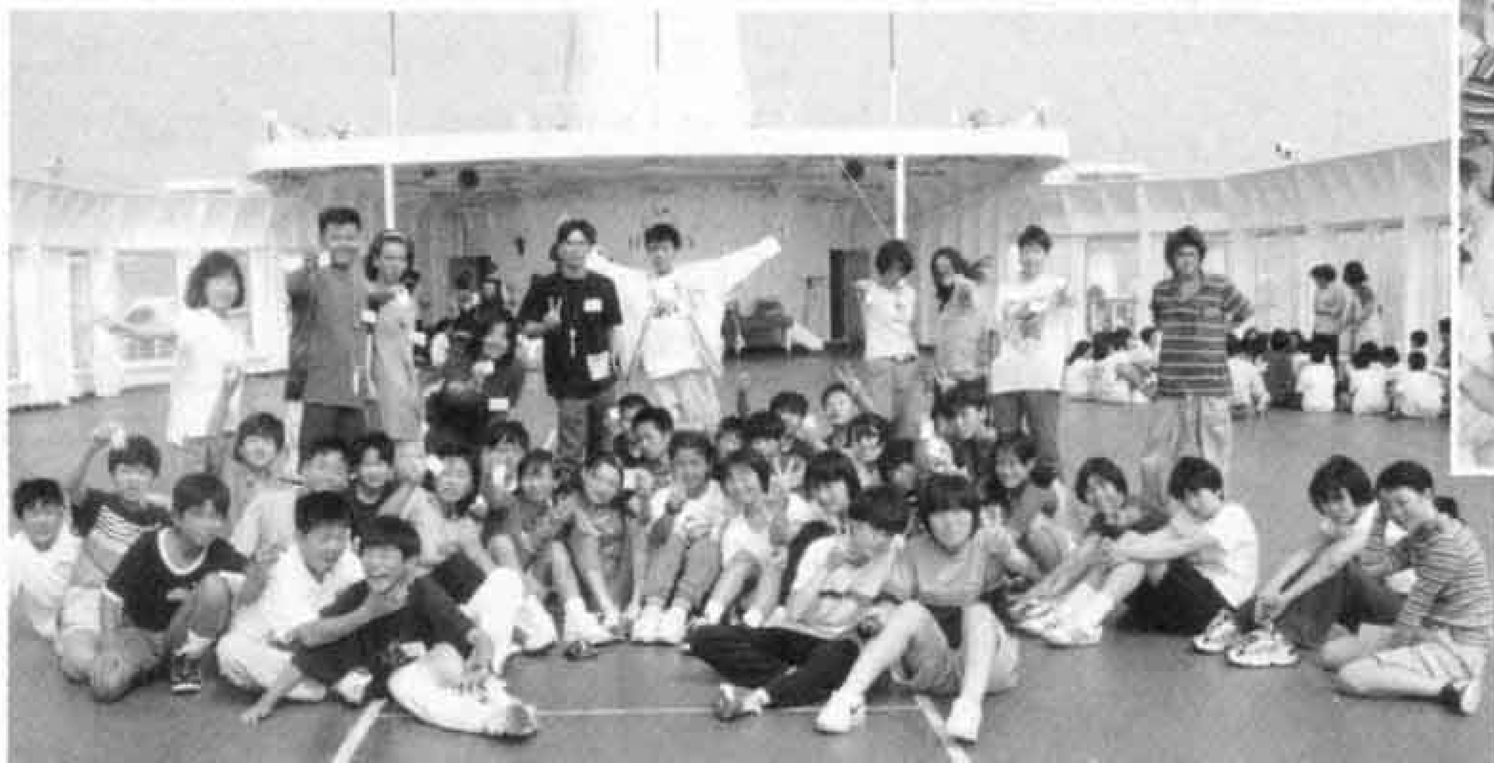
▼自分で考え自分で行動する「夏夢音 かむおん タイム」