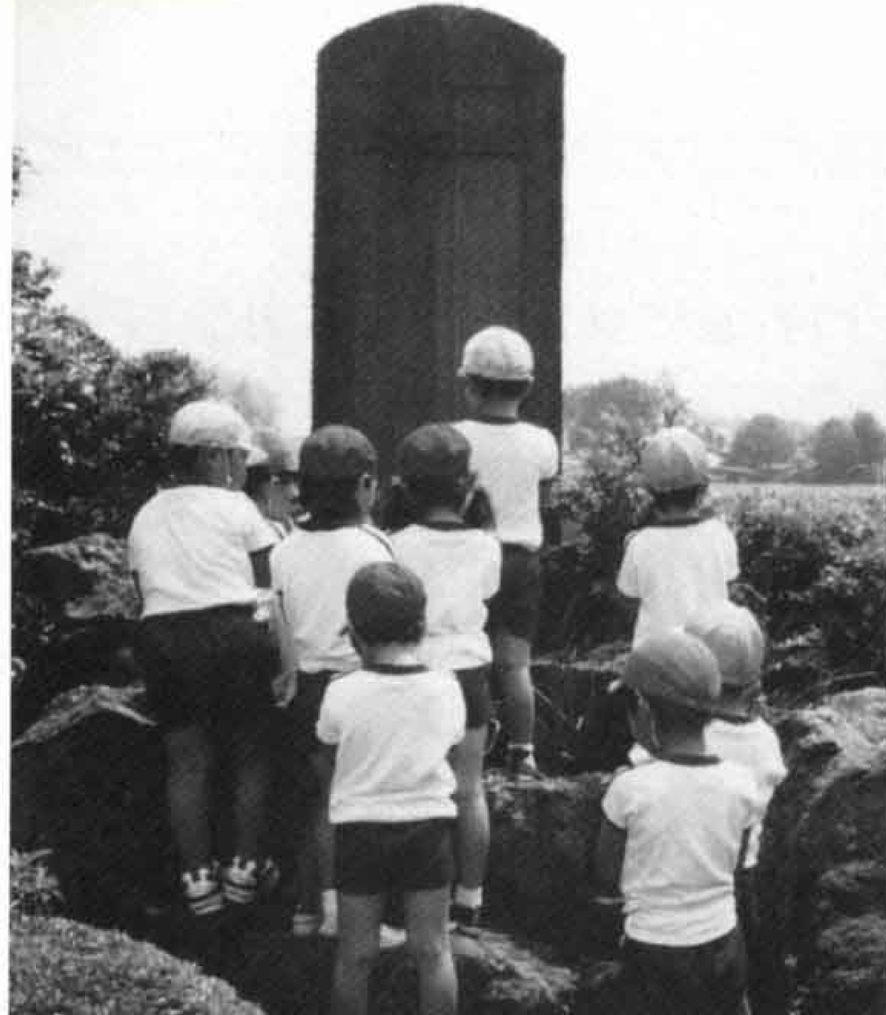
市立大淵幼稚園では、毎年プール開きの日に