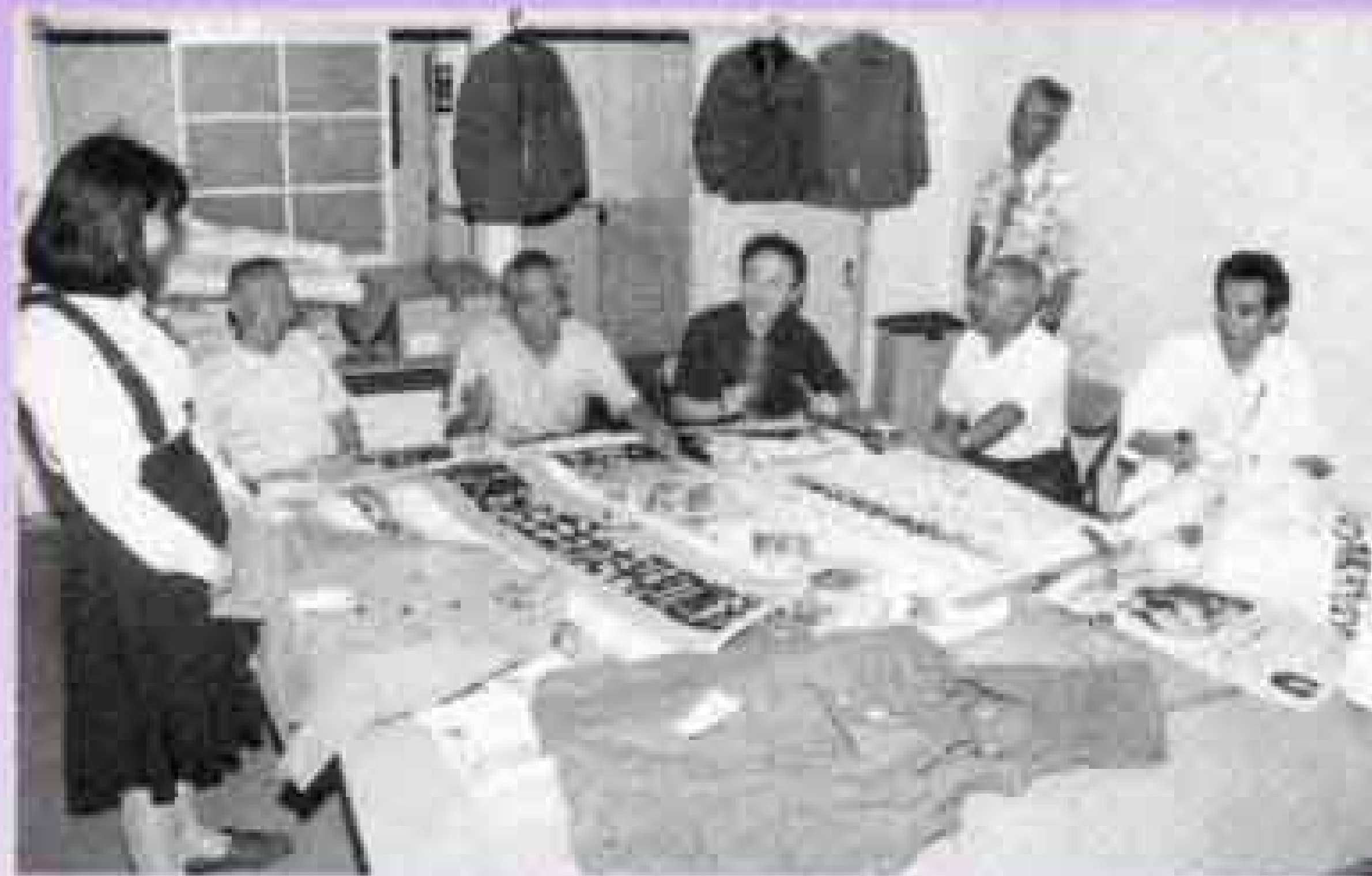
十周年記念戦争展の準備を進める実行委員の皆さん

★問い合わせ★ 「平和のための富士戦争展」実行委員会 事務局 富士市職員組合 内線2151