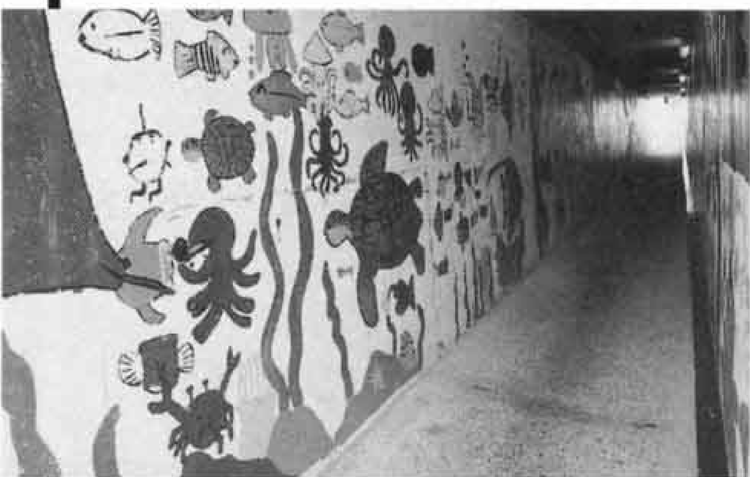
壁には、カラフルなクジラ、タコ、カニなどが描かれています

この地下道は、前田区の子供たちの通学路になっており、区では深刻な問題となっていました。そこで、四月になってからは、毎日父兄が二人ずつ交代で、下校時間に合わせて地下道周辺の監視を続けてきました。こうした中、父兄から犯罪防止のた