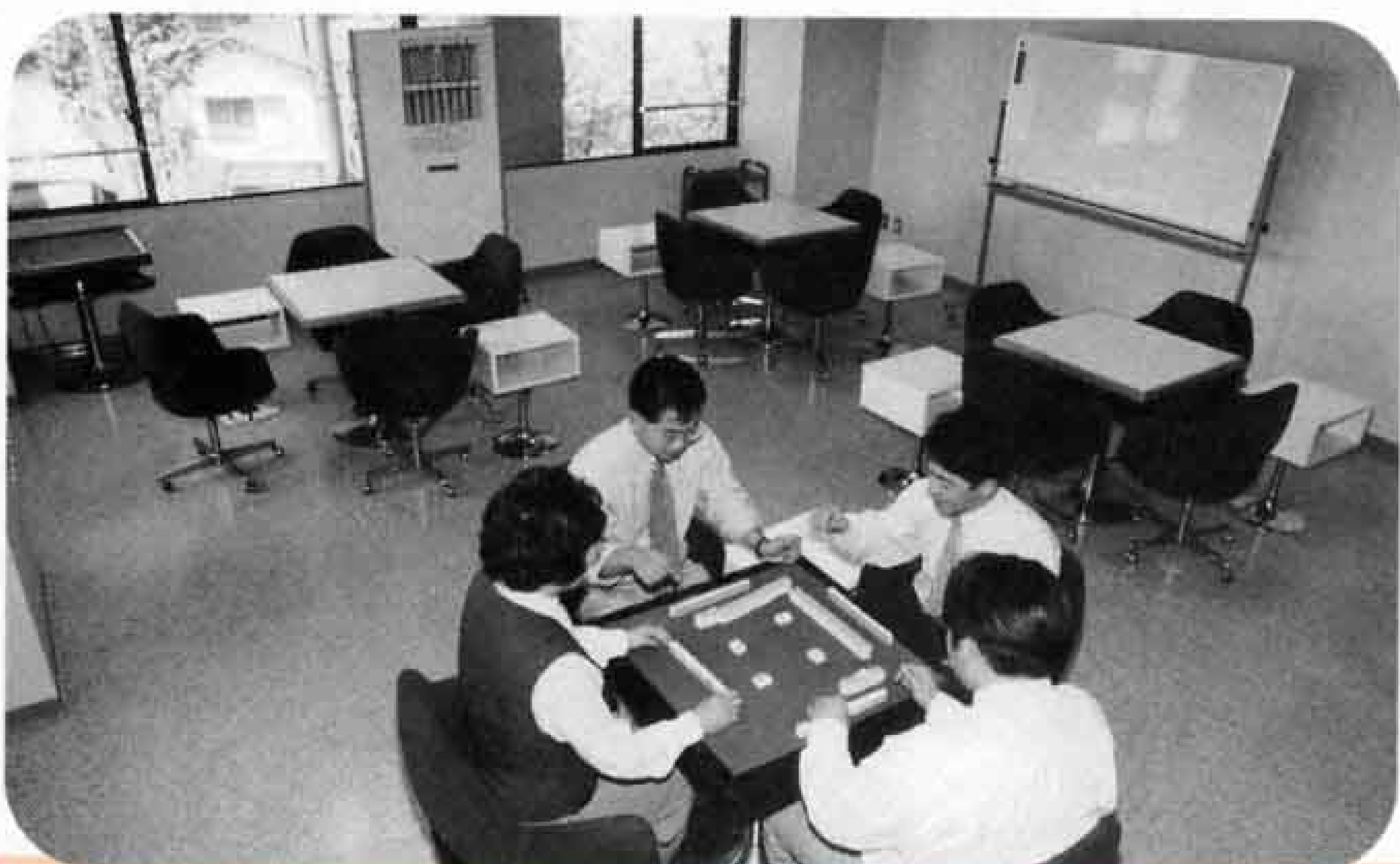
コミュニケーションルーム

また、趣味と娯楽の部屋「コミュニケーションルーム」では、囲碁やマジシャンなどで、仲間との親睦を深めてください。一日じゅう使っても、一人八百円と安い料金で使うことができます。食事が必要なときは、二階のレストランから出前をしてもらえます。日ごろの疲れをリフレッシュするにはもってこいのスペースです。