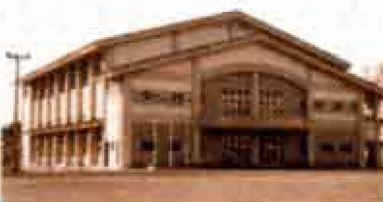
元吉原中学校屋内運動場

市は、毎年郵政省の簡易生命保険 ☆年金積立金☆ 積立金や厚生省の年金積立金から、クリーンセンターききょう、中央病院医療機器、富士駅南公民館 低金利で融資を受けています。市が施設を建設するには、皆さんからの ☆簡易生命保険積立金☆ 税金のほか、この融資も建設資金の一部に充てられます。平成8年度も富士総合運動公園、岩本山公園、元吉原中学校屋内運動場、富士中学校校舎、市営住宅駿河台団地、(仮称)広見第2小学校校舎ほかの融資を受けました。