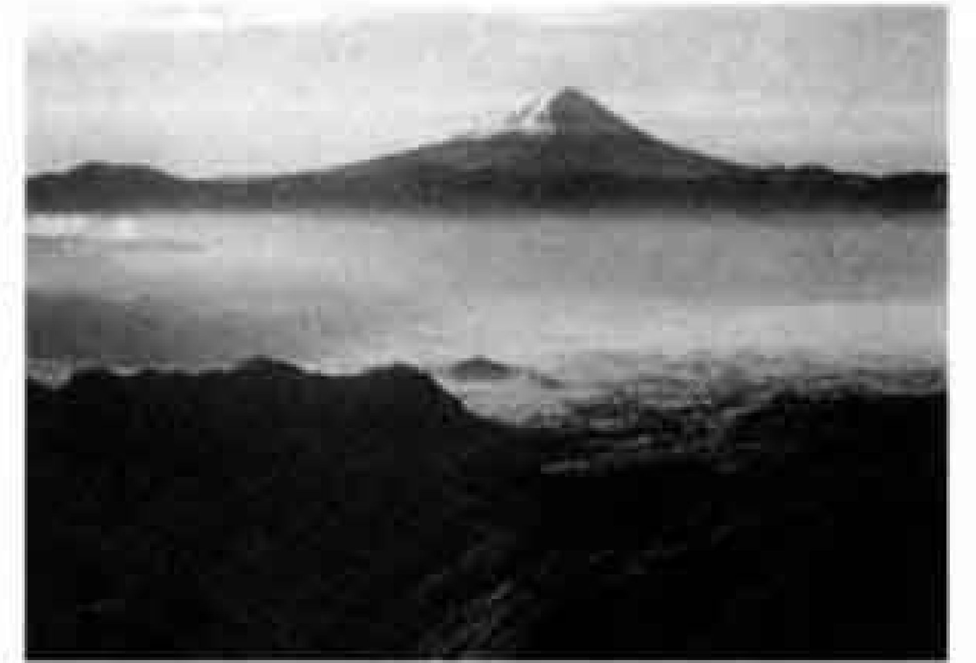
富士山写真展作品