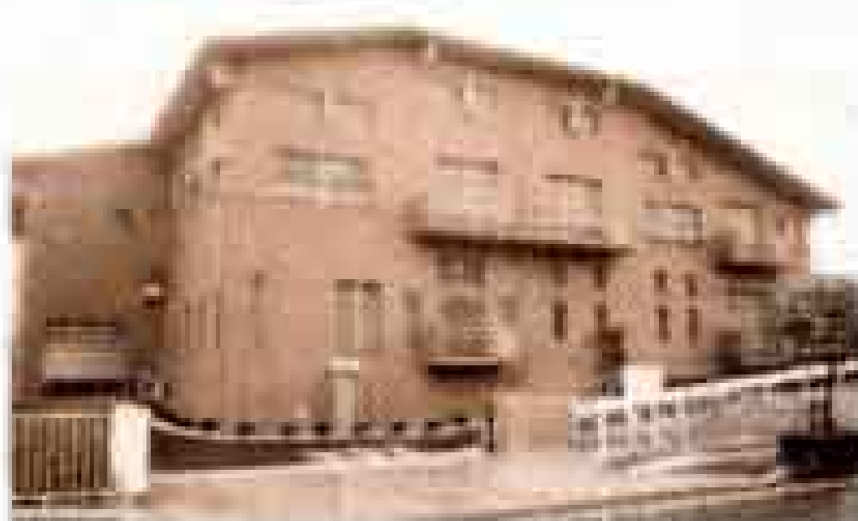
クリーンセンターききょう