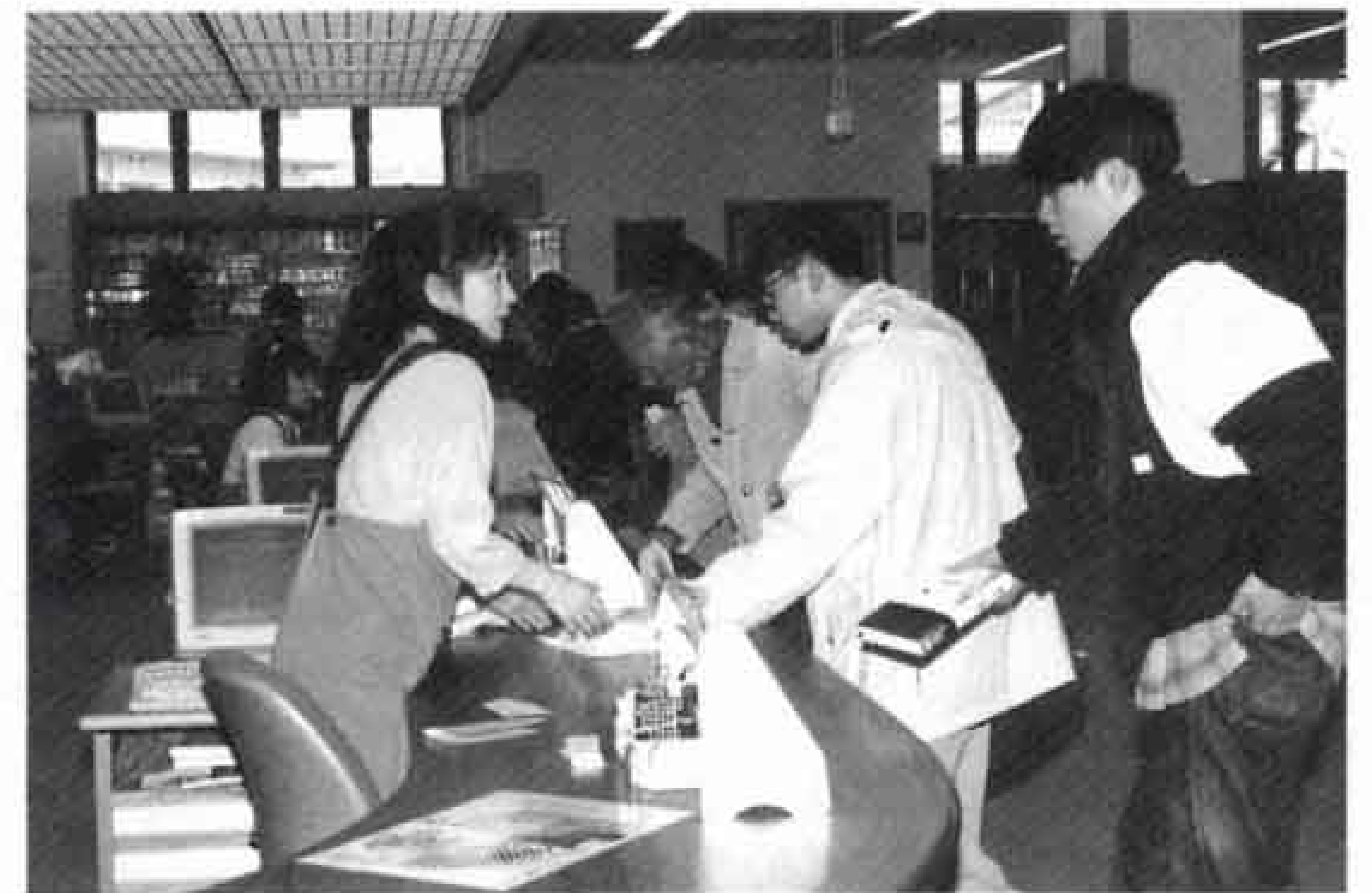
中央図書館は、平成9年度も水曜日と木曜日、開館時間を夜7時までに試行的に延長します。