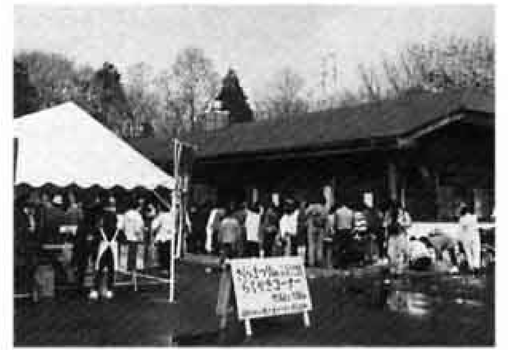
さくらまつり in ふるさと村

さくらまつり in ふるさと村 6日 10:00～15:00 企画展「富士川の舟運」 6月1日まで クイズラリー 12日、26日 機織り体験 6日、19日、25日