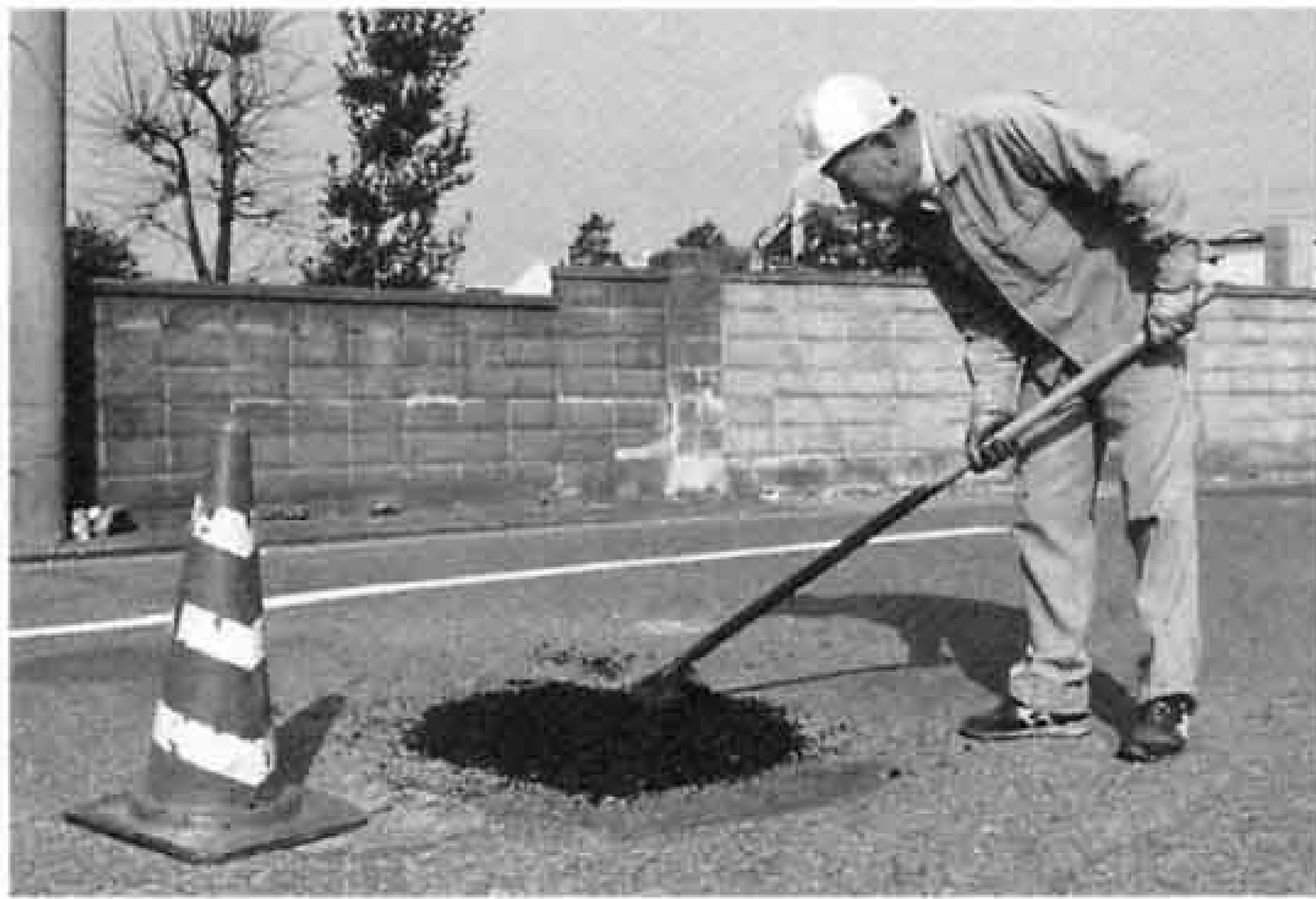
道路の穴などの危険箇所を補修する業務は、平成9年度から民間委託されます。