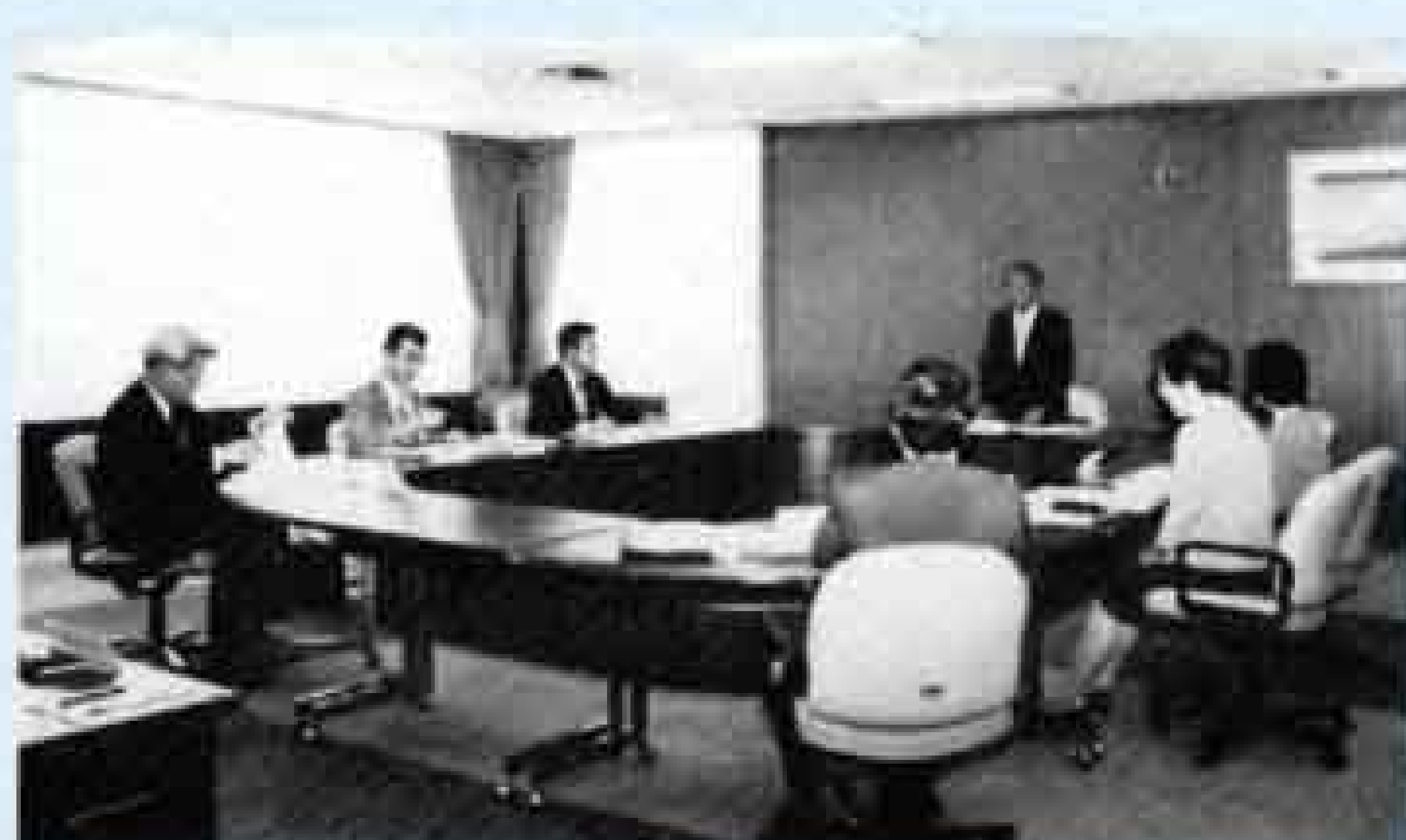
市民サイドから行政改革を考える 「富士市行政改革市民懇談会」

行政改革は、新しい視点で取り組むことが必要だと思います。現在は、財政状況が大変厳しくなっているの で、市の職員は意識改革をして、常に税金を使っているという気持ち を忘れずに仕事をしてほしいですね。