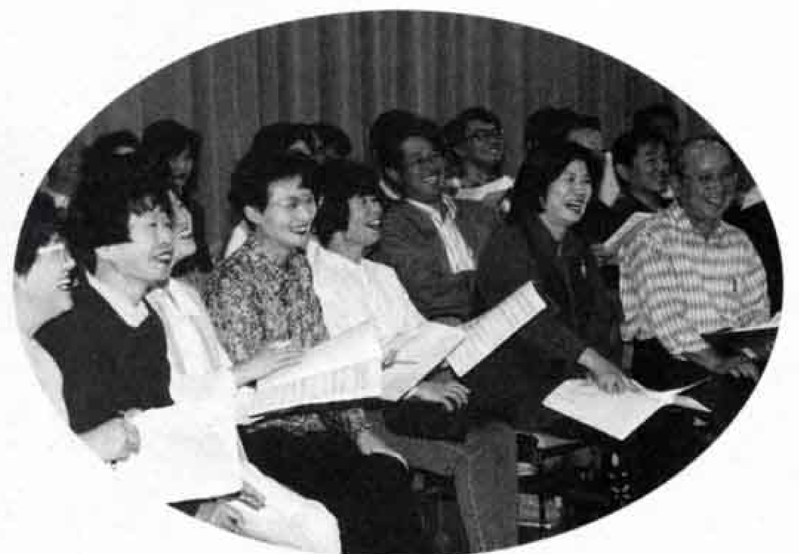
▲厳しい練習の中にも、時には笑い声が…