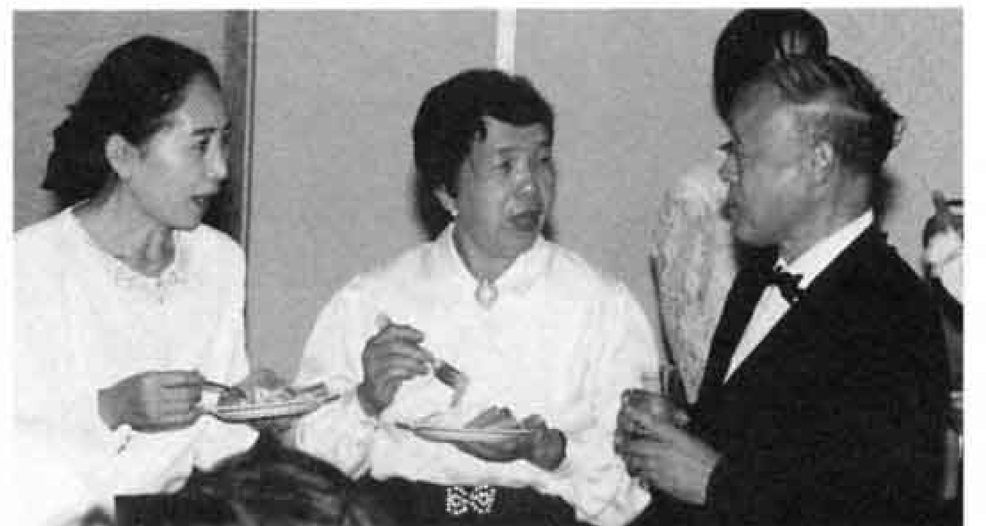
▲この合唱を通じて知り合った仲間たちと、尽きない話が…