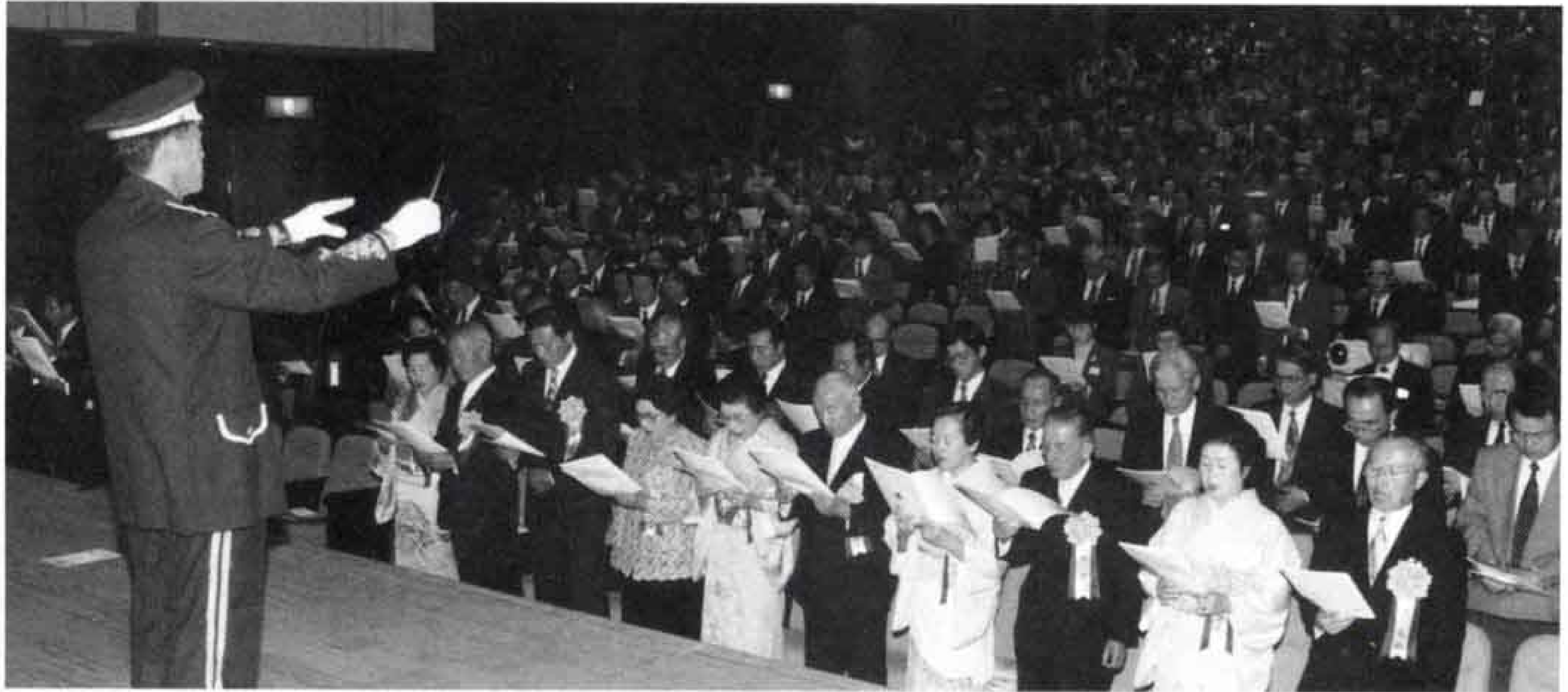
近隣市町の代表や市内の関係者などの来賓約千二百人が大ホールの観客席を埋め、富士市の三十周年を祝いました。 そして、式典の最後には、消防音楽隊の演奏により出席者全員で富士市民歌を高らかに歌い上げ、富士市の発展を祈りました。