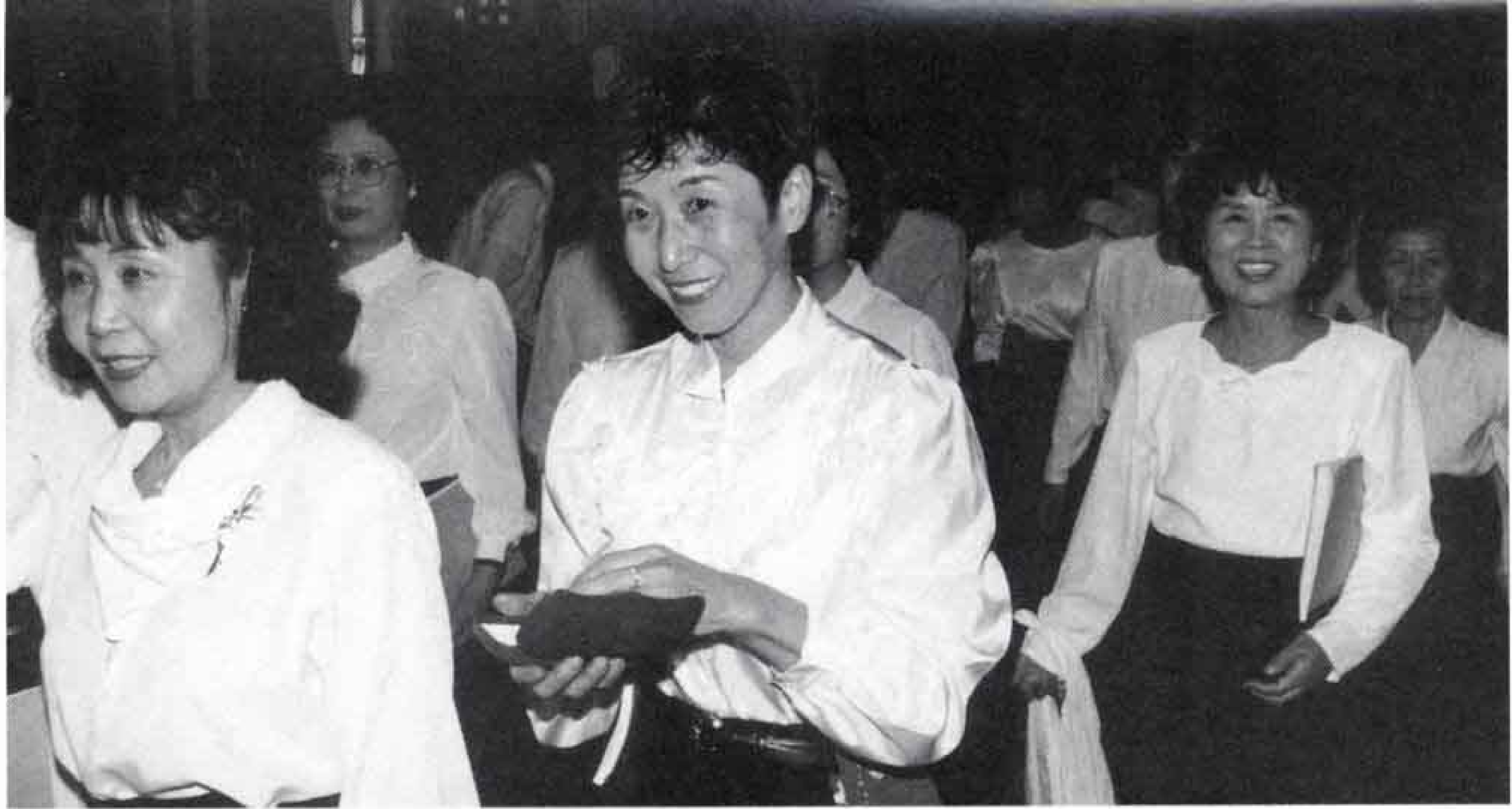
▶舞台からおりた直後の笑顔。皆さんほっとした表情を見せていました