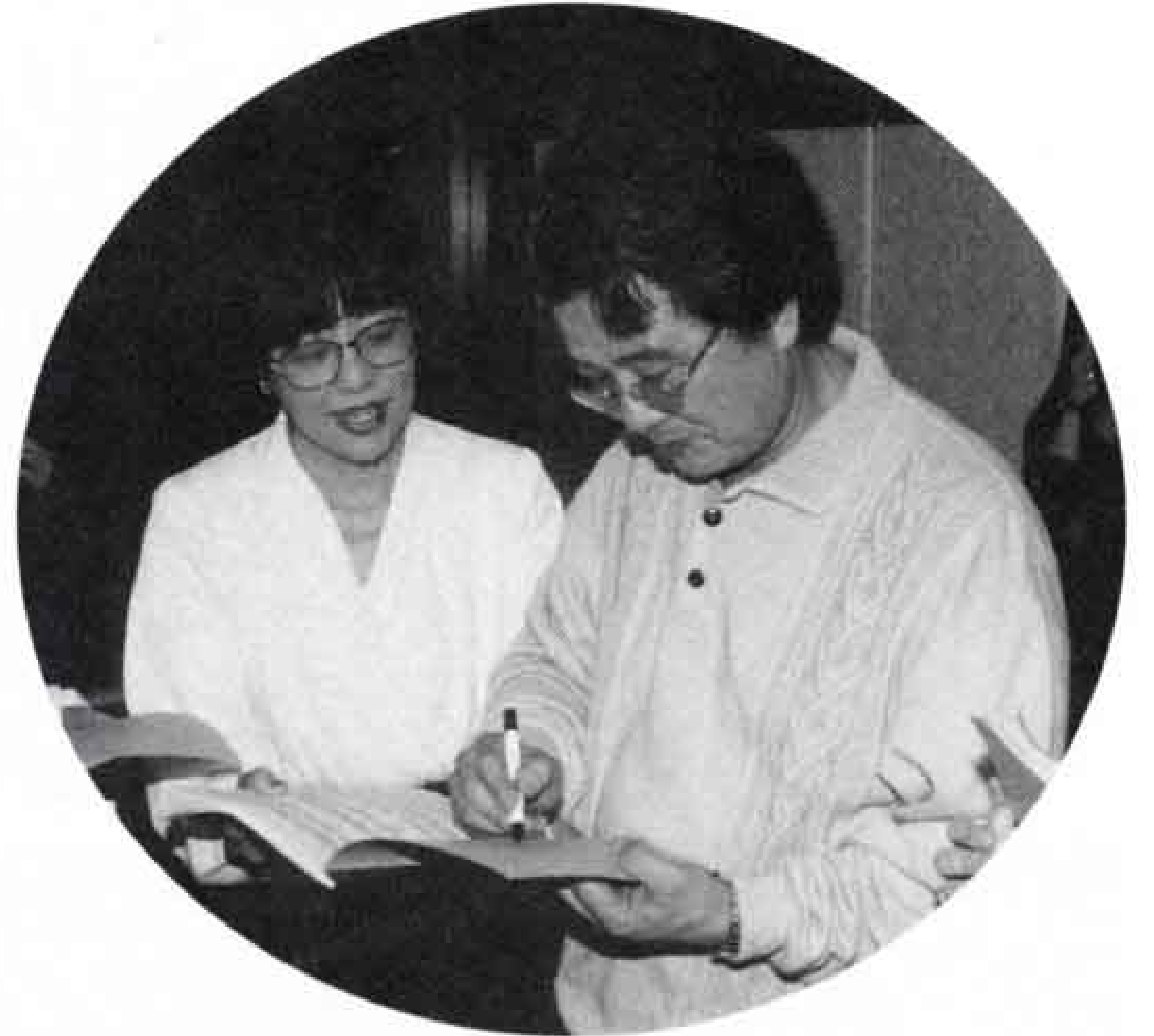
▲楽譜に堤先生のサインをもらう一幕も