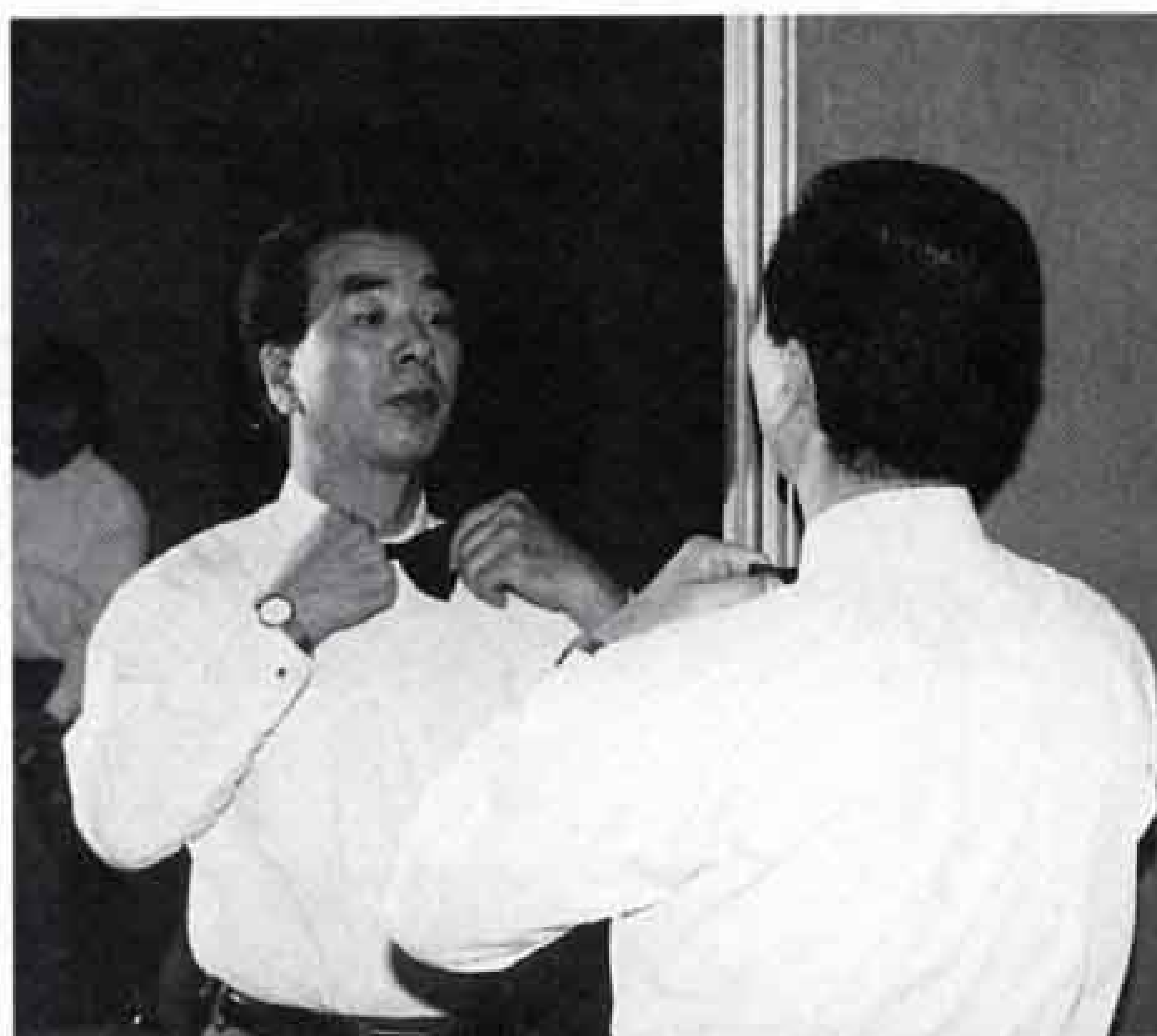
▲さあ、衣装もばしっと決めて、いざ出陣！