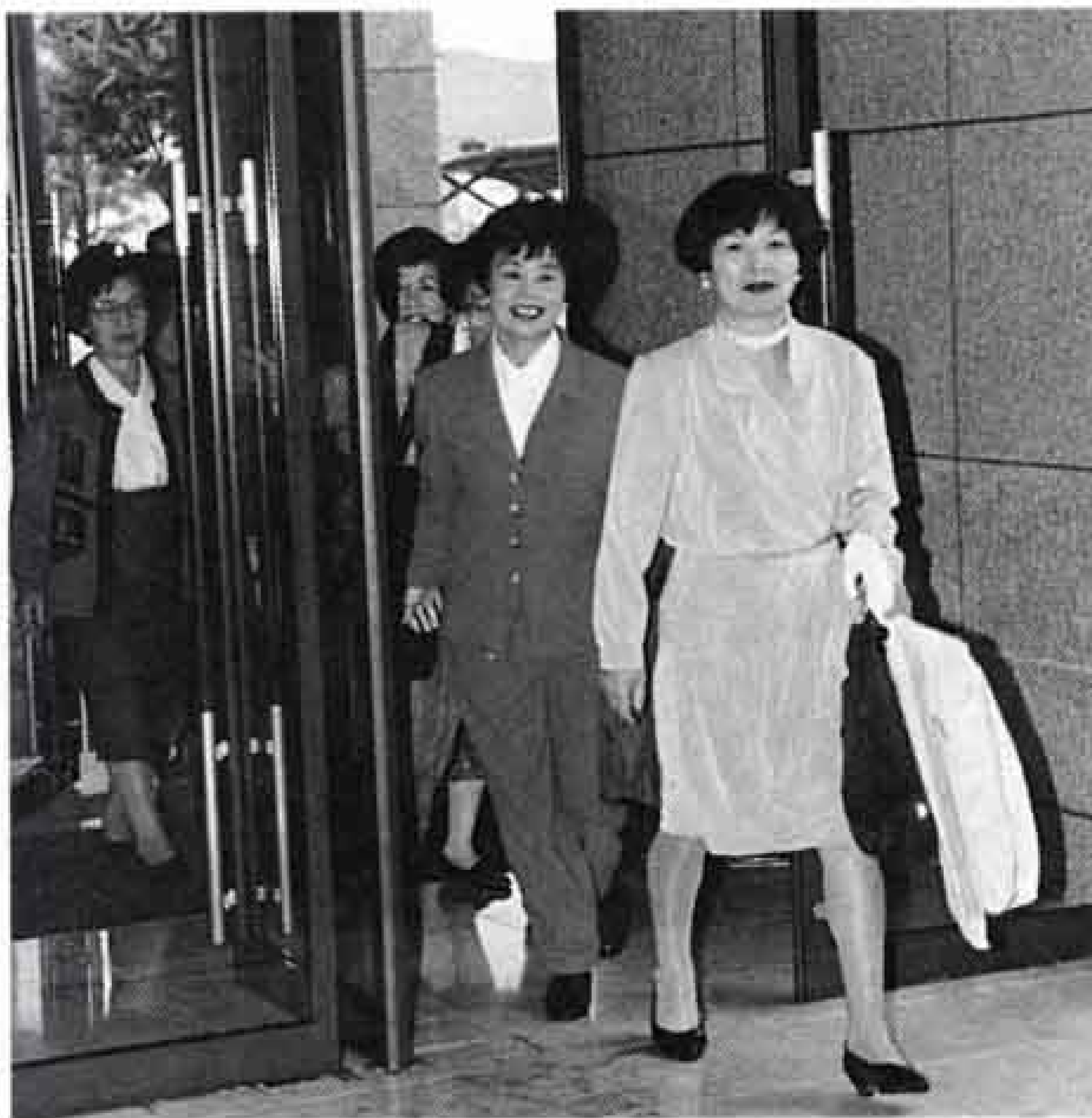
▲「おはようございます。がんばりますよ」と元気いっぱいにロゼシアターに登場！