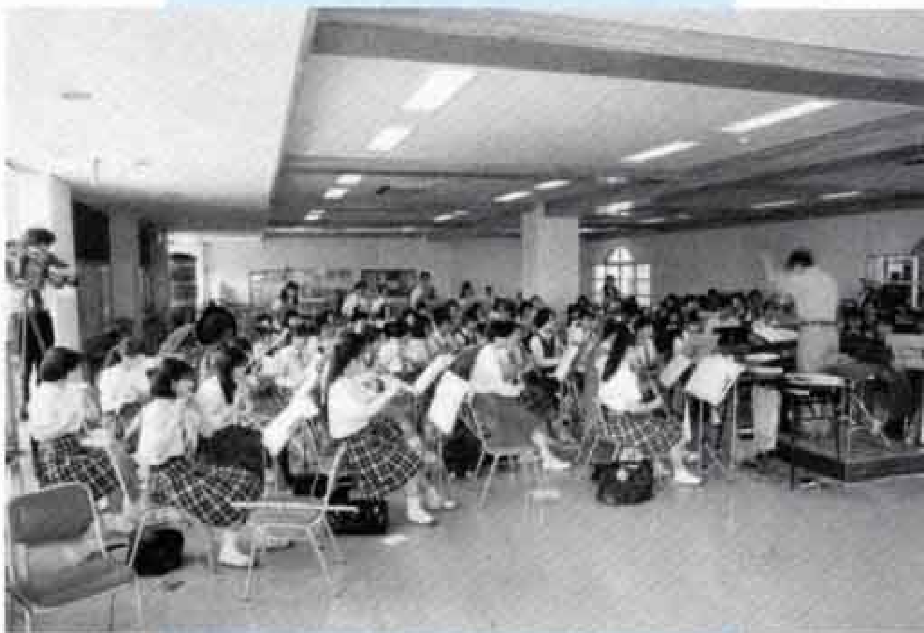
▼練習に励む富士市高校選抜吹奏楽バンド

富士青少年国際音楽祭に出演するのは、アメリカ合衆国、ニュージーランド、シンガポール、チェコ共和国の4ヵ国からの5団体と、富士市高校選抜吹奏楽バンドの皆さんです。出演団体の演奏種目は、オーケストラや民族音楽、合唱など多種多様。音楽へ注ぐ世界の若き情熱が、この音楽祭に集約されています。