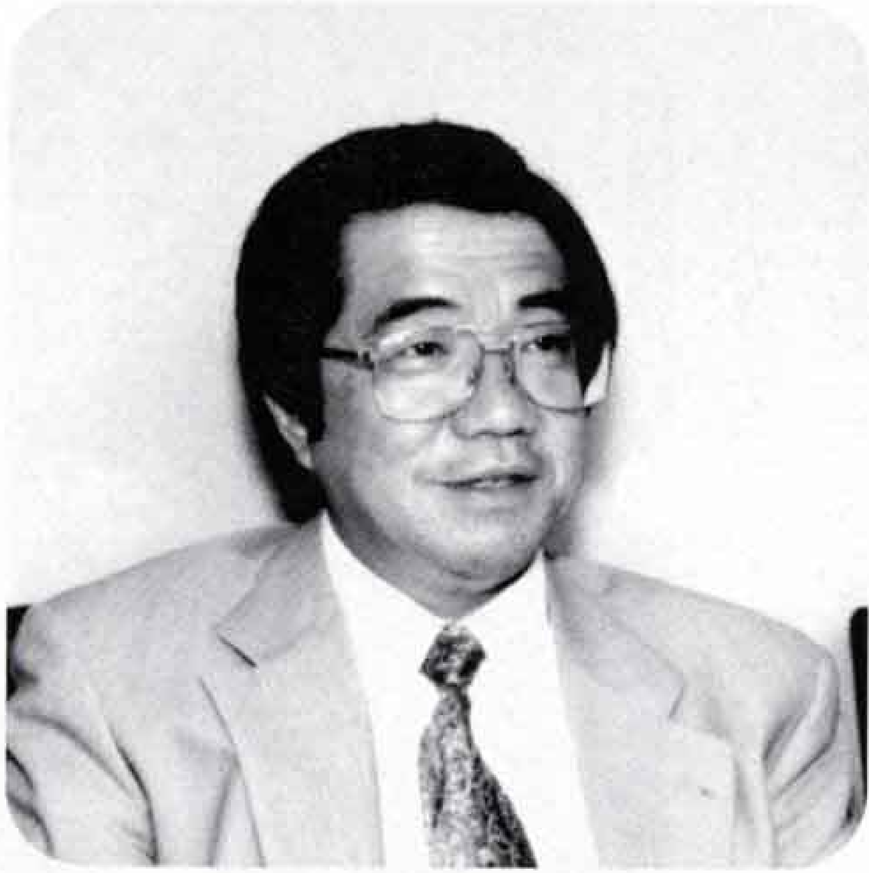
「核兵器廃絶平和富士市民の会」会長