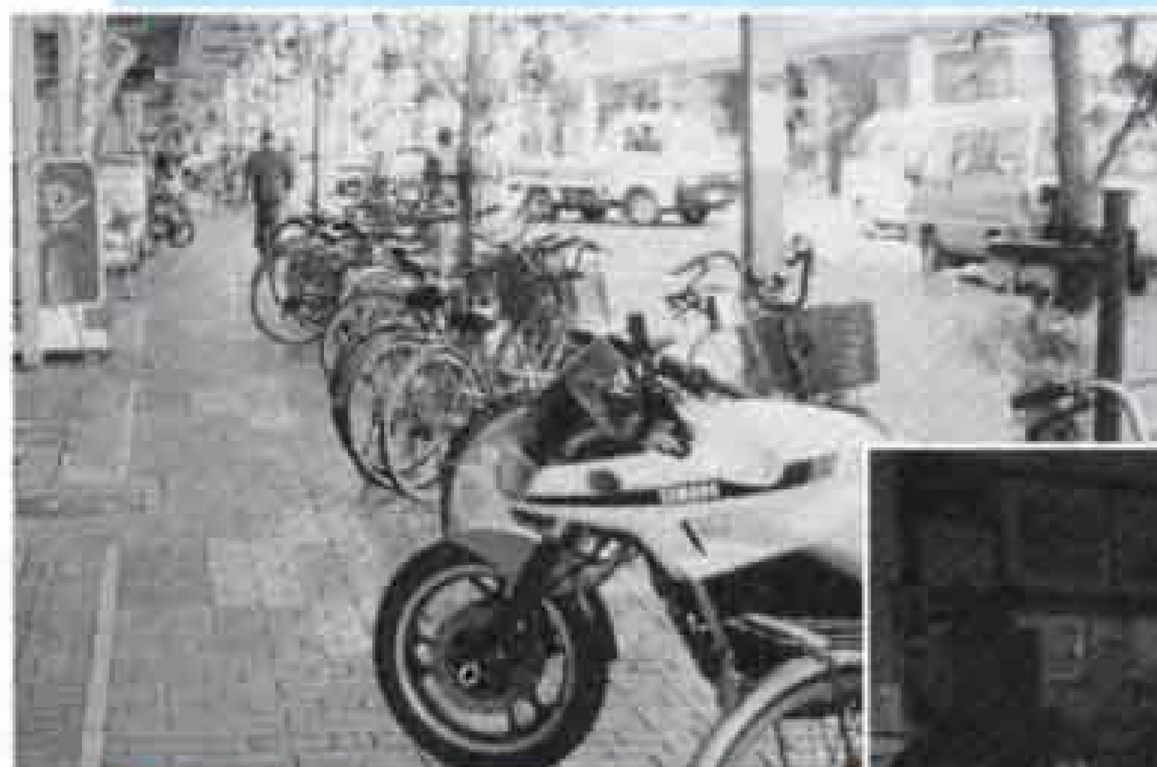
◀一向に減らない違法駐輪 (市内商店街)

施設が使いやすくなっただけでは、「住みよいまち」とは言えません。まちで困っている人に気軽に声をかけたり、自然に援助の手をさしのべたり、ボランティア活動へ進んで参加したりするなどの、思いやりのある温かい心が大切です。