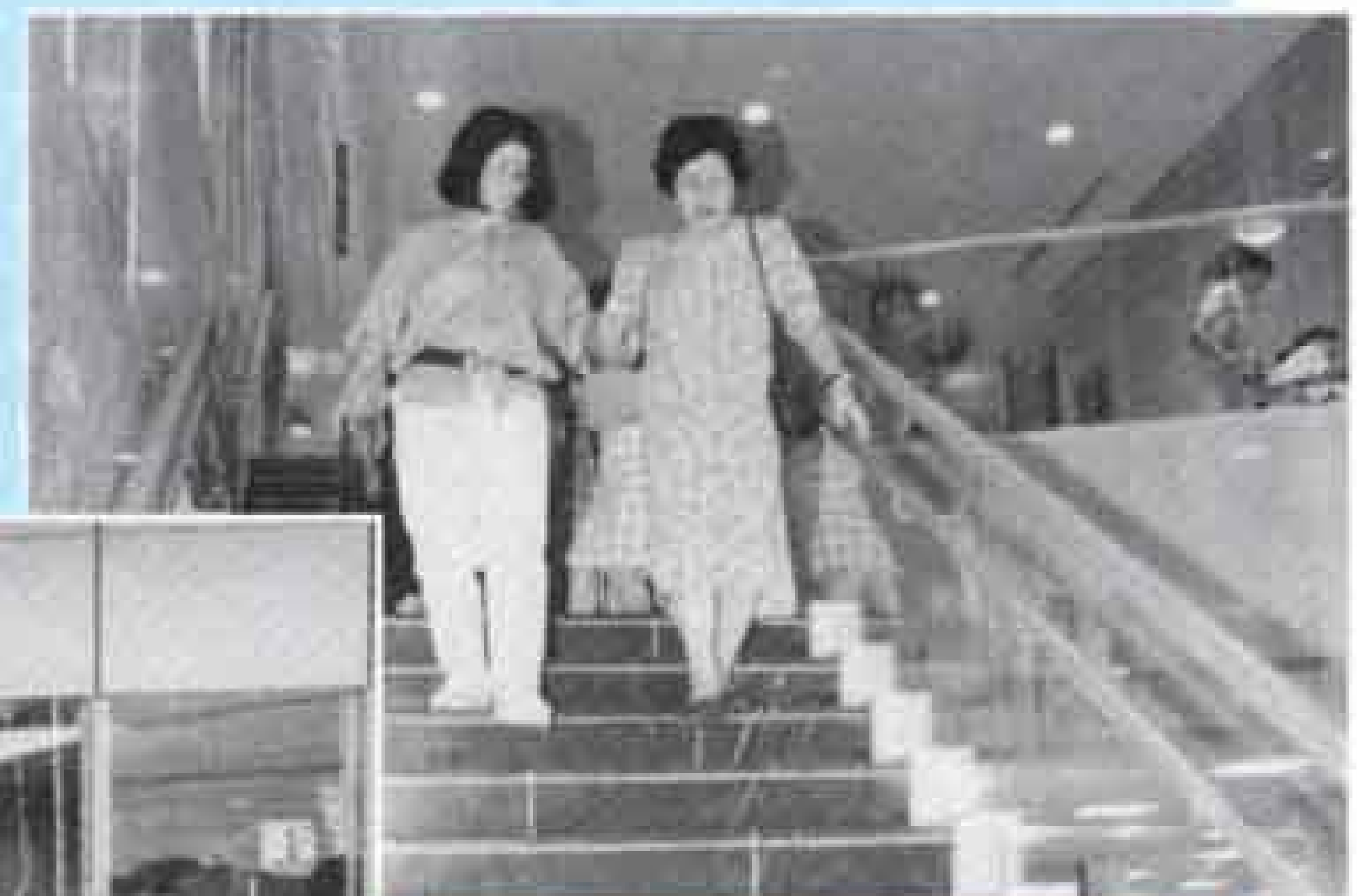
▼▶ 2段になっている階段の手すりと広々とした出入口(市立中央図書館)

ゆったりとした歩道、通りやすい出入口、広々とした障害者用トイレ、安全に使うことができる階段などは、大勢の人が利用する施設には特に必要です。具体的な施設としては、多くの人が利用する図書館や公民館、金融機関などの建物や、道路、公園、駅、バスターミナルなどの施設を、お年寄りや障害を持つ人が、安心して利用しやすい施設となるように整備していくことが必要となります。