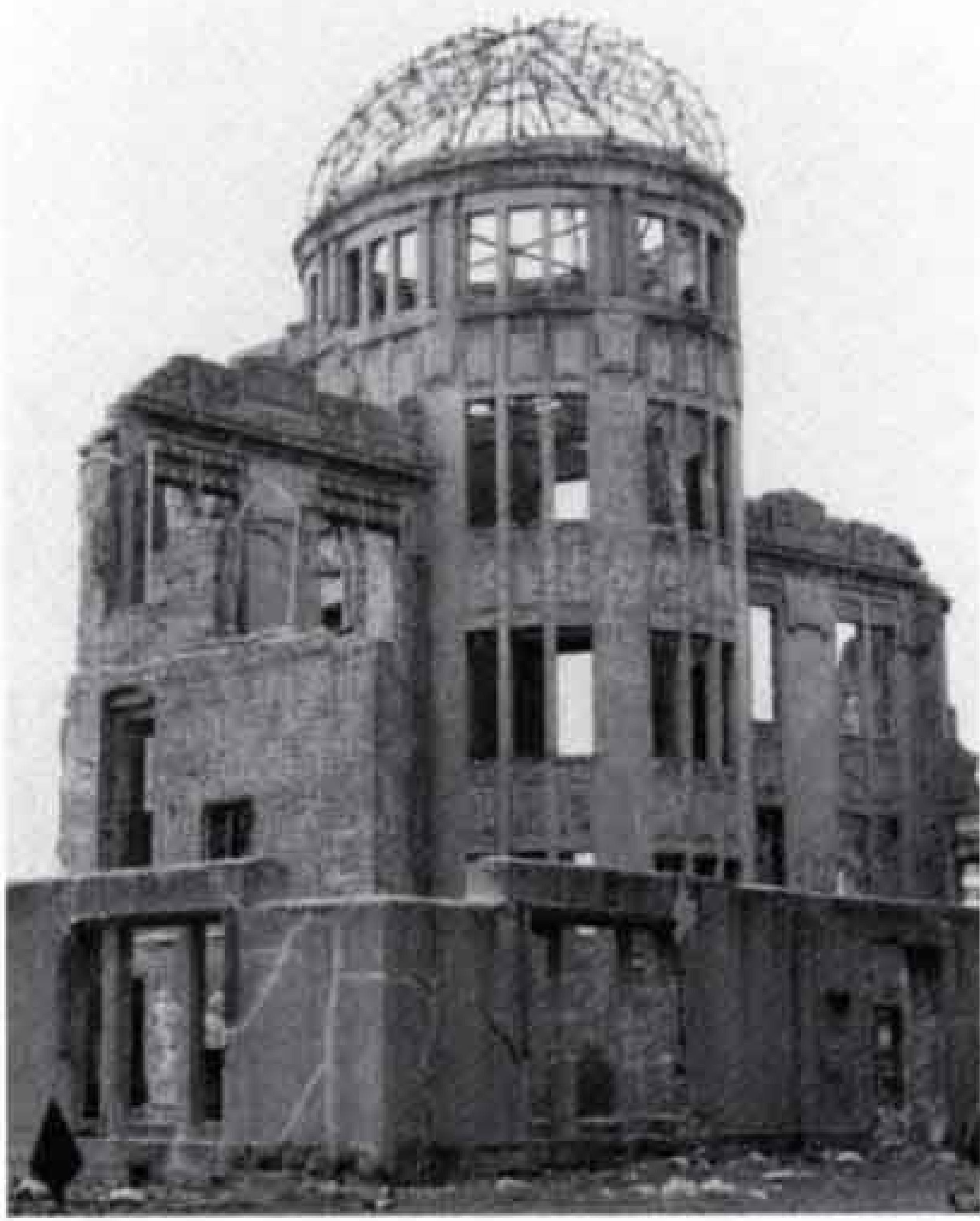
▶▼原爆ドームと昨年の参加者の皆さん