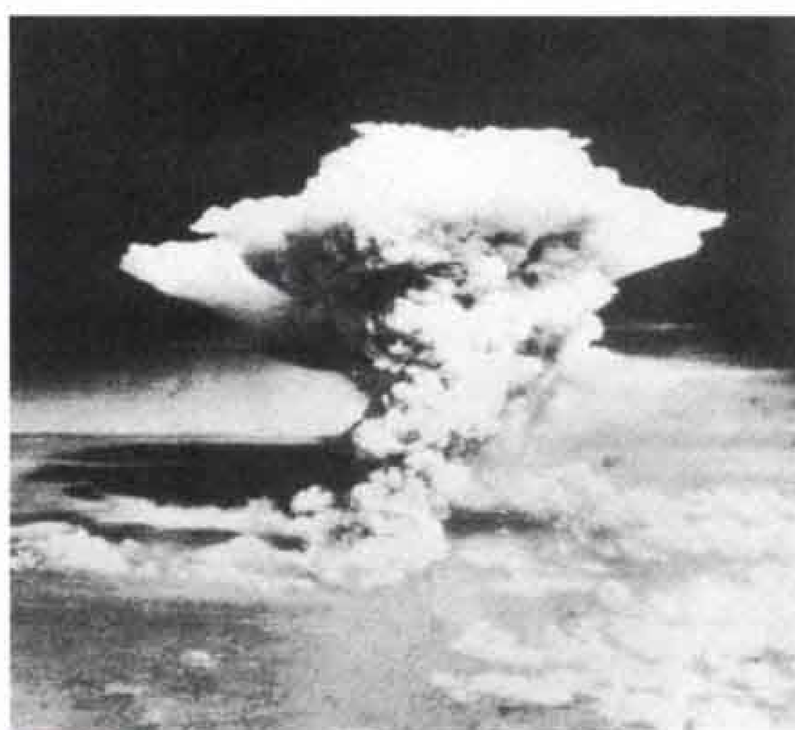
《柳田邦男著「空白の天気図」 (新潮文庫) より抜粋》

昭和二十年八月六日の午前八時十五分、地球上で初めて原爆が投下された瞬間です。その悲劇から五十年以上過ぎた現在、私たち人類は、いまだに核の脅威から解放たれてはいません。核兵器は、多くの人を一瞬にして殺傷するだけでなく、放射能による環境破壊やその後遺症、被爆したといういわれなき偏見・差別までも与え、人々を苦しめ続ける憎むべき兵器です。核兵器はもちろん、核兵器の使用に結びつける戦争や人類の工ゴなどが、地球上からなくなる日は、一体いつなのでしょう。今回の特集は「核兵器廃絶」。私たちは、地球上から核兵器をなくすために何ができるのか、一緒に考えてみませんか。