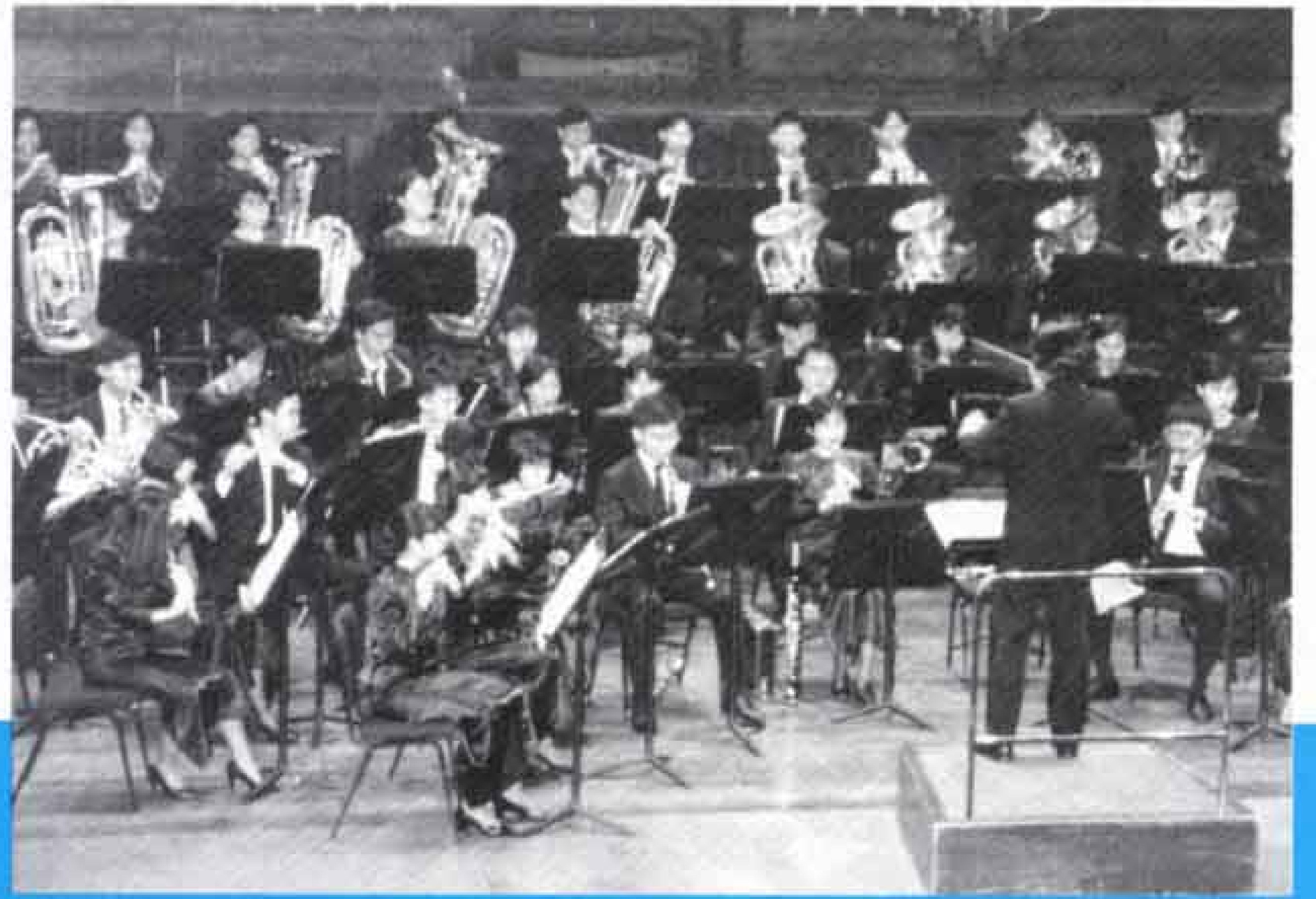
▼シンガポール国立大学シンフォニックバンド