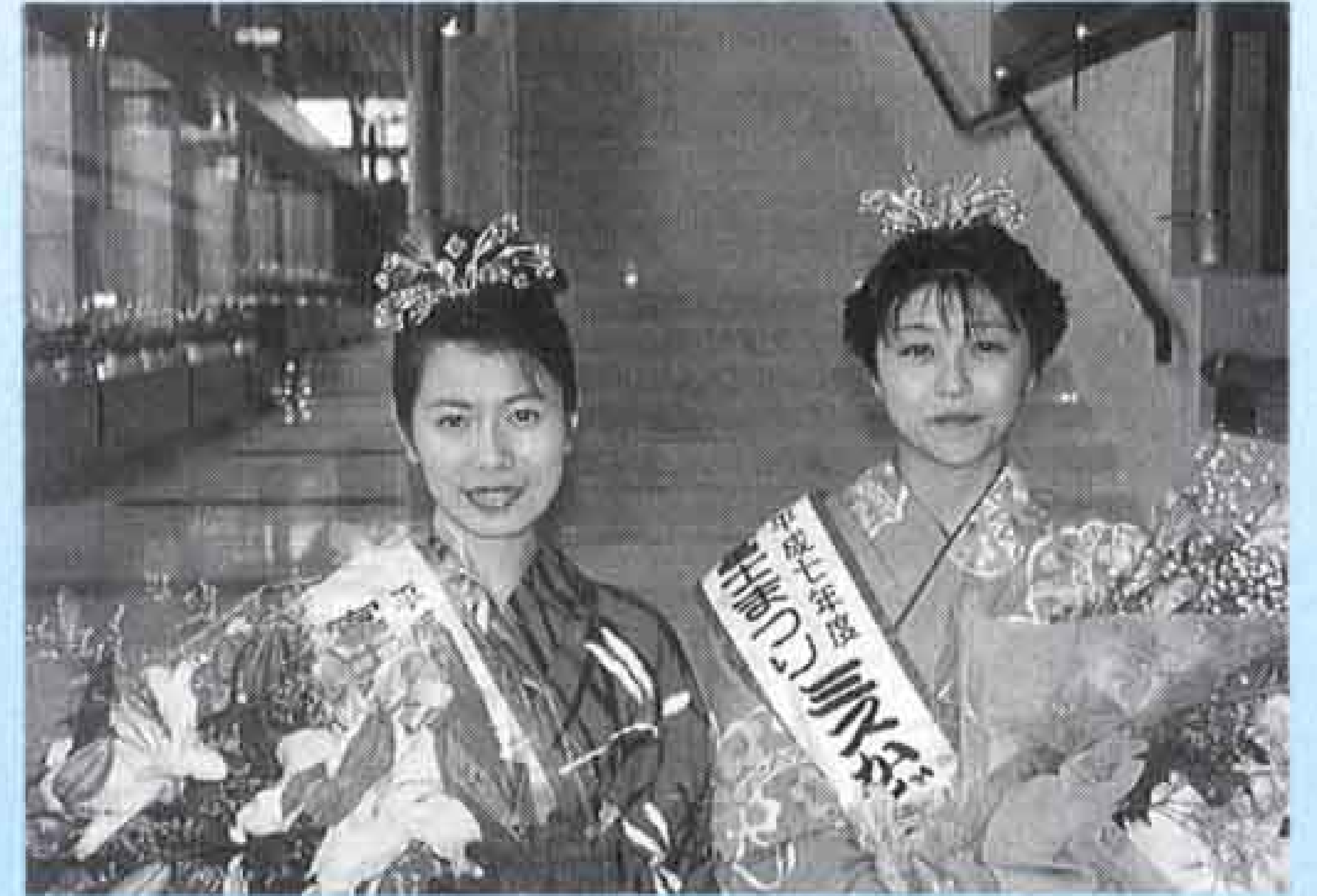
昨年選ばれたかぐや姫2人は、各種イベントや行事などで大活躍中

とき 7月21日(日) ところ ロゼシアター *浴衣審査でミスかぐや姫クイーン1人、ミスかぐや姫1人を選出。選出された人には賞金と賞品を、推薦者には賞金を贈ります