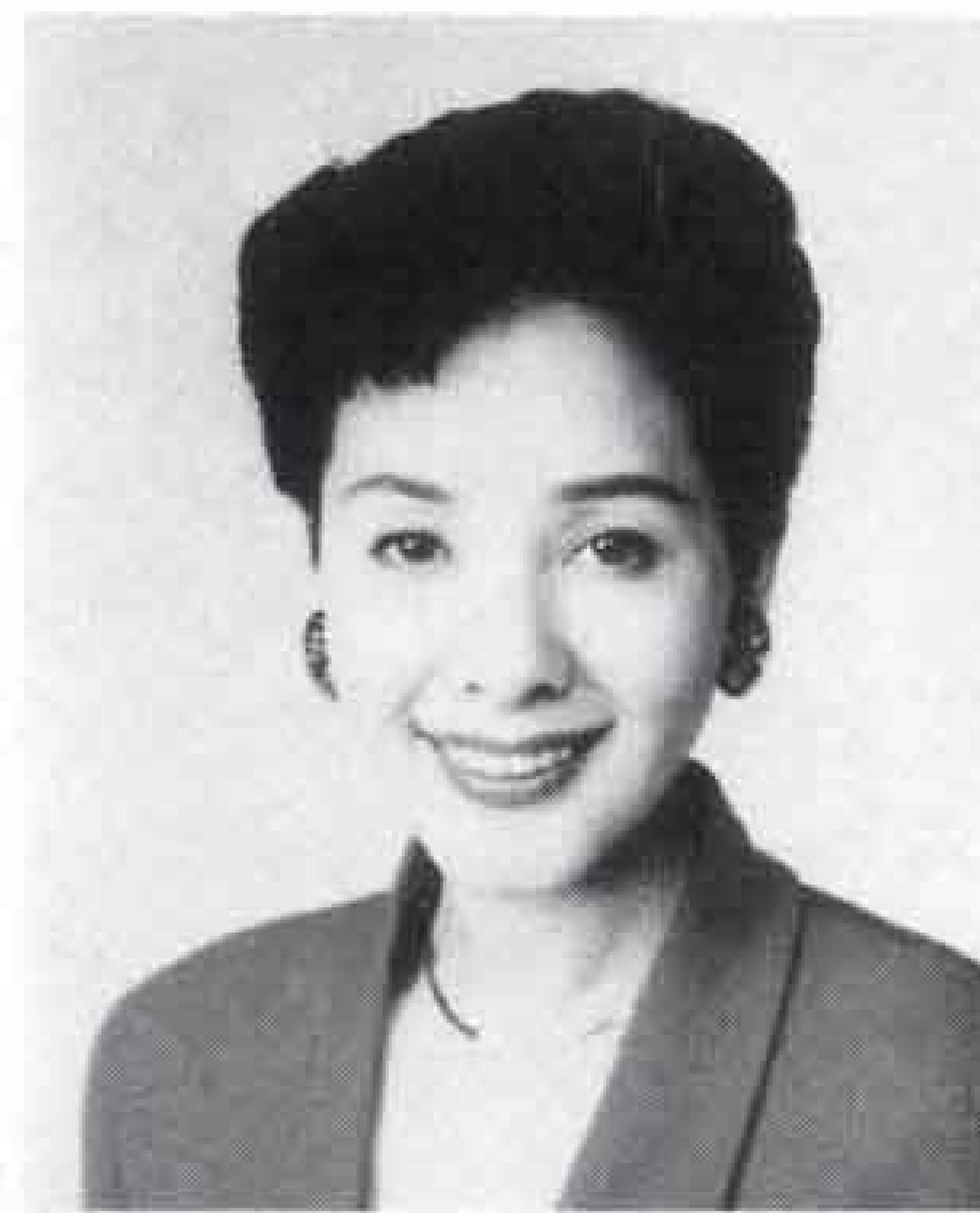
講師 浜 美枝さん