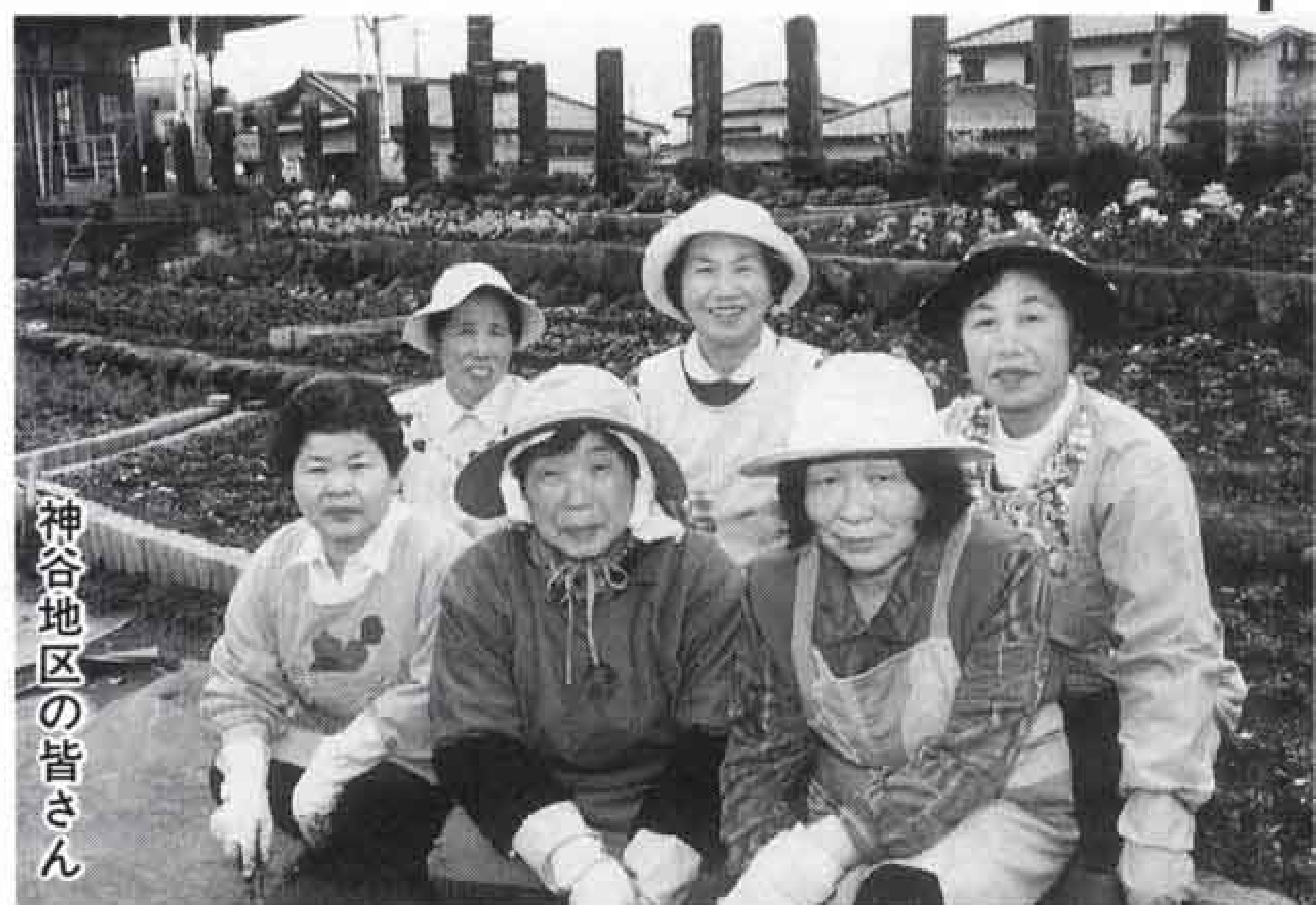
神谷地区の皆さん

花の会の皆さんが管理している花壇は、市内に百七十六カ所あり、各地区ごとで活動しています。会の設立は、昭和四十二年八月。当時の会員は七百六十四人でしたが、今では、約四千五百人の花を愛する仲間が力を合わせ、丹精込めて花を育てています。