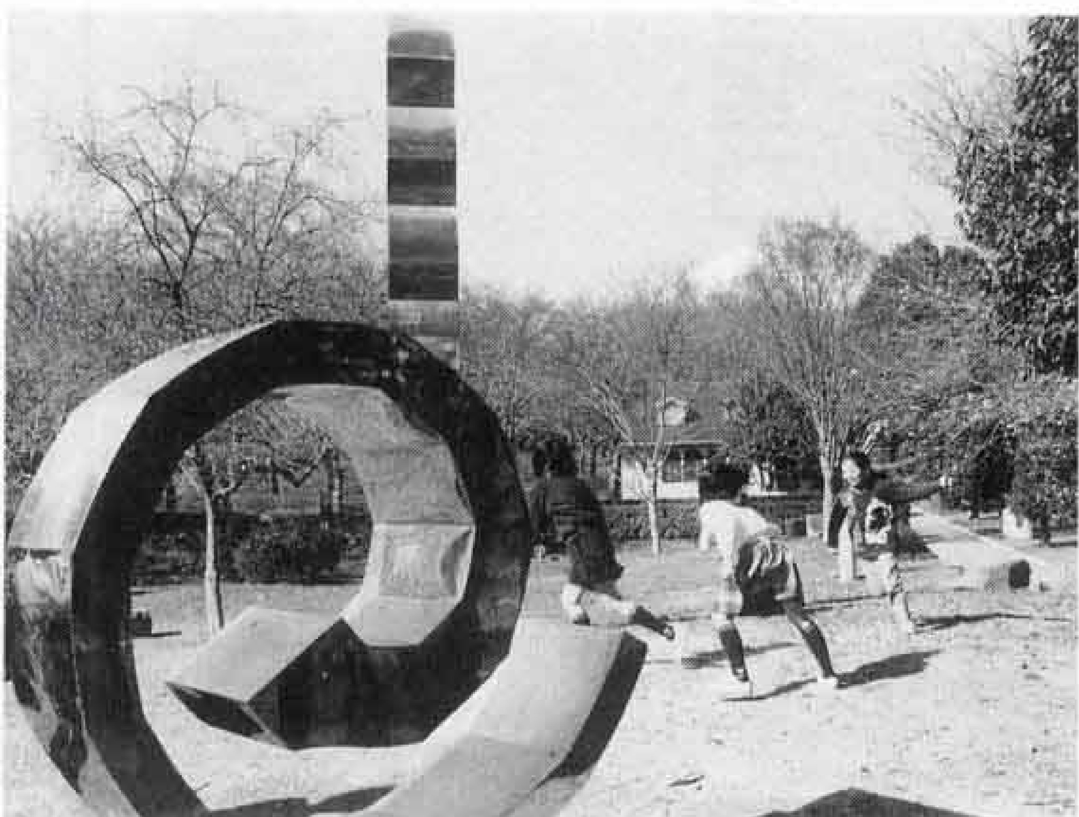
△ 2市1町の合併記念公園となる広見公園