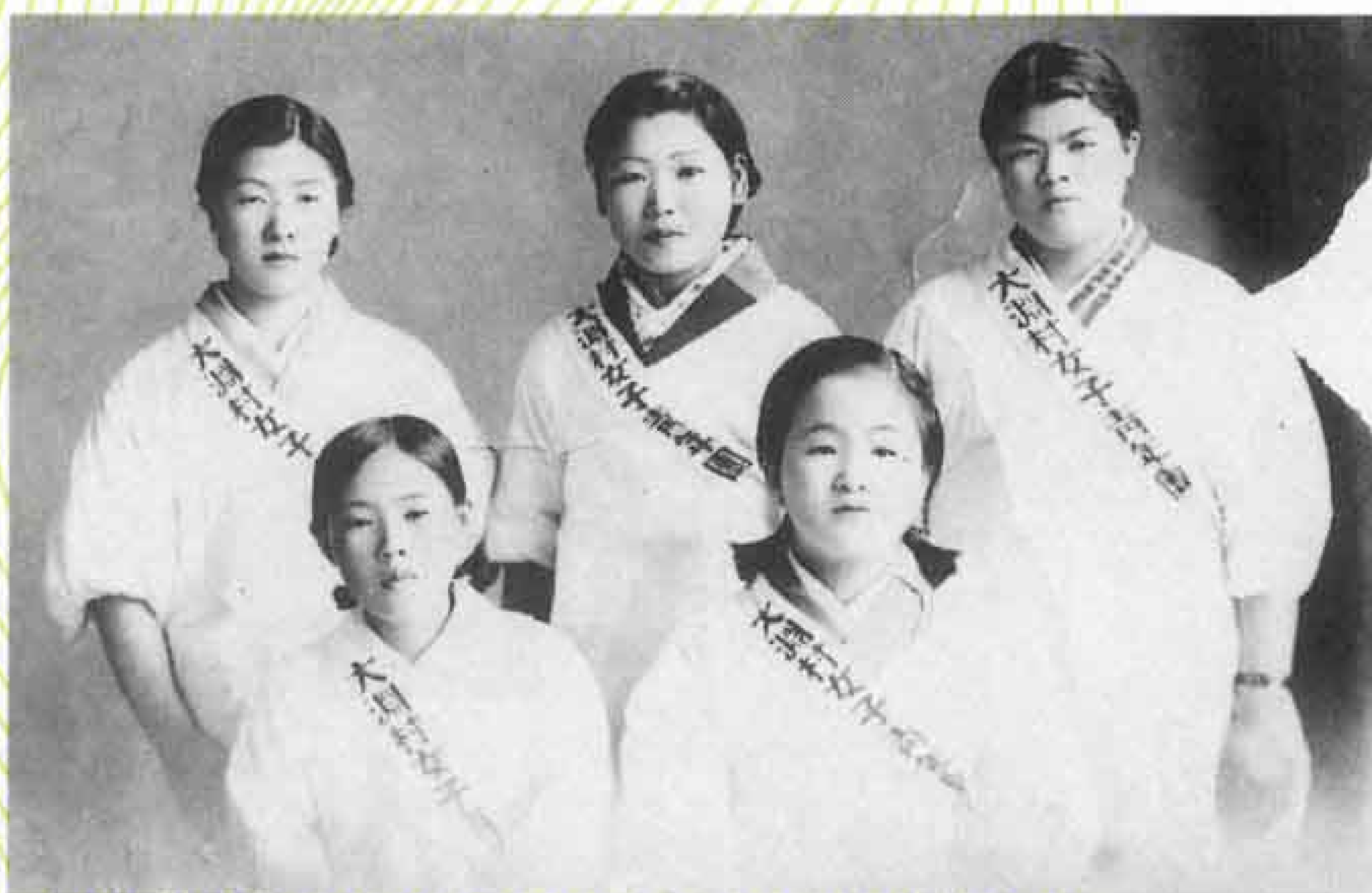
大洲村女子青年団 戦時中、食糧生産を支えていたのは、主に女性や 老人、子供たちであった。