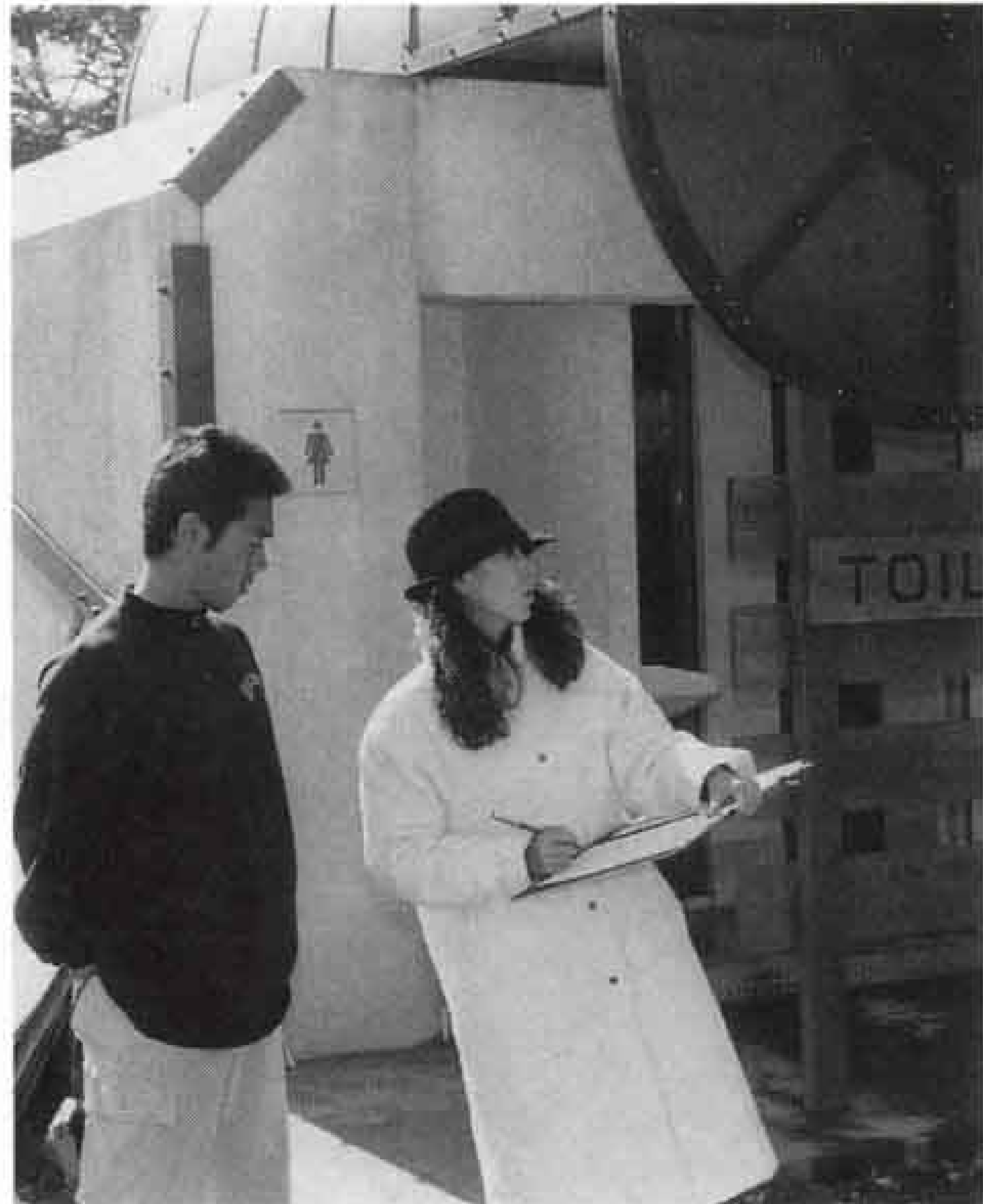
公園のトイレを点検し、気づいた点をチェック