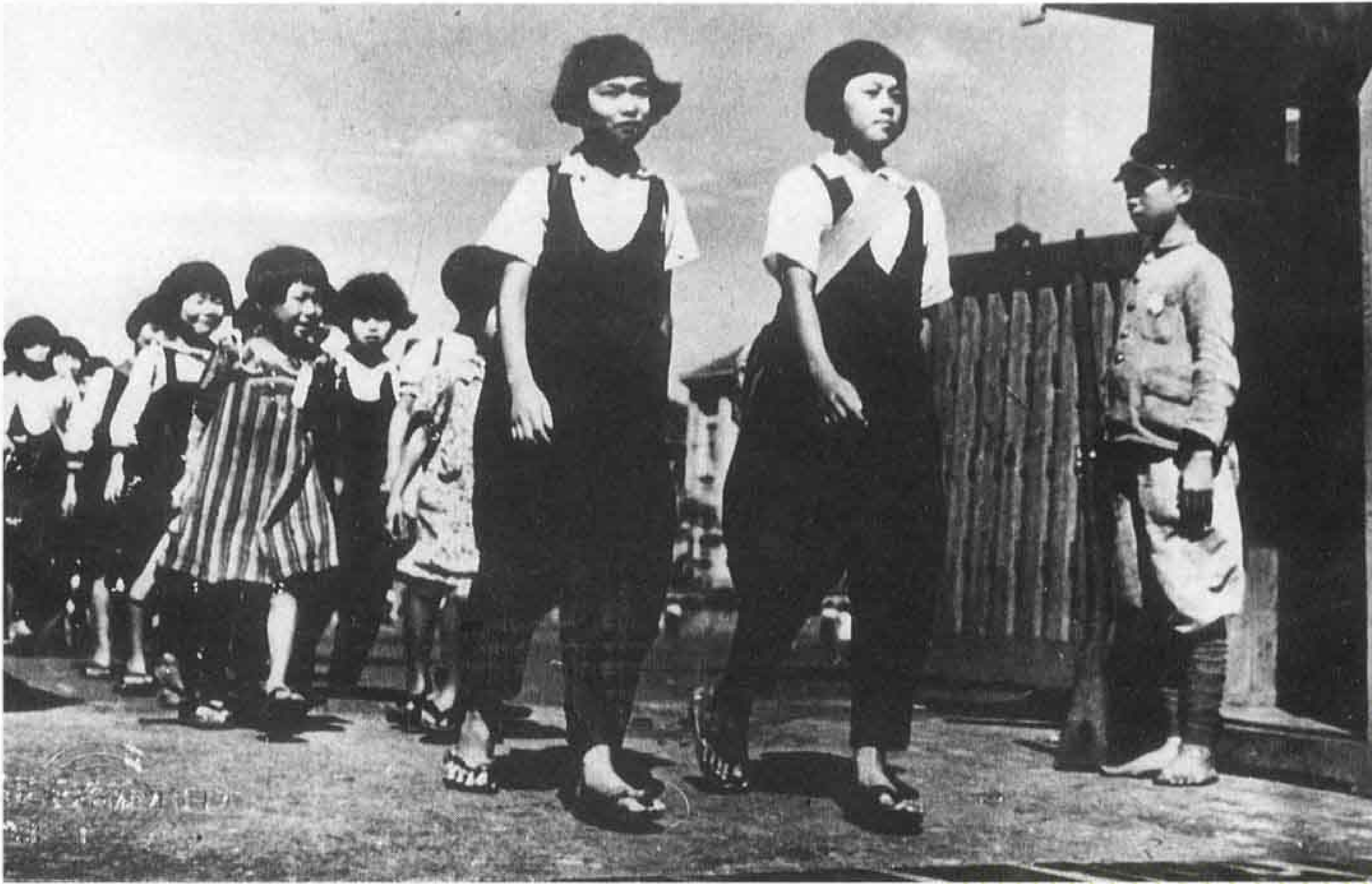
モンペをはいて登校する子供たち げた履きの子供が目立つ。