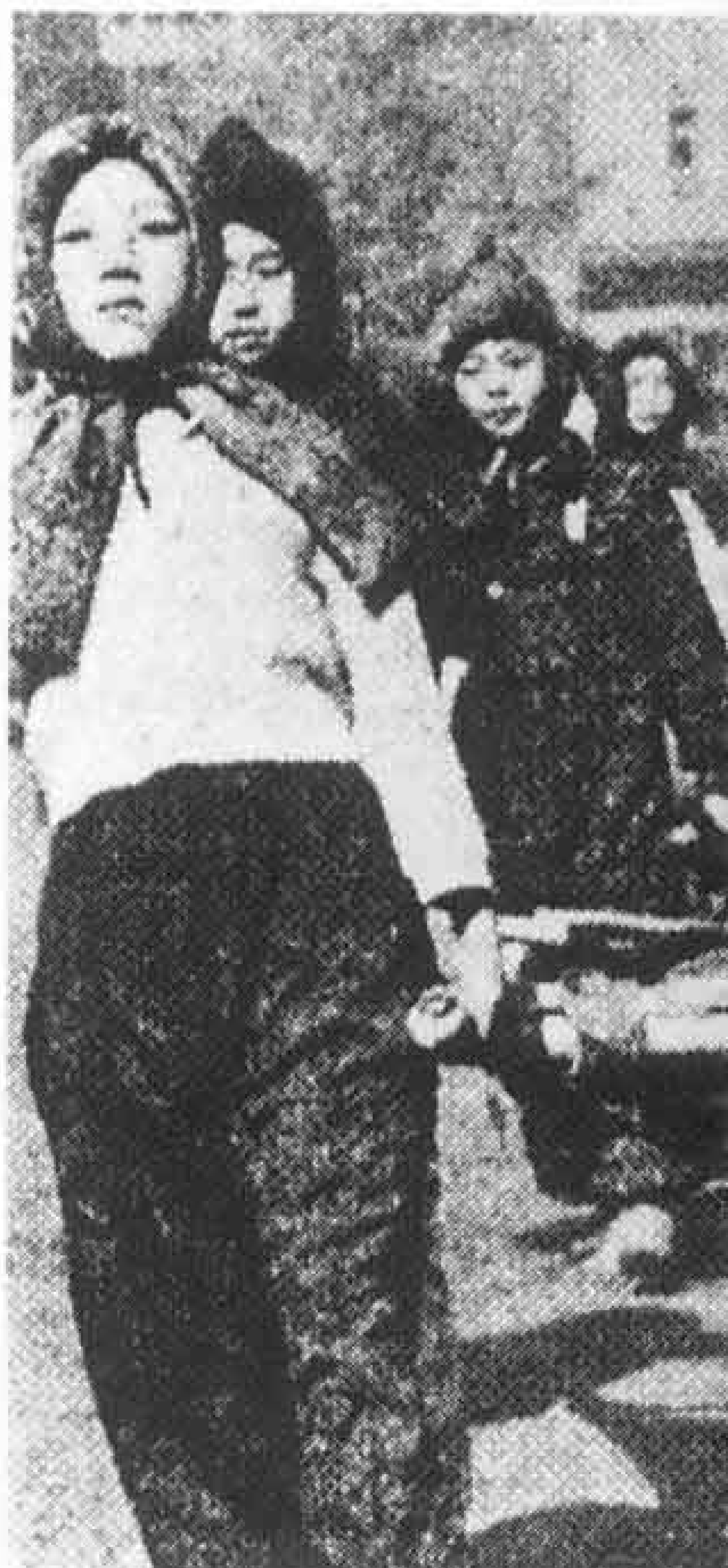
モンペ姿に防空ずきん 「元吉原小学校 開校百年記念誌 松籟」より

供あてに手紙を送ってくれました。私には、家族のことなどを頼むという内容で、子供たちには「こちらはとても暑いです。日本の冷たい水を飲みたいです。あまり氷やアイスキャンデーを食べて、ポンポを悪くしないでくださいね。お父ちゃんが帰るときは、お土産を買っていきます。おとなしく待っていてください」といった手紙が送られてきました。