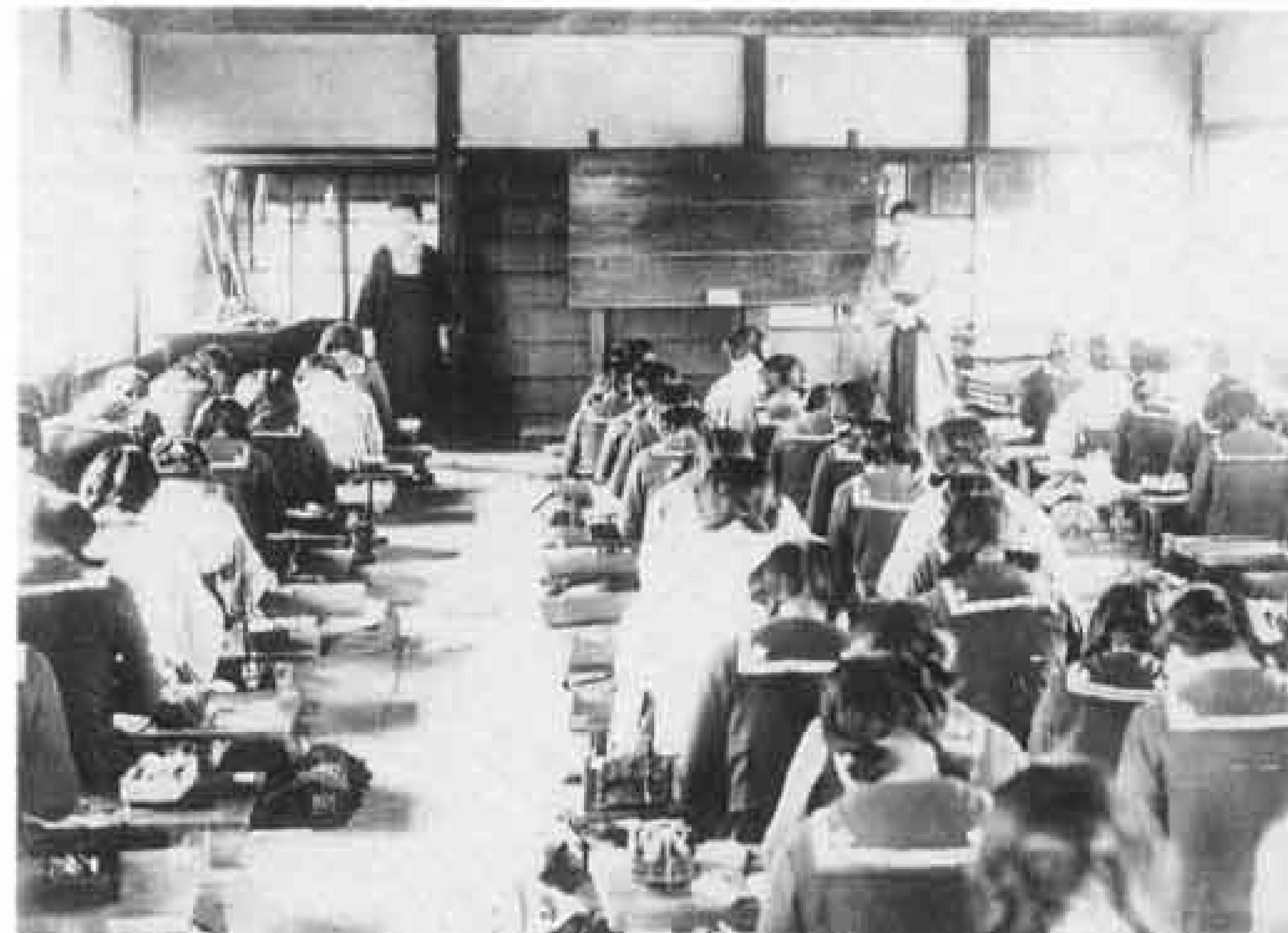
大芝裁縫女学校の授業風景

大正6年、水戸島に設立された大芝裁縫女学校は、小学校を卒業した女子のため、実際生活に必要な女性としての心得を養成することを目的としていたが、昭和19年に廃校となった。