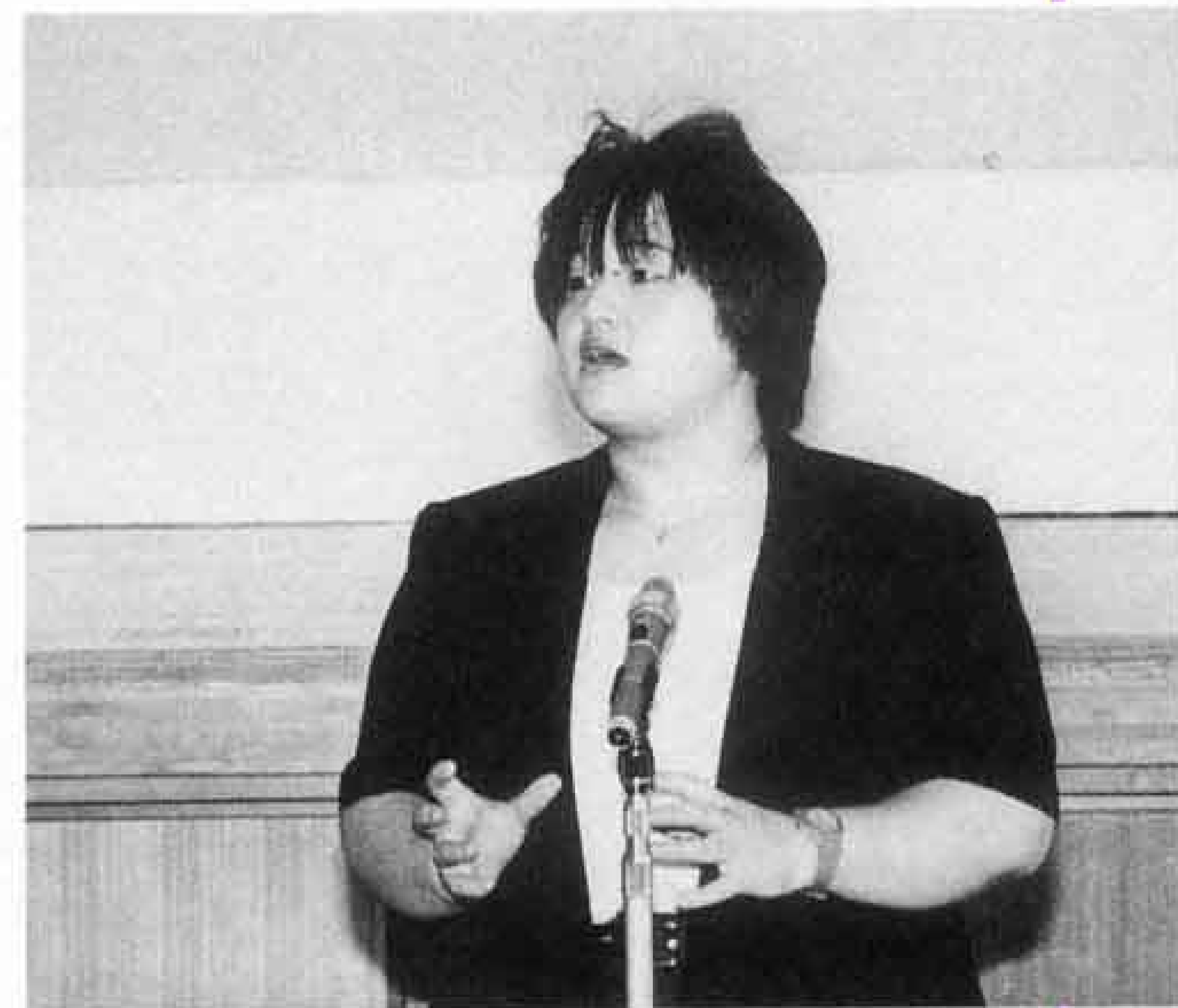
(社)富士市シルバー人材センター