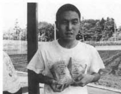
EMボカシに関する問い合わせは 環境衛生課 内線2050

の通所生が協力しあってEMボカシを つくっています。まず、もみ殻などに EMをよく混ぜ合わせ、約一週間寝か せます。それを二、三日乾燥させ、袋詰 めすればでき上がり。市内で「販売用」 EMボカシをつくっているのは、小規 模授産所ふじひろみだけです。各地 区の婦人会や花の会など、自主的につ くっているグループもふえています。 さて、EMボカシを使って生ごみか ら有機肥料をつくる方法はどうかと、 これが実に簡単。しっかりと水切りした 生ごみを密閉容器に入れ、EMボカシ をまんべんなく振りかけます。あとは 容器がいつぱいになるまで繰り返し、 いつぱいになったら密閉して直射日光 の当たらない場所で発酵させるだけ。 生ゴミを発酵させてつくった有機肥 料を使うと、キュウリは数多く、トマ トは甘く、バラは花の色が濃くなるそ うです。また、容器の底にたまった液 は薄めて、水洗トイレや下水に流すと ぬめりや悪臭がなくなります。 EMボカシは生ごみの減量化だけで なく、生活を豊かにし、環境浄化に役 立っています。