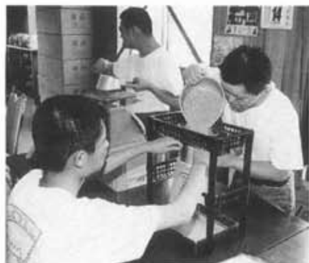
△EMボカシづくりに励む 小規模授産所ふじひろみの皆さん

これから出会う友達、恋人、そして これからこの世に生を受ける愛の結晶。 私たちは、今ある富士市の自然や文化 をもっと豊かなものにして、まだ見ぬ 君へ贈りたい。 そんな思いがこの「かけ橋」という 言葉に込められています。このコーナ ーでは環境、文化、福祉などをテーマ に市民の皆さんの「熱い思い」をお届 けします。