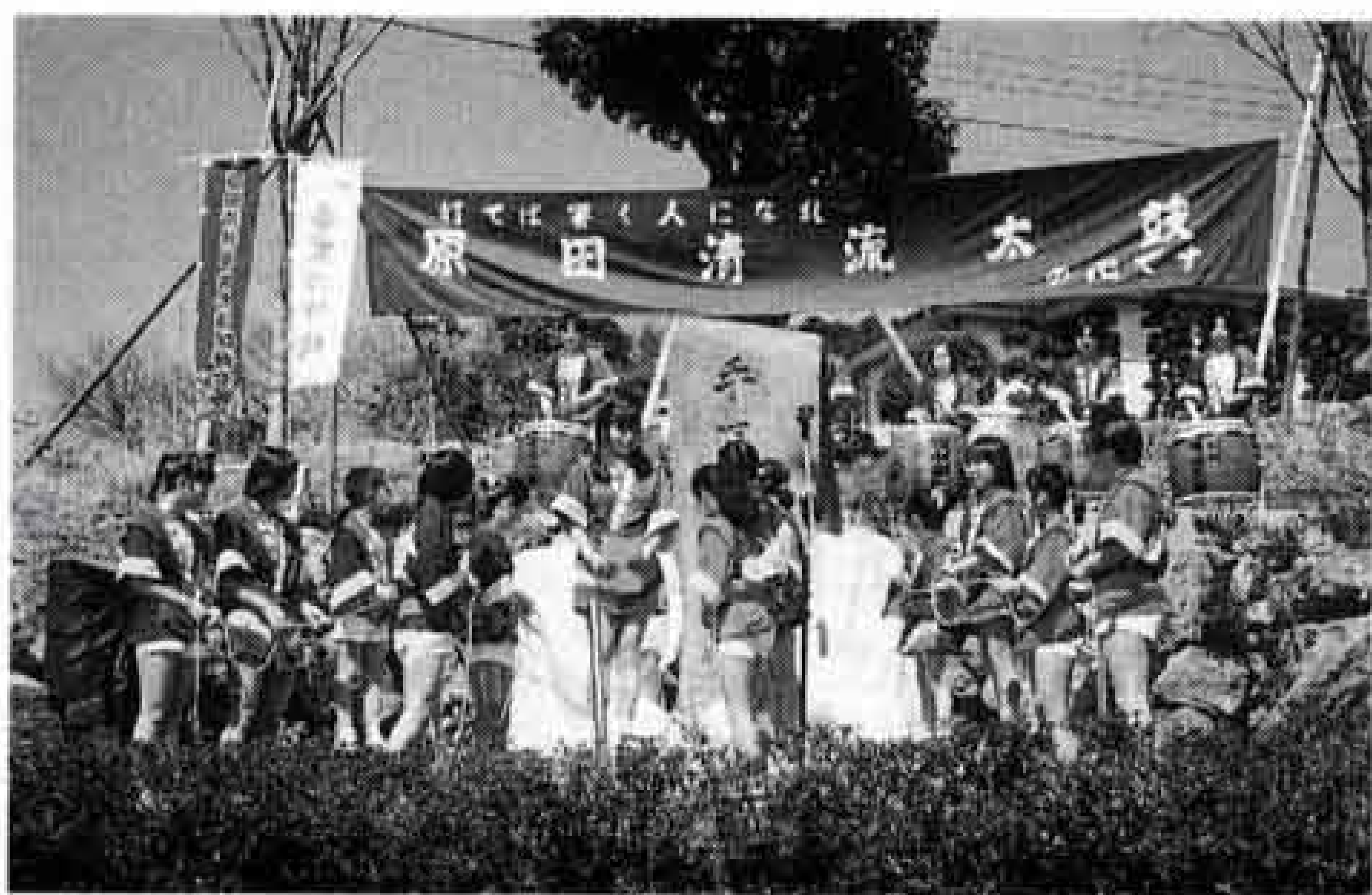
△ことしの3月に行われた「手児の呼坂」記念碑の除幕式