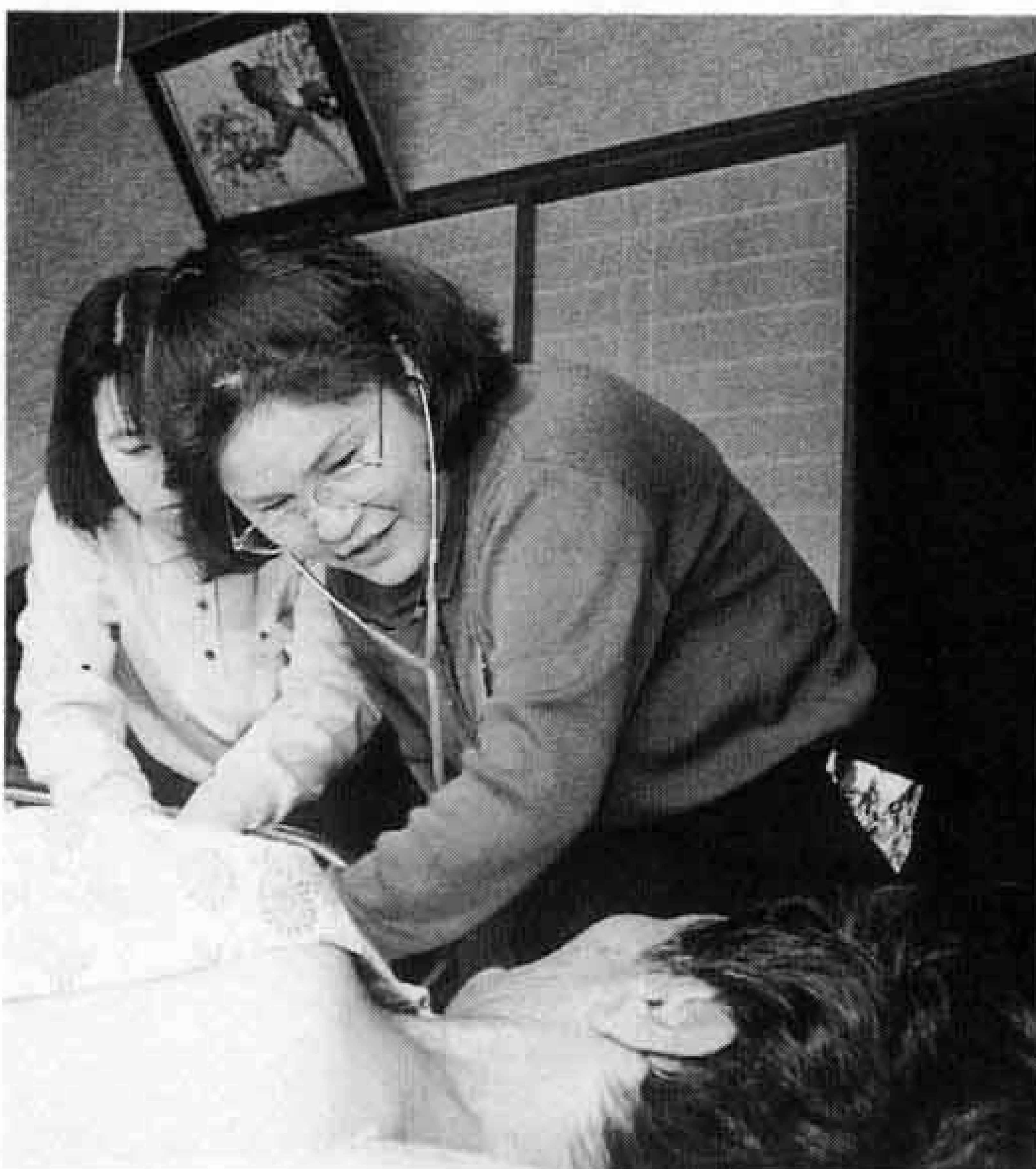
▽まずは、血圧をはかりましょう

市立中央病院には、現在610床のベッドがありますが、いつも混んでいる状態です。けがや病気で入院した患者は、全快して退院する人ばかりではなく、家庭へ帰ってからも治療や回復訓練などに専念する人も少なくありません。