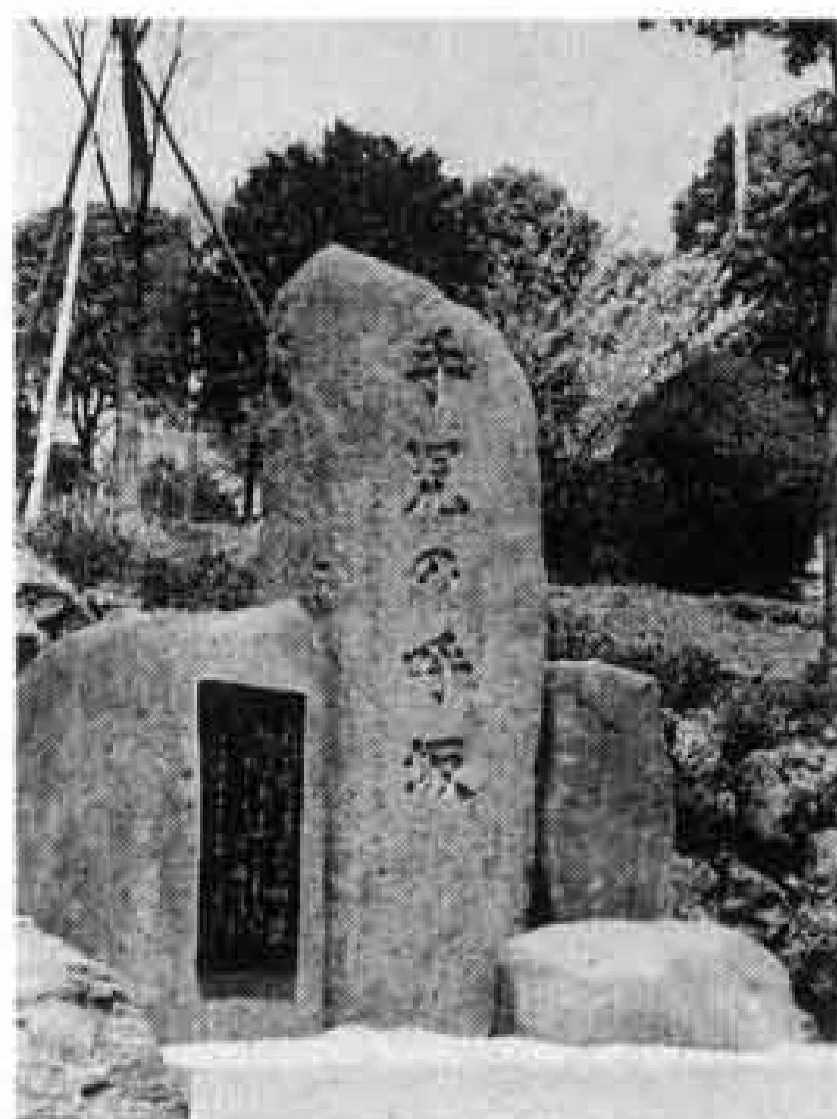
原田公園の記念碑

した。この世のものとも思われないう美しさに、娘は我を忘れて見入っていたのですが、ふと気づくと、笛の音が聞こえてきました。笛の主は、里では見かけない若者です。その若者は、愛鷹山の向こうから来たアイヌの若者でした。若者は「蛍の光に照らし出されたあなたは、とてもきれいでした。私の思いがあなたに届くようにと笛を吹きました」と打ち明けました。娘の顔は真っ赤になりました。 それから毎日、若者は長く険しい道を通い続け、娘に会いに来ました。会いたい気持ちは娘も同じ。娘は、小高い坂の上で若者を待ち、毎日が夢のように、楽しく過ぎていきました。 しかし、それもそう長くは続きませんでした。ひそかに娘を思ってきた若者たちが、二人を妨害してきたのです。それでもアイヌの若者はあきらめず、長く険しい道を