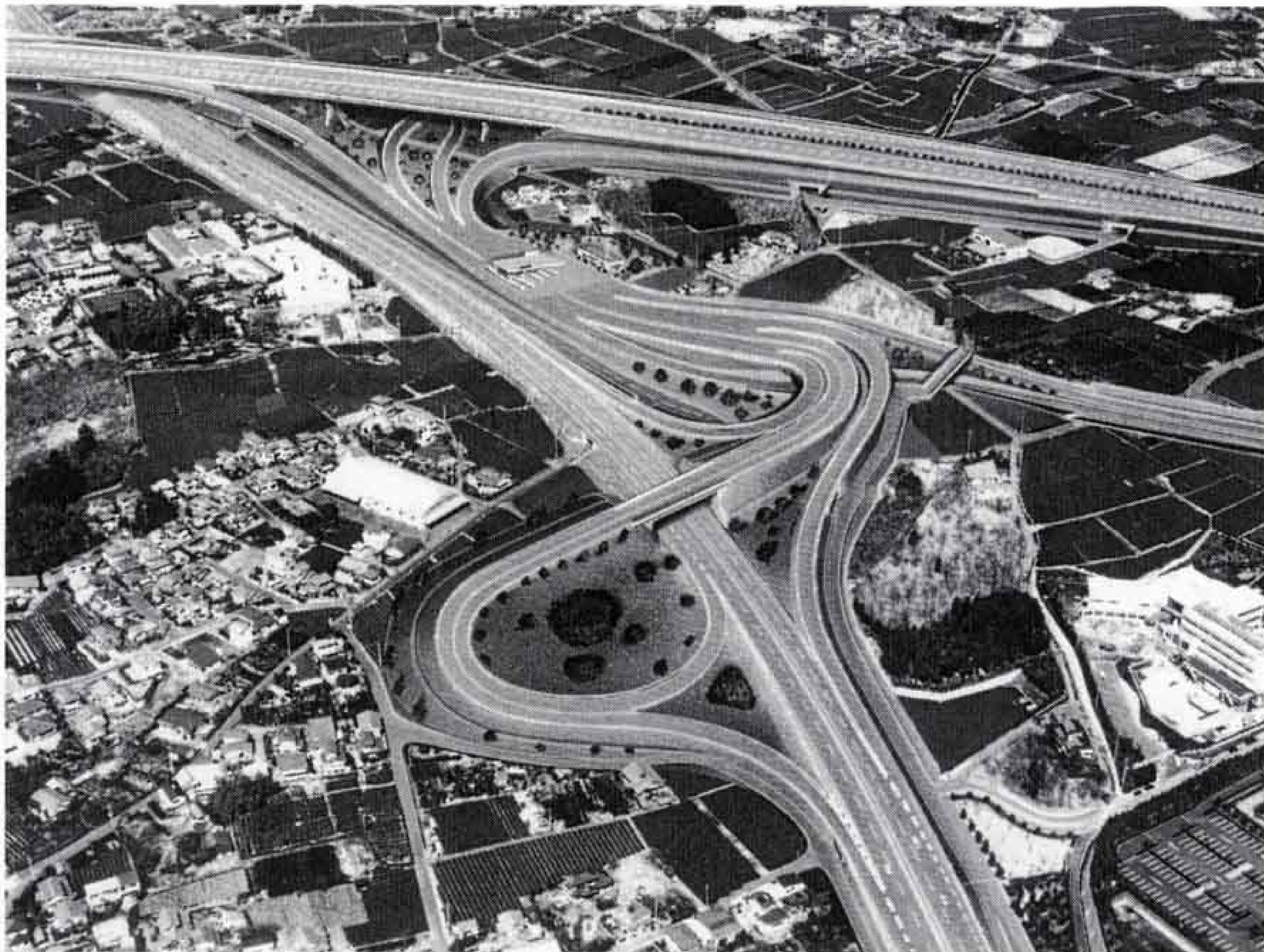
第二東名(仮称)富士インターチェンジ周辺の完成予想図