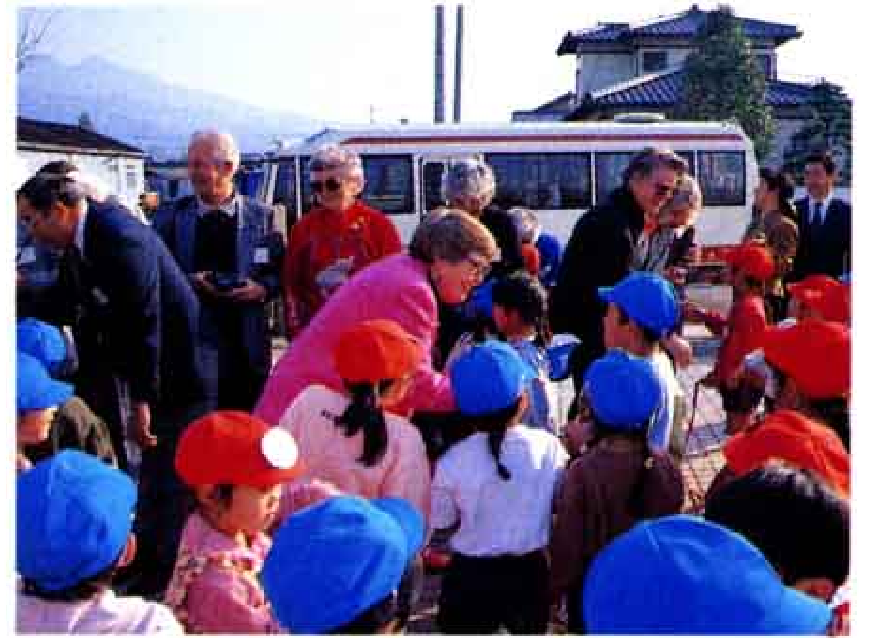
△周りを取り巻いた園児たちと握手・握手・握手