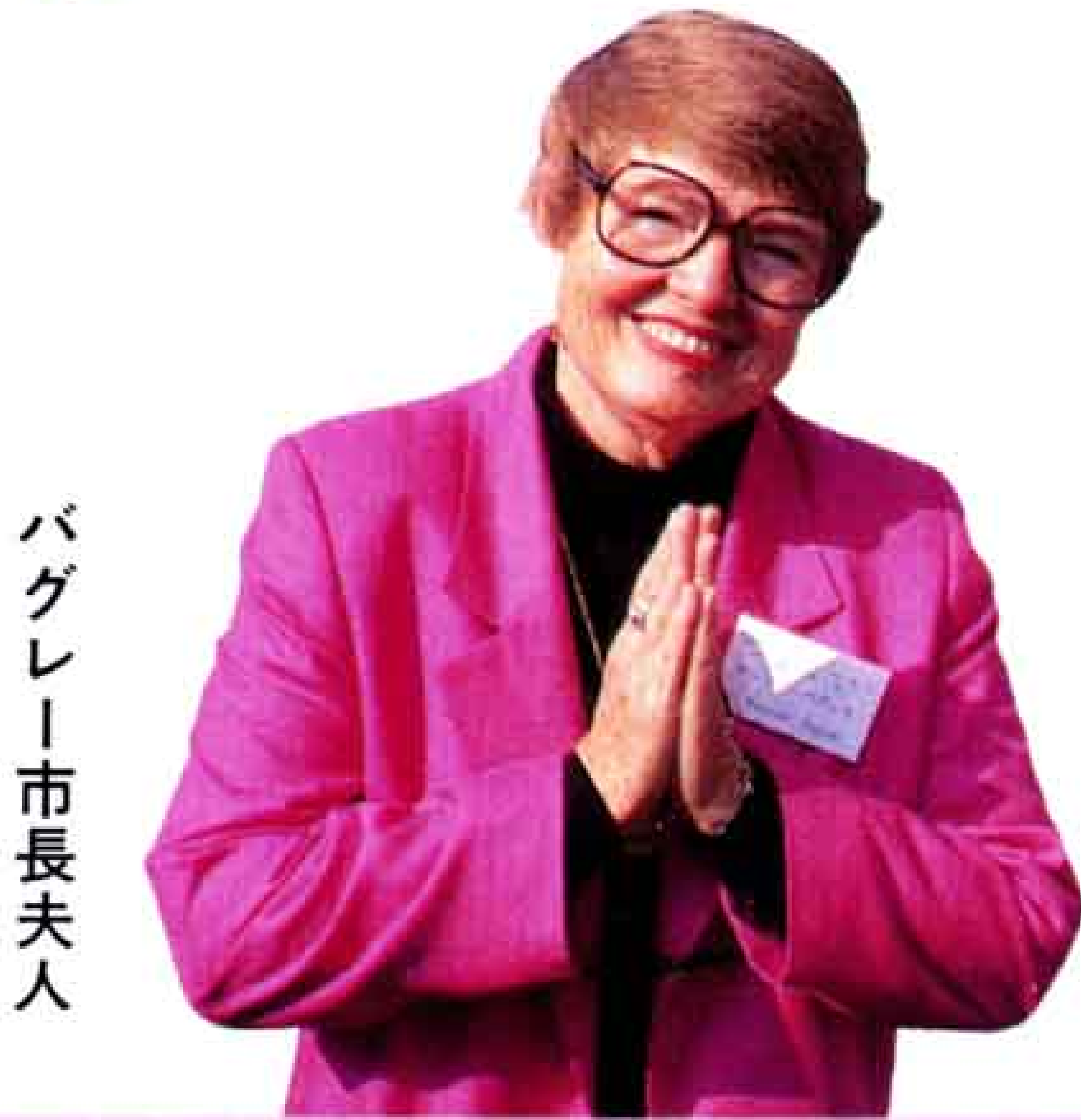
バグレイ市長夫人