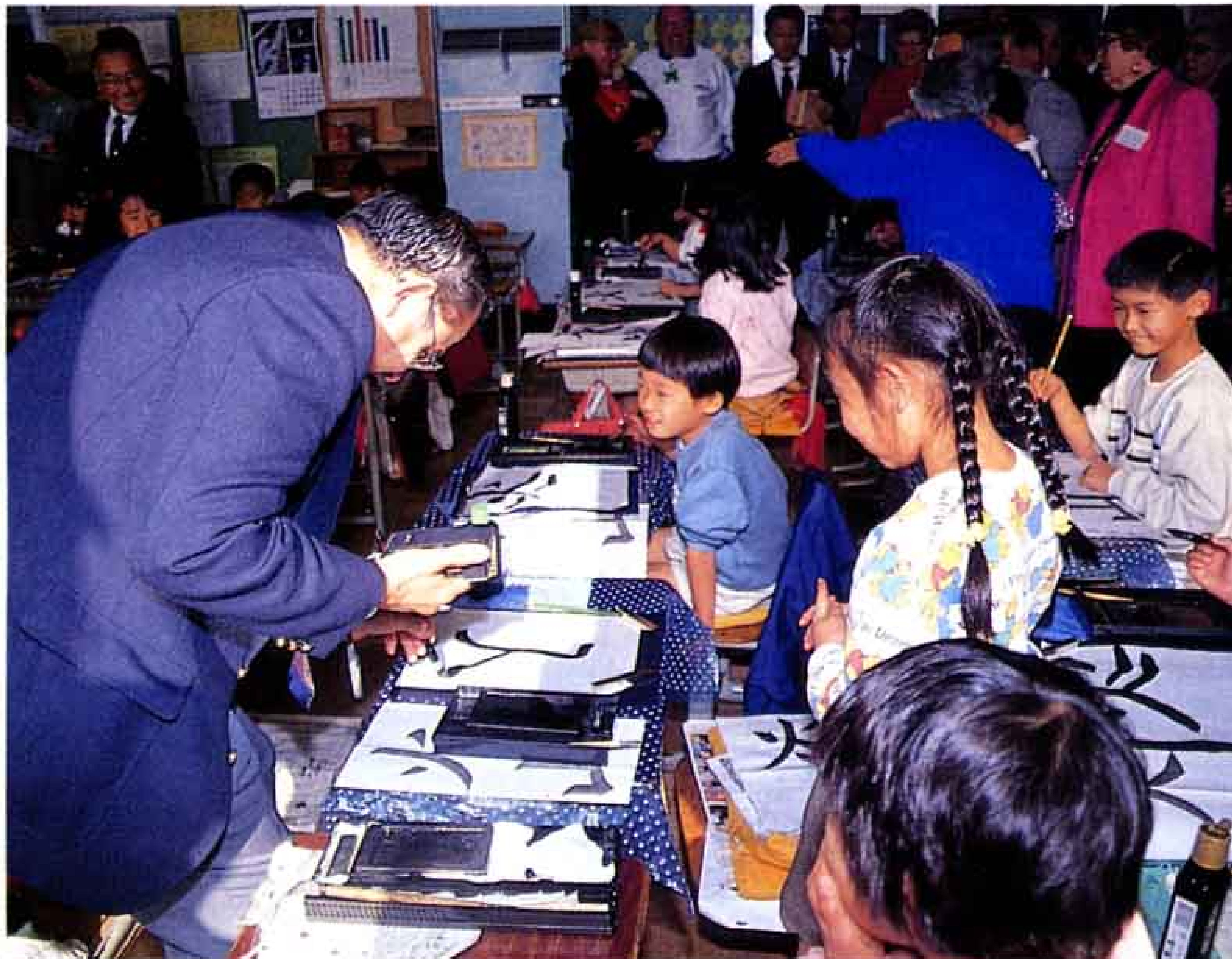
△習字の授業に飛び入りで参加