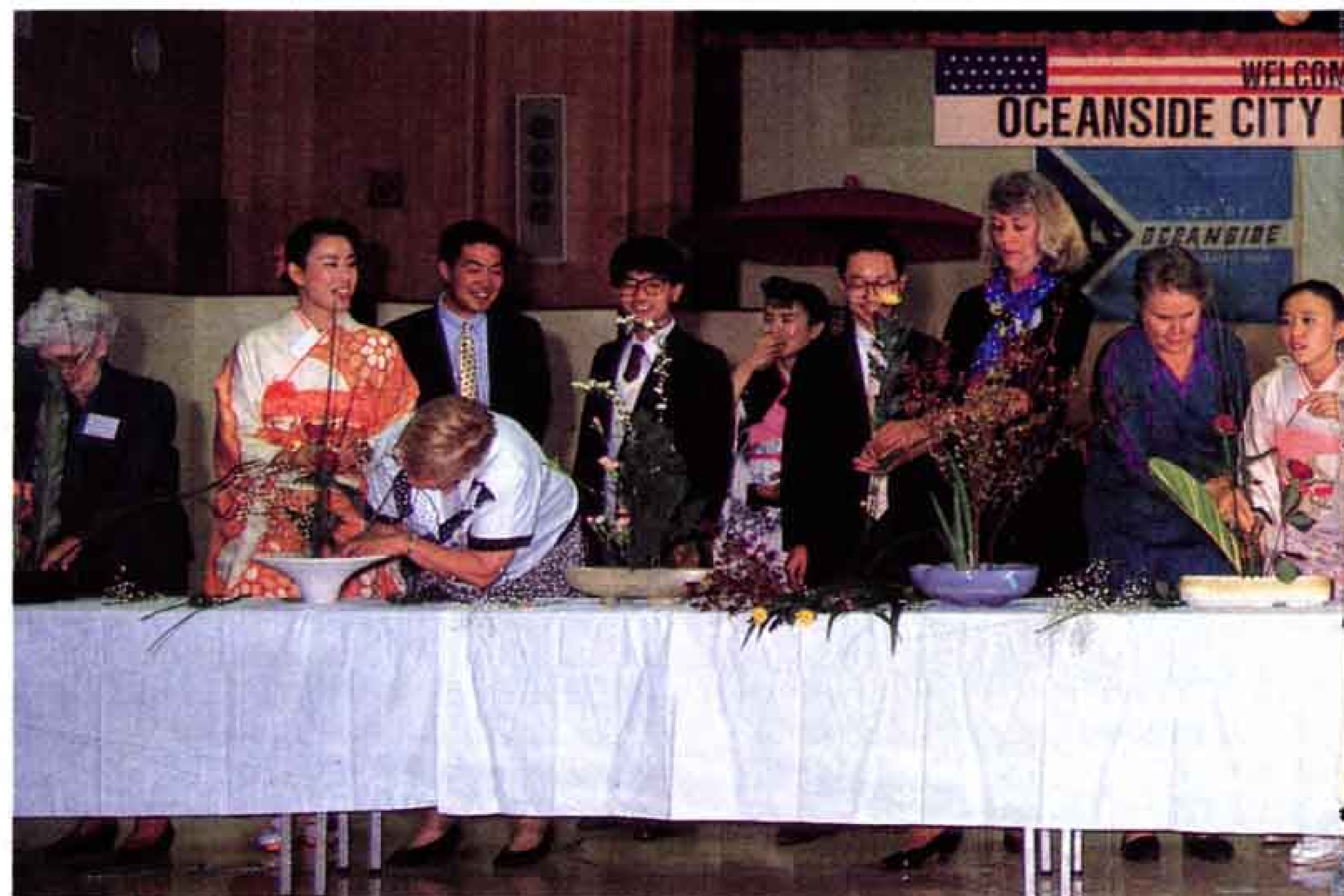
△保健婦人センターで生け花を体験