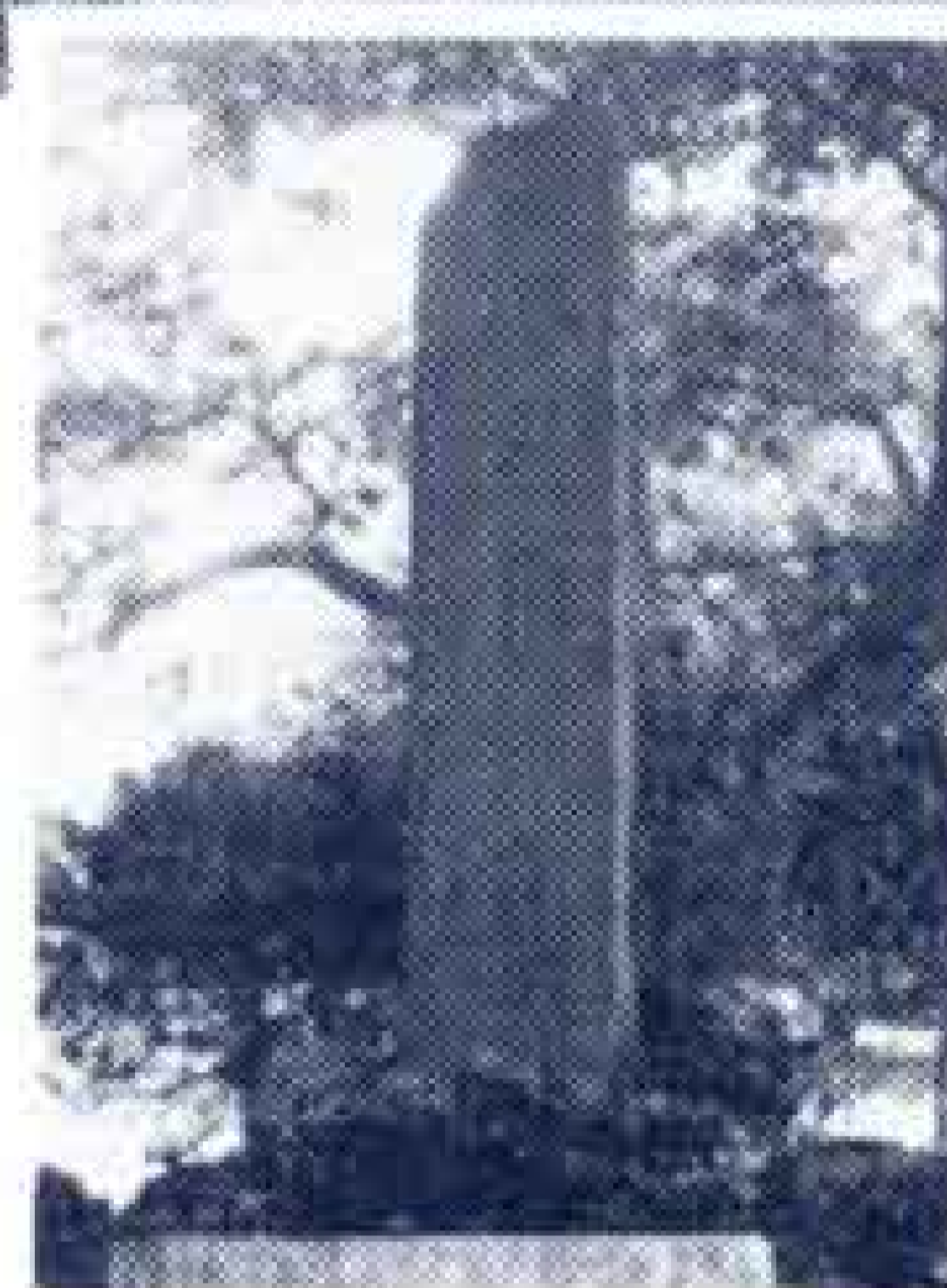
ここまで来るのに苦労したよ