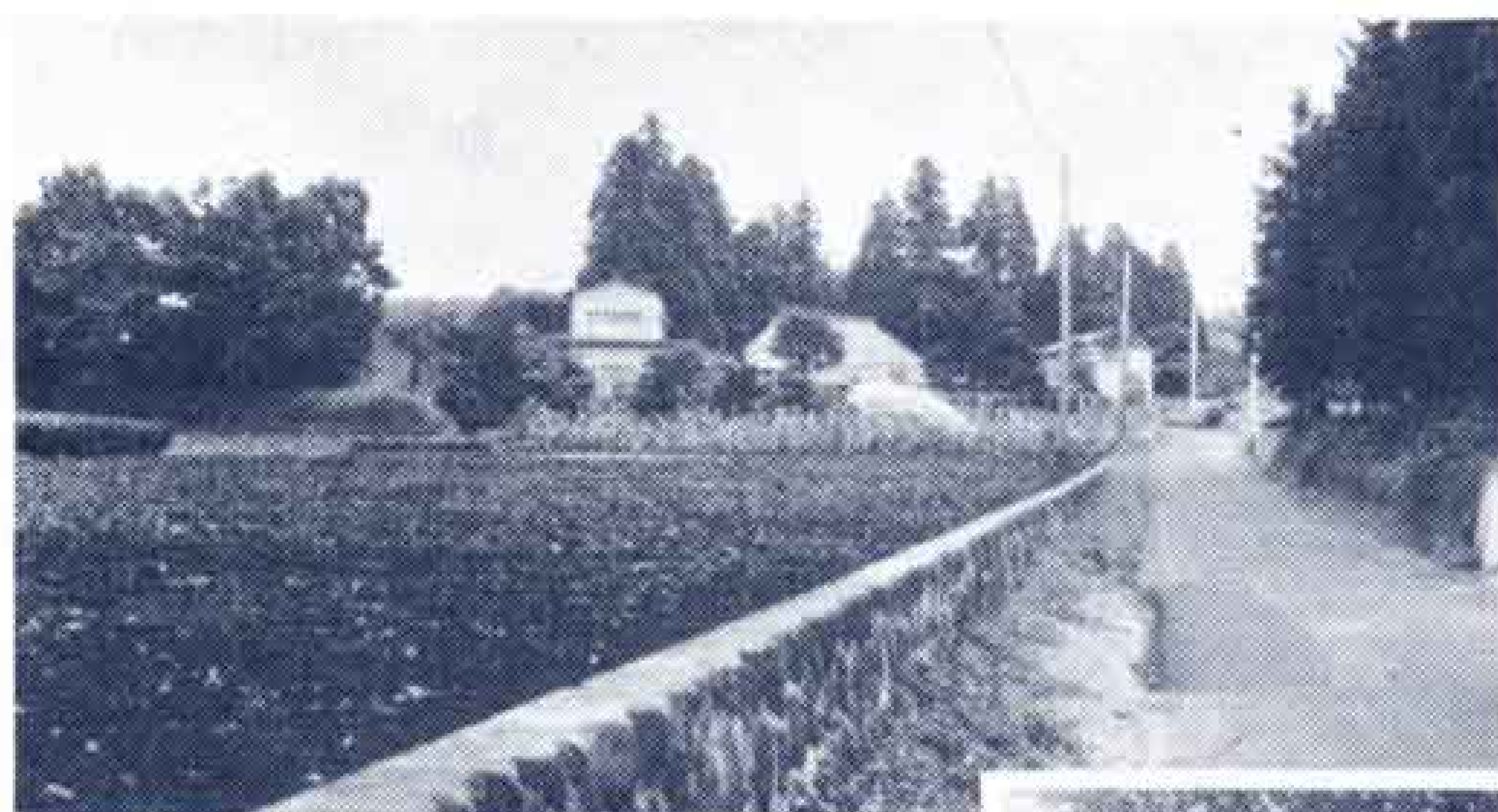
写真は次郎長町(上)と同開墾記念碑(右)