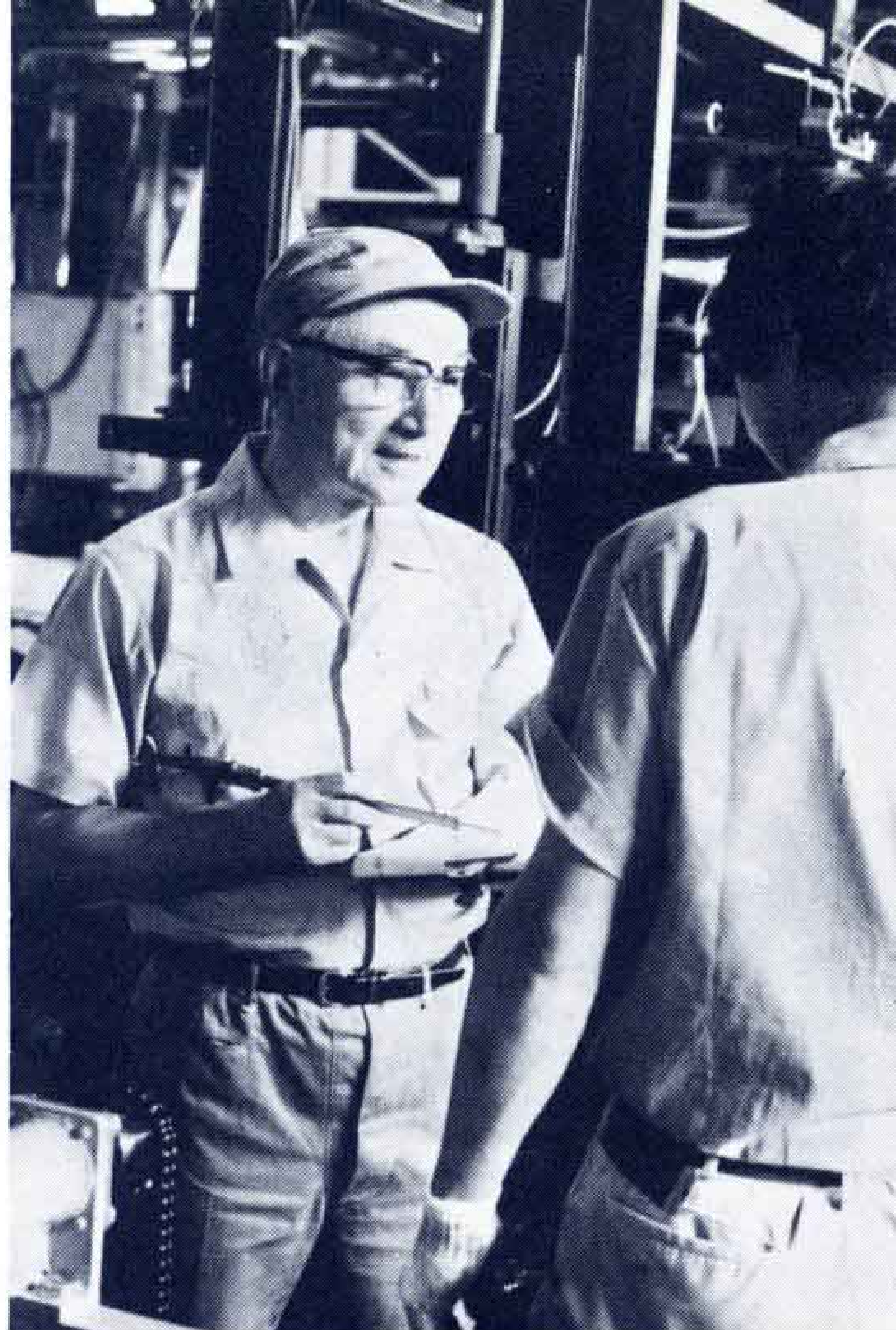
〔現場での打合せも…〕

週に1回でも2回でも仕事をする必要がある」最後に、「今までの体験を生かして社会に役立てれば幸せです…」と話していました。