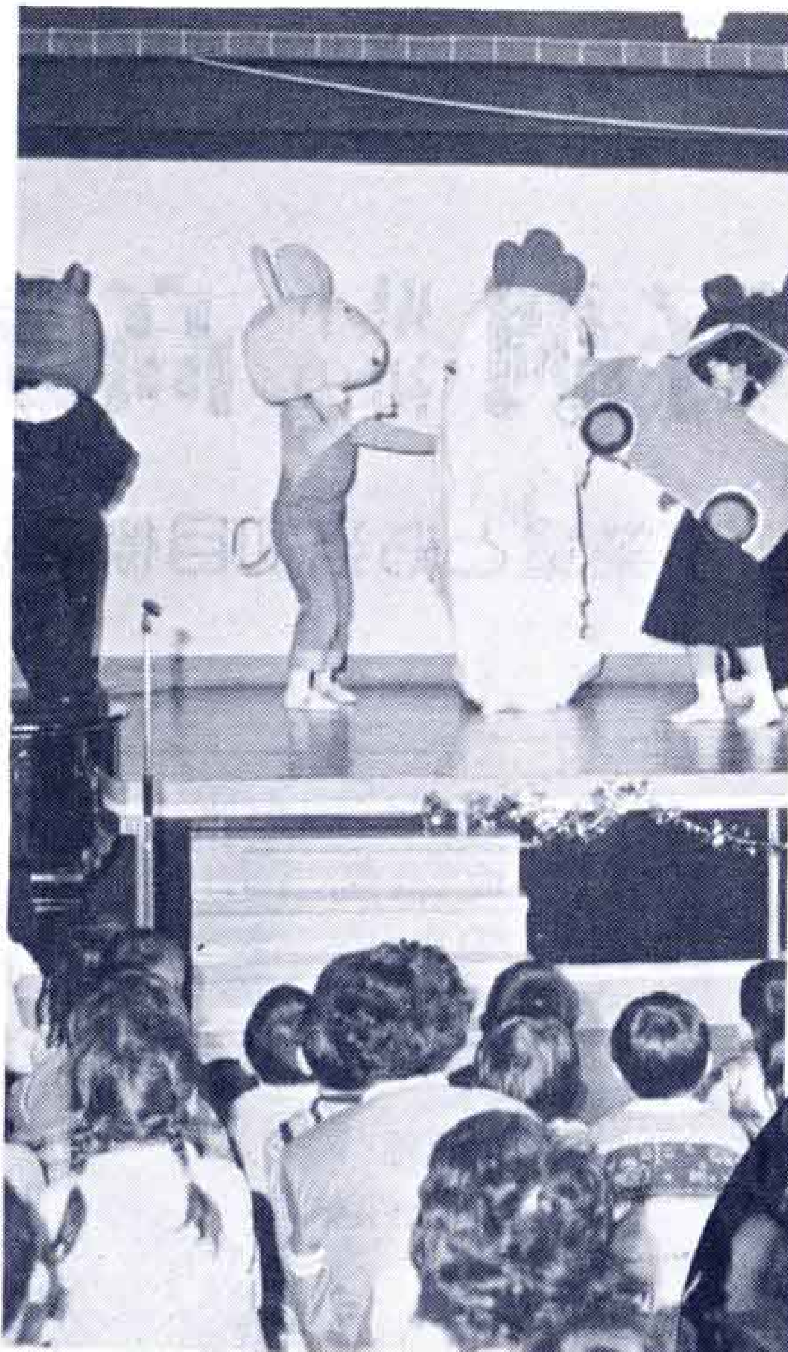
吉原高校の生徒が交通安全の人形劇を子どもたちに披露