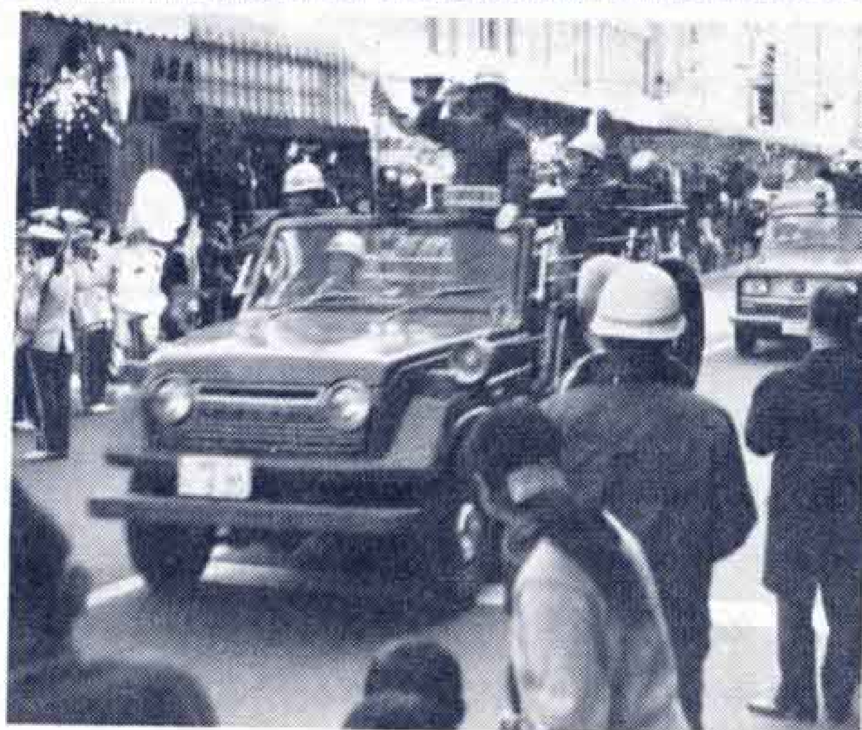
式典のあと、吉原本町通りをパレードしました。