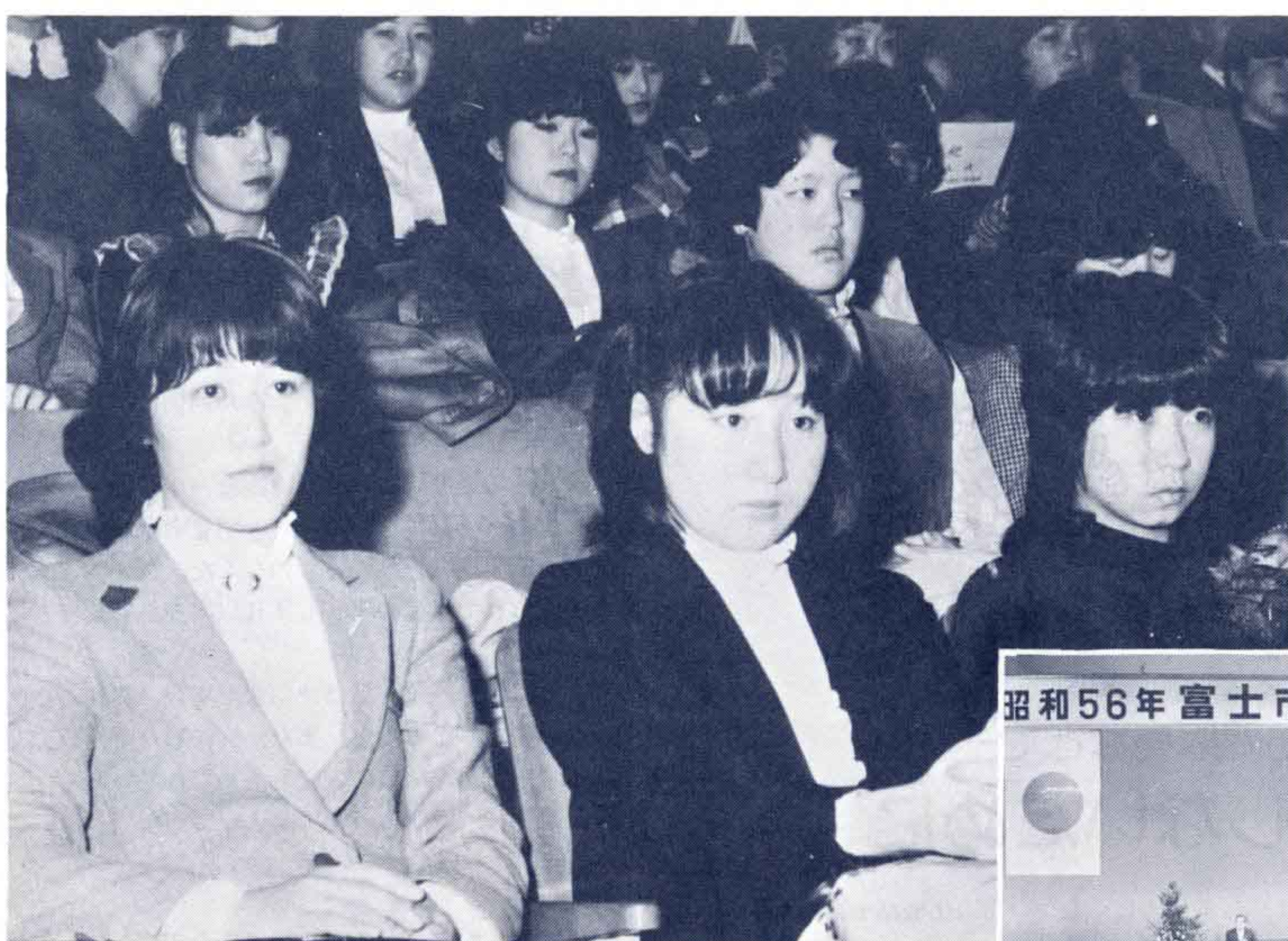
一月十五日富士文化センターと吉原市民会館で成人式が行われ市内では二千五百五十二人が成人に