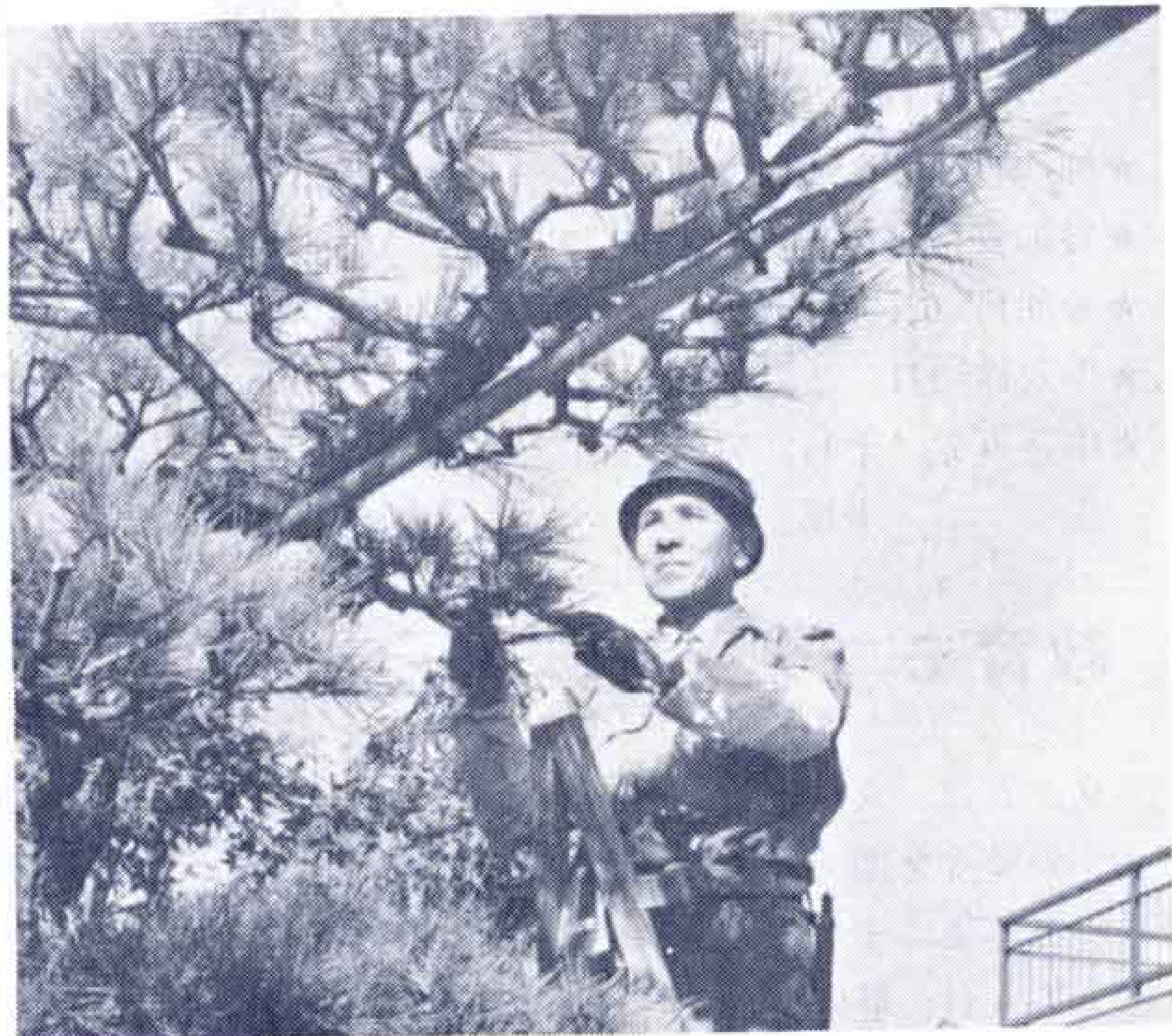
〔豊かな経験を生かして〕