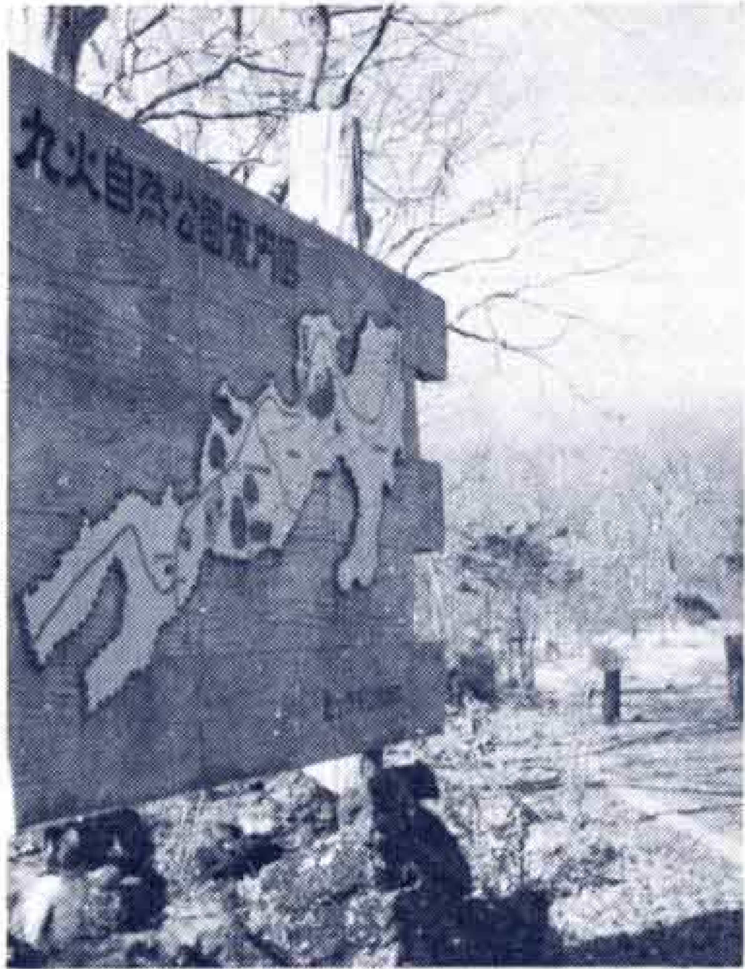
【整備される丸火自然公園】

そこで、みどり豊かな都市づくりには、街路・公共施設・家庭・工場の緑化、都市の美化と清潔保持のための「都市美化運動の推進」などを計画しています。