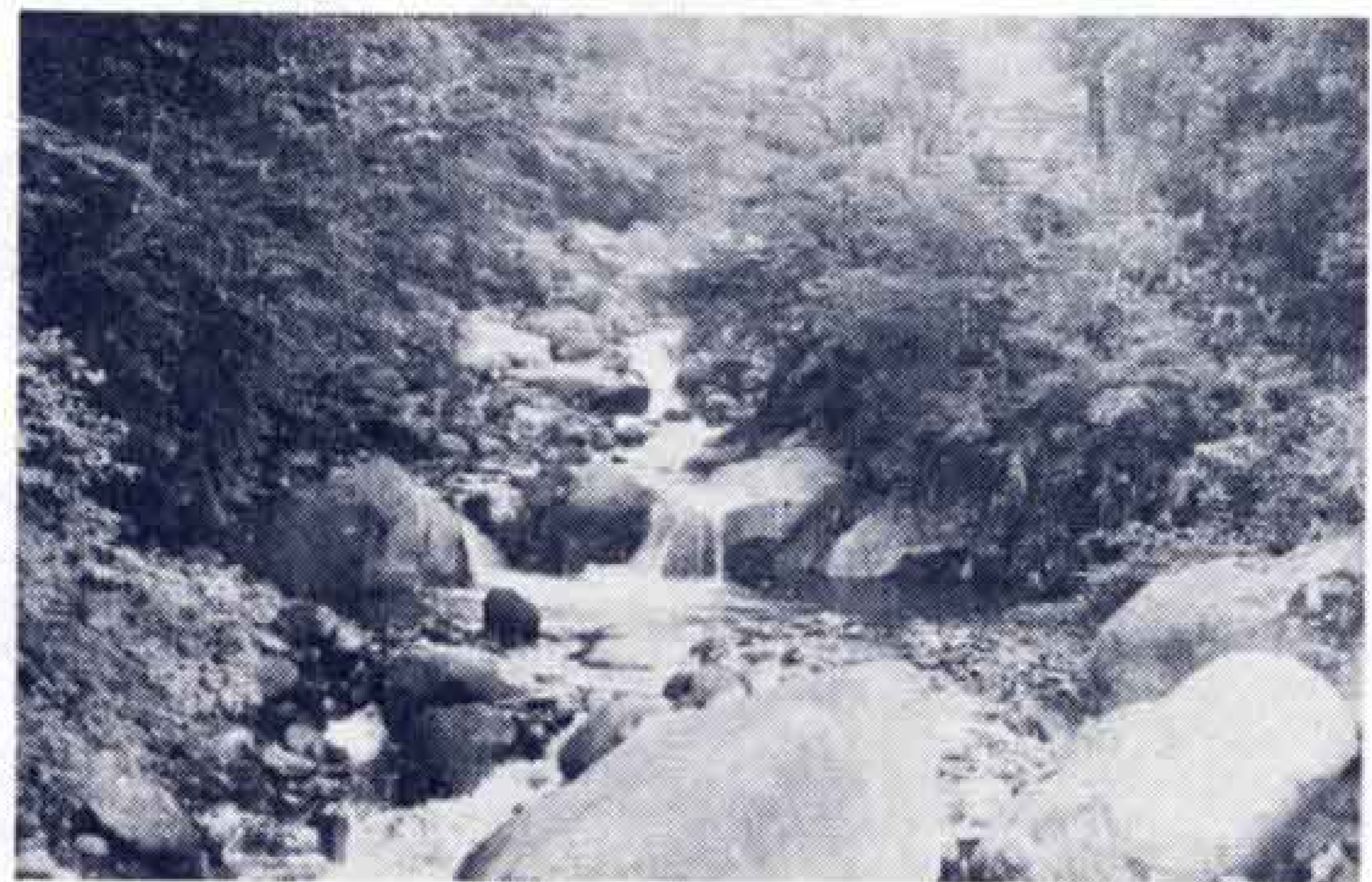
【植生豊富な須津川溪谷】

また緑化は、生活環境整備の身近な問題であるため、その視点を、「緑を守る」「緑をつくる」「緑を育て