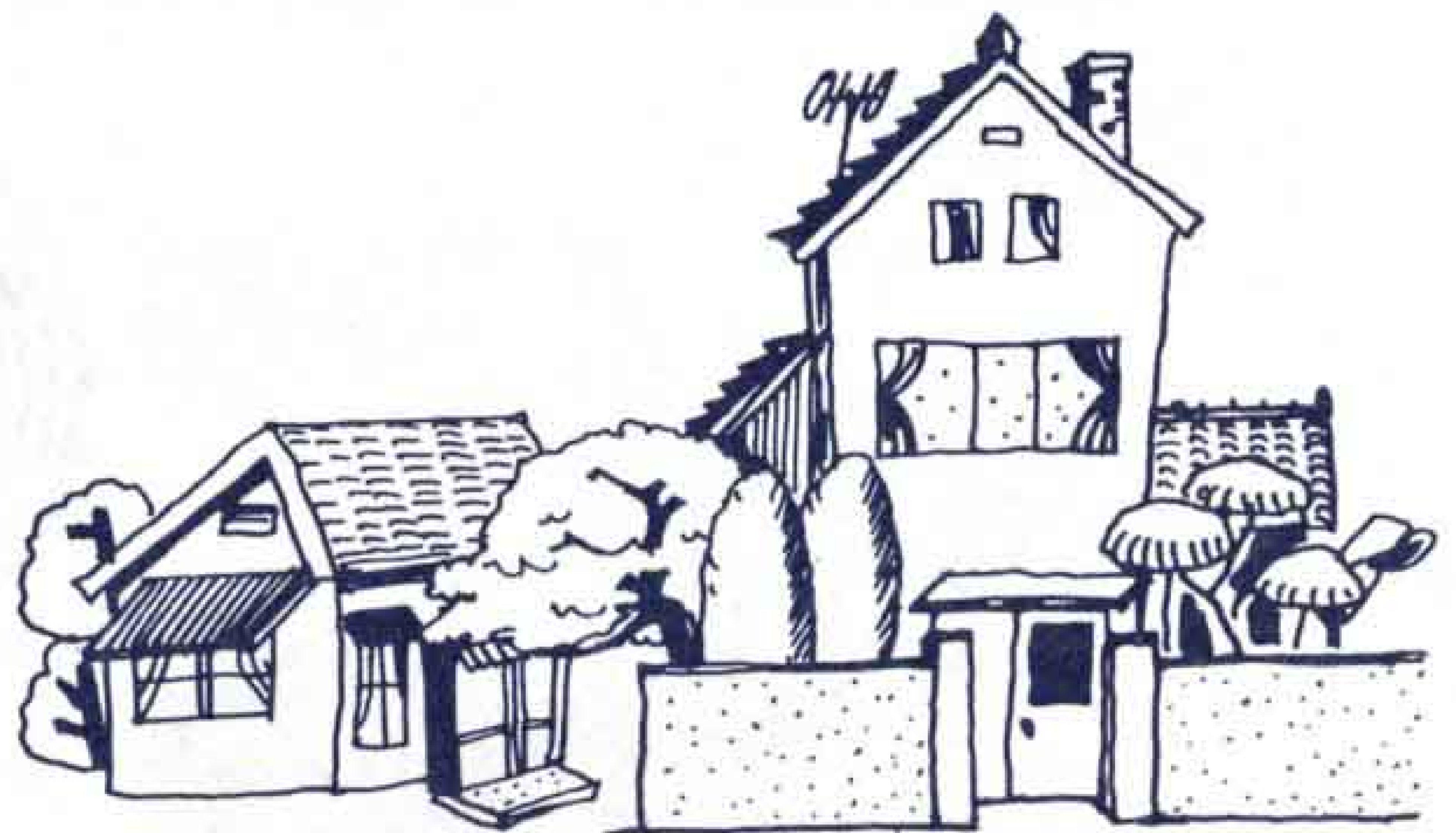
隣りの家に迷惑にならないように気をつけましょう