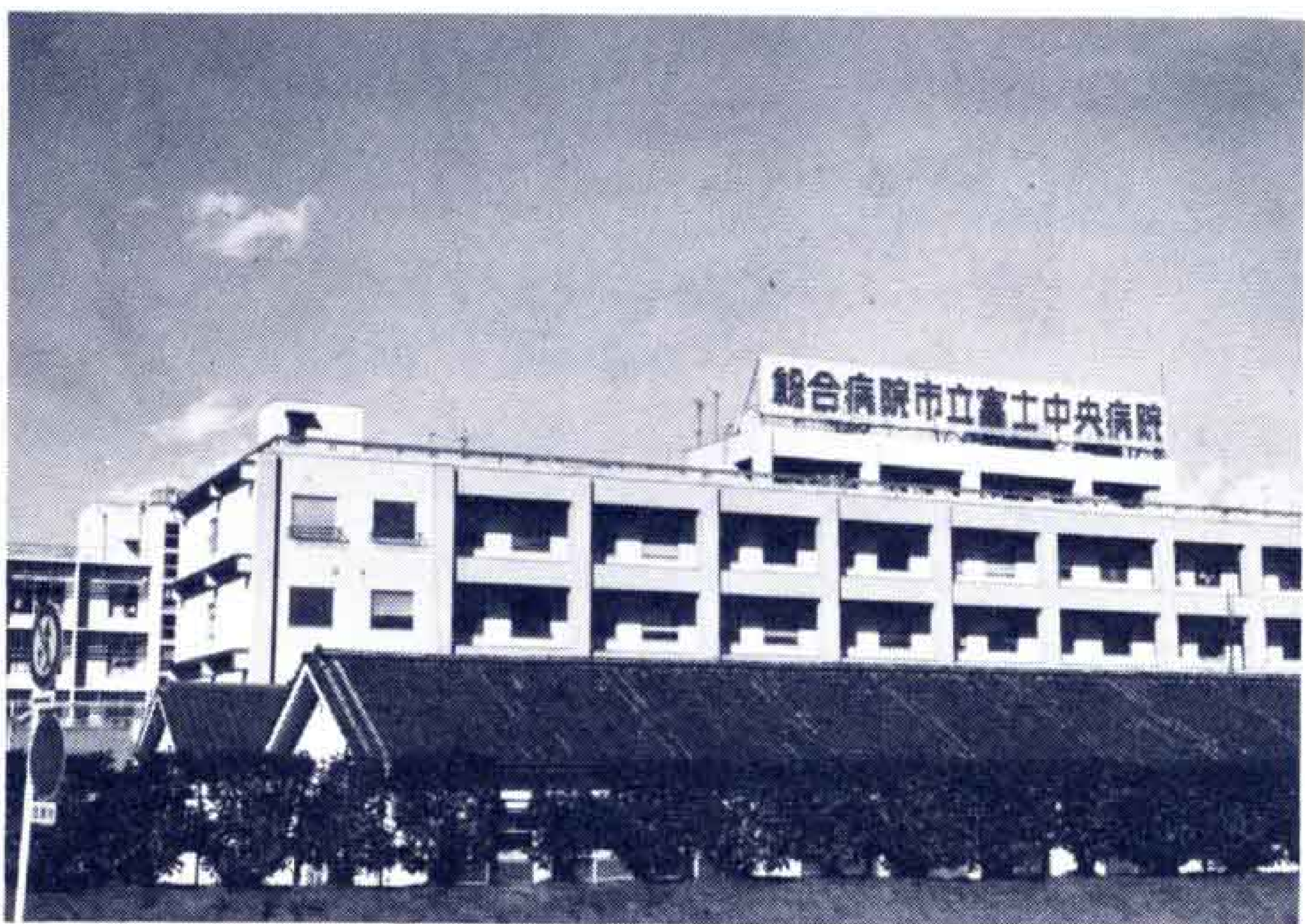
【市民の健康を守る中央病院】

前年にくらべ約1億5,000万円ほど少なくなっておりますが、市民の健康を守るための総合病院として、市立中央病院の増改築があります。いま議会に特別委員会が設けられ、同病院の増改築基本計画が鋭意検討されており、近く結論を待って予算化がすすめられます。