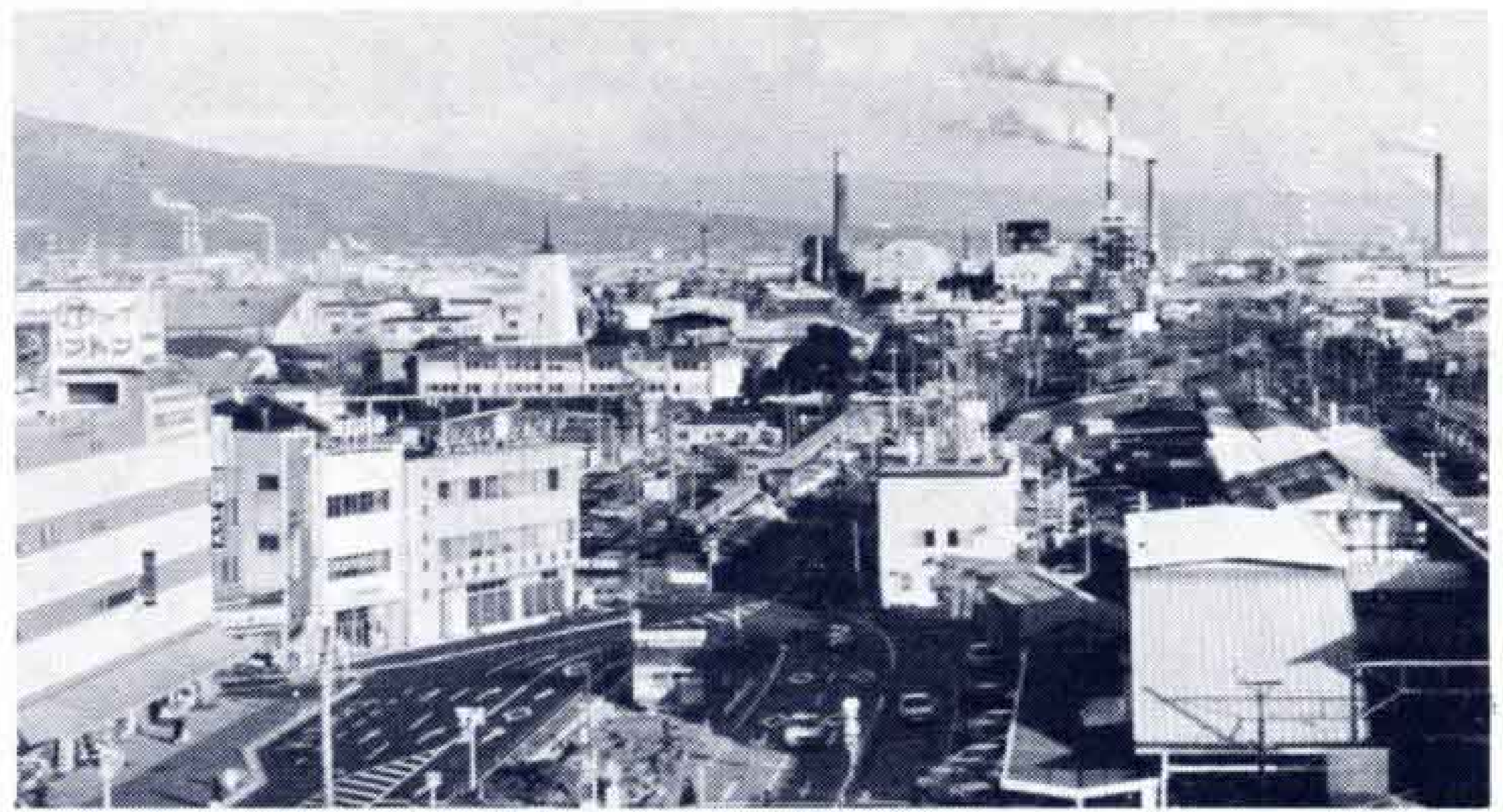
【整備される富士駅前】

特に新規事業では、第3保育園(原田地区)の新築、母子家庭等への医療助成をはじめ障害児保育の促進事業強化、1人暮らし老人世帯に簡易火災警報器が新しく取り付けられます。また、昨年6月指定を受けた「障害者福祉都市」の推進事業、生活保護家庭の高校入学準備金援護や県下初の「高齢者事業団」が、この7月ごろ発足のための予算措置、吉原、富士養護老人ホームを統合し、富士見台団地に新築すべく用地取得造成費も予算化しました。