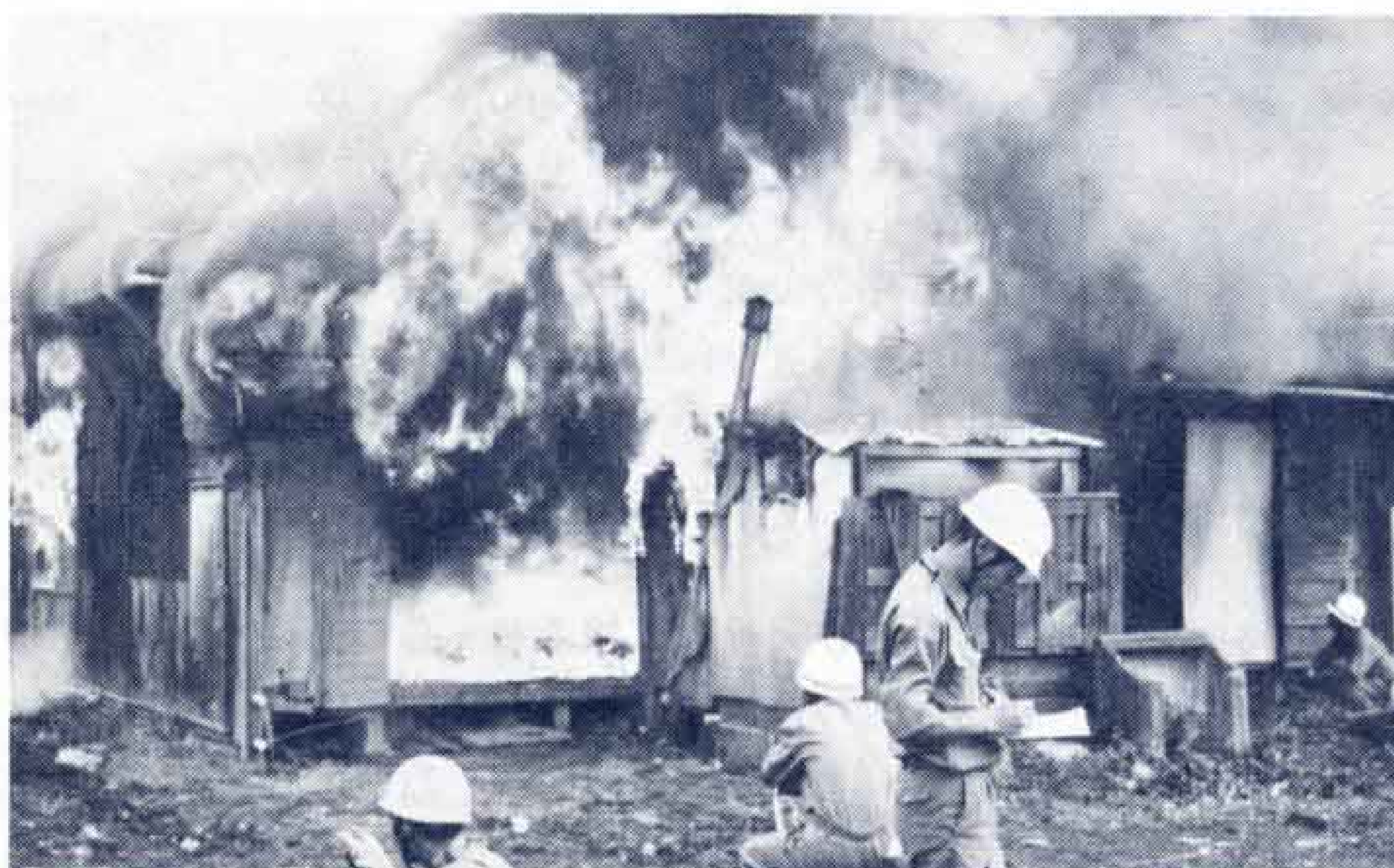
【火災実験で貴重なデータを】

市消防本部では、データの分析を急いでいますが、この実験でハッキリしたことは、防災加工のカーテンは、くすぶるだけですぐに火がつかないことが判り、また屋内が整理整頓されていれば、延焼時間を多少でも伸ばせることができます…と生きた教訓として語ってくれました。