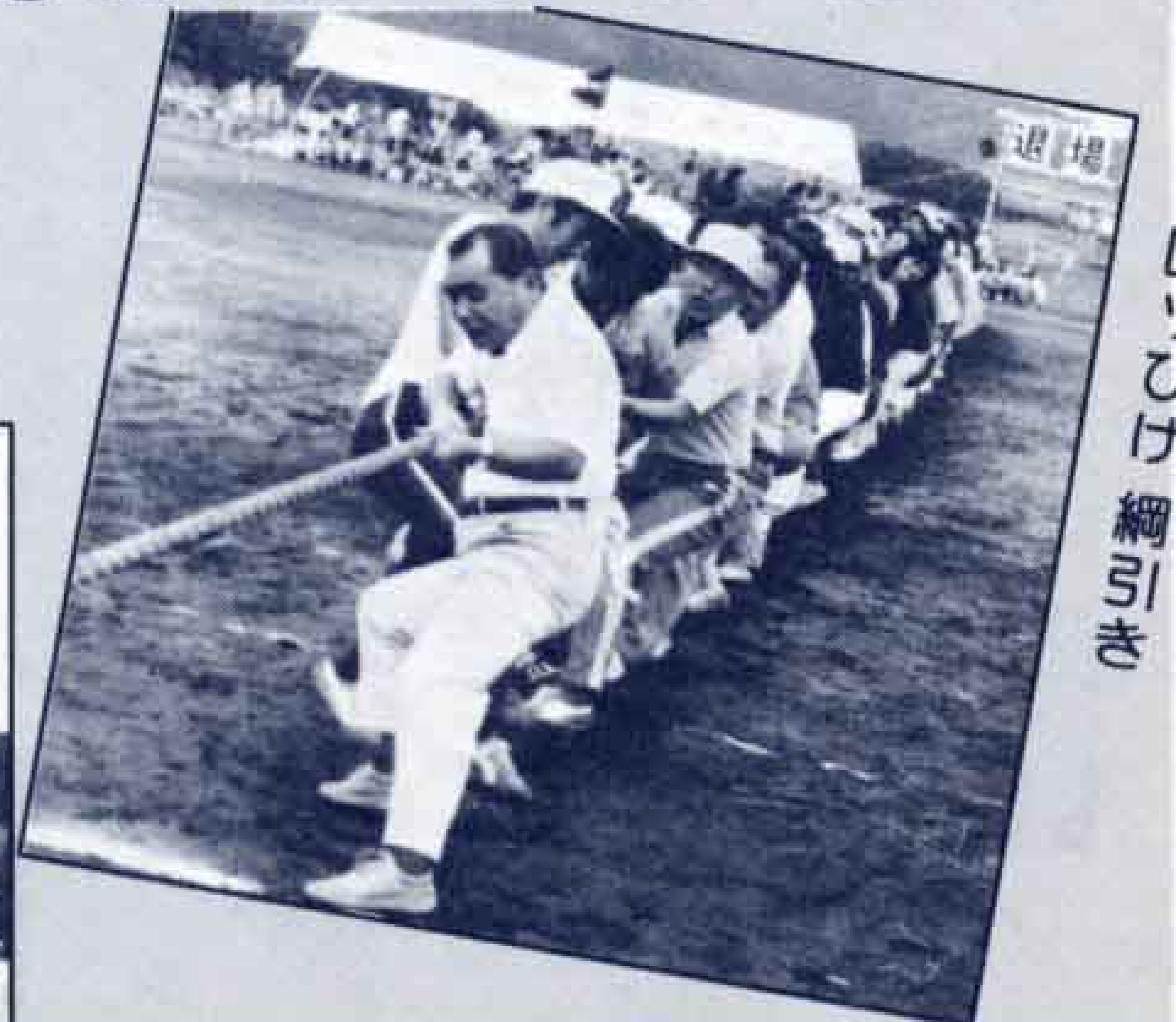
シムシムと綱を握る