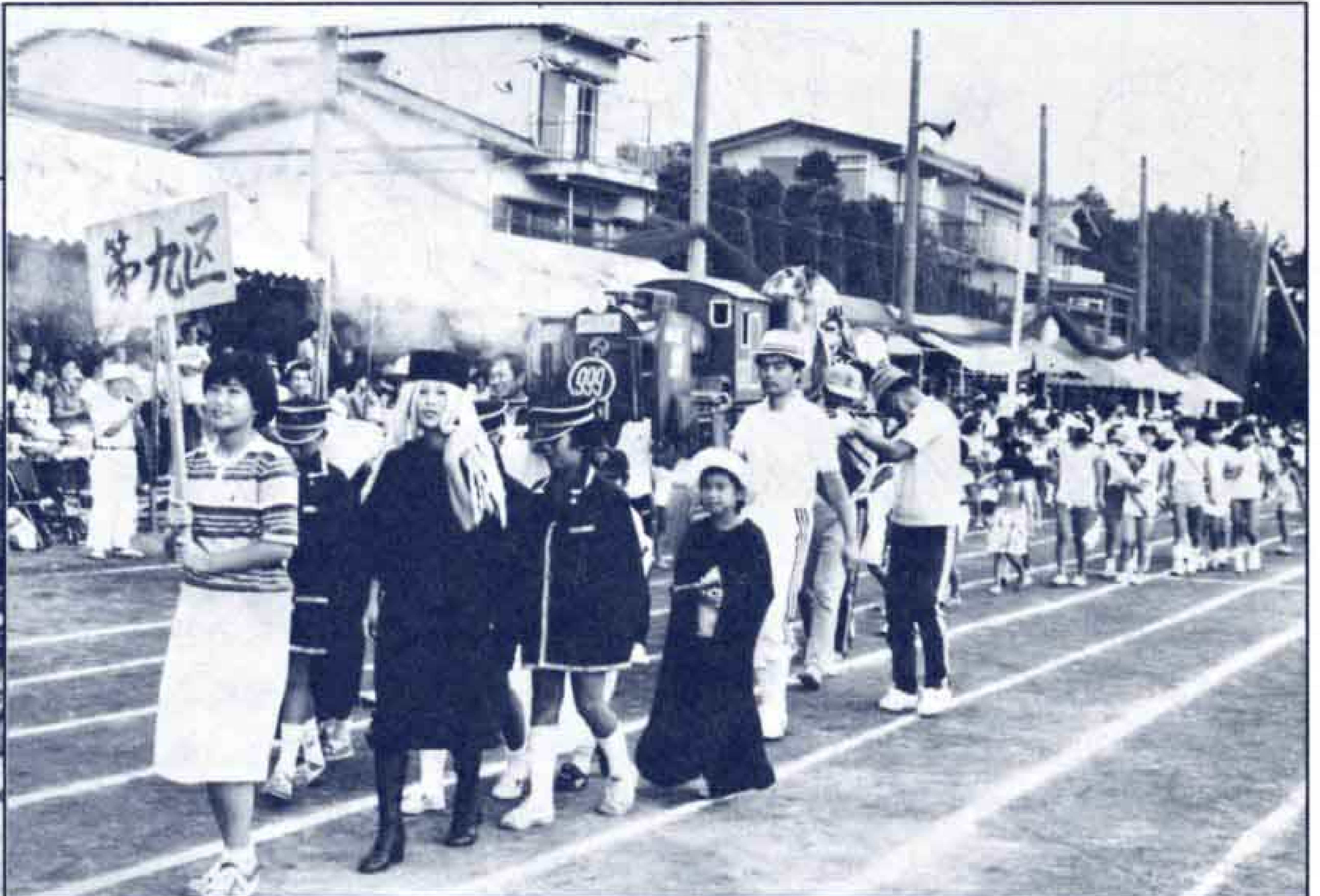
おらが自慢の仮装行列