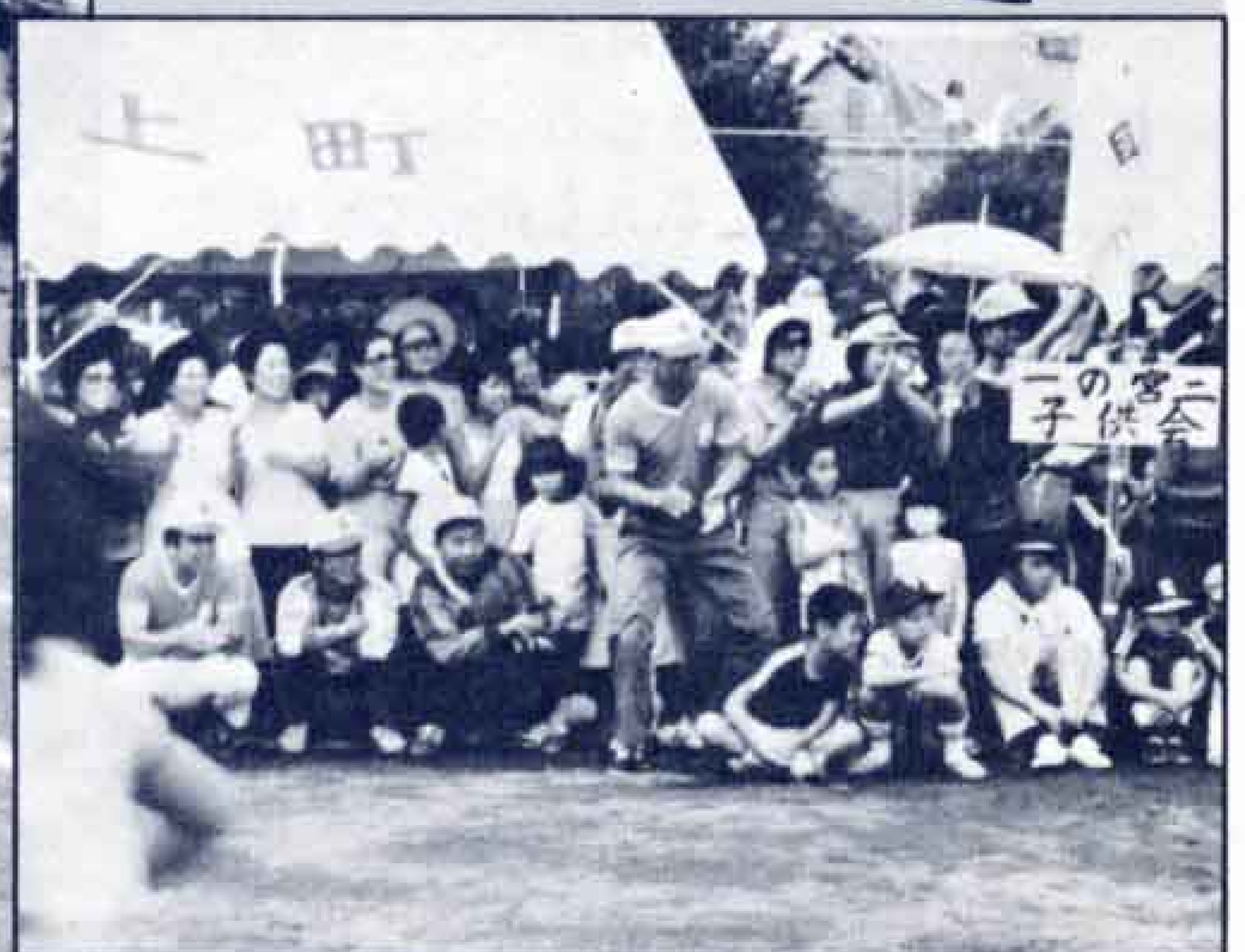
ガンバレ、ガンバレ！全員で声援