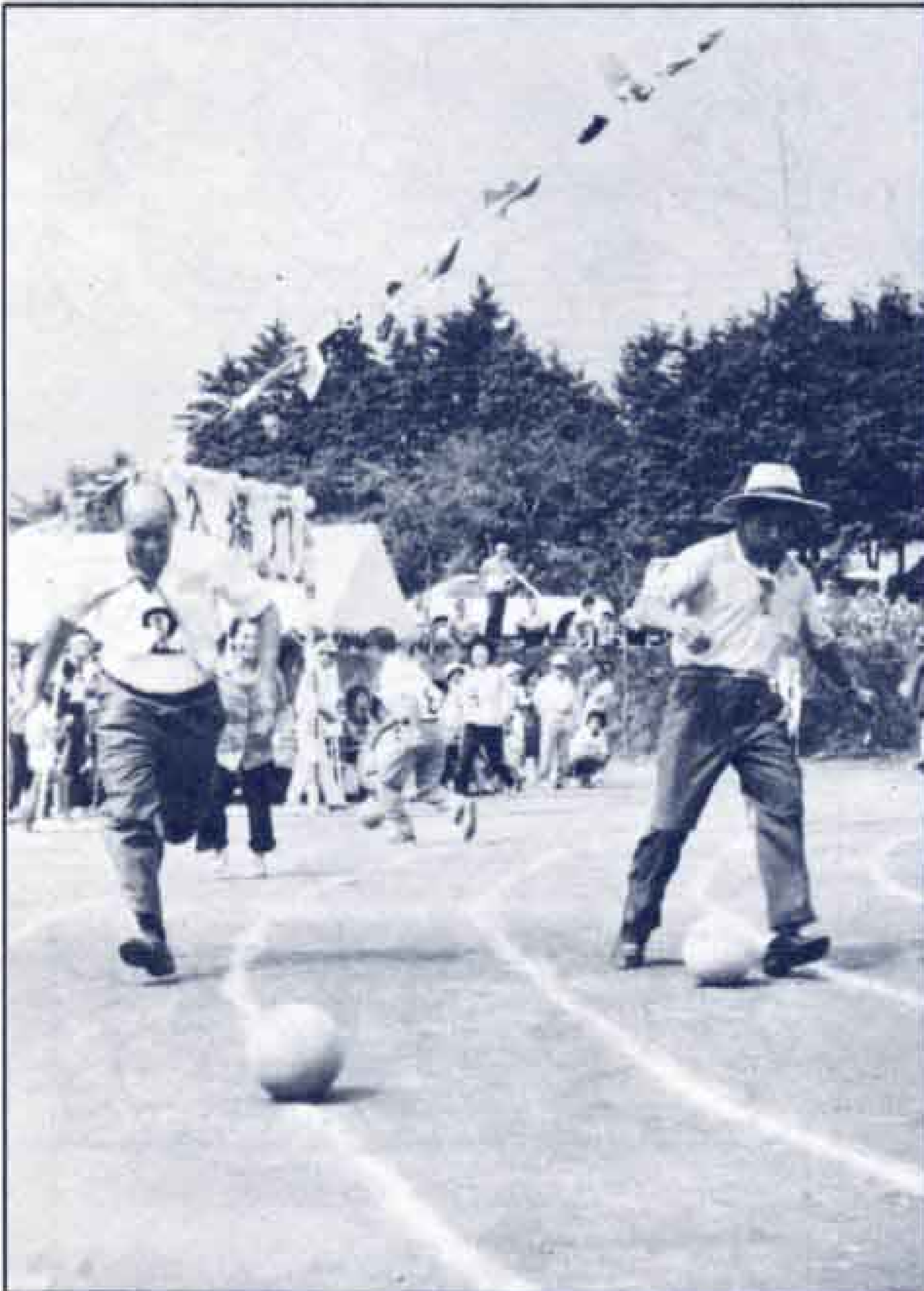
ボールけりリレー