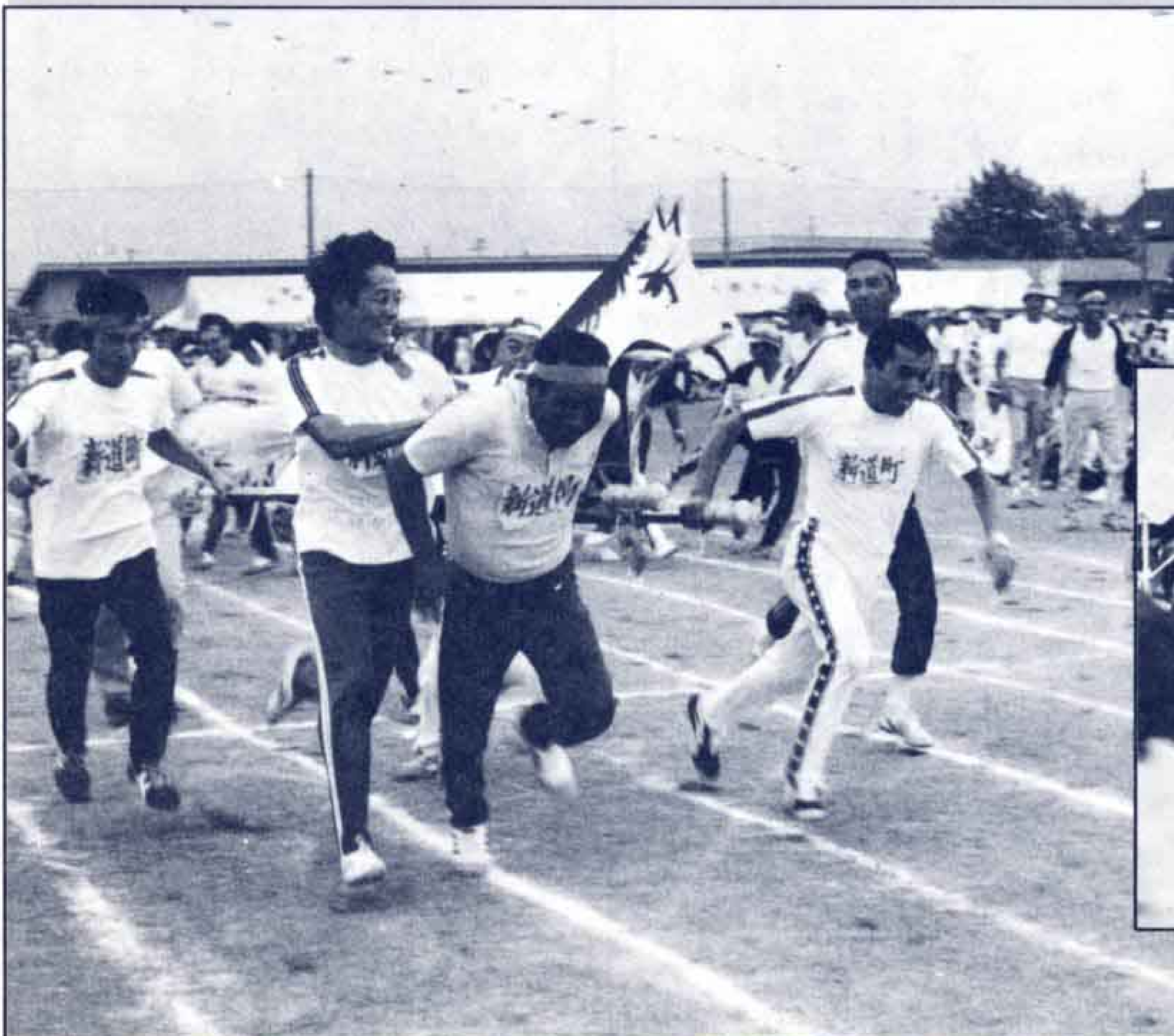
加島五千石ダービー