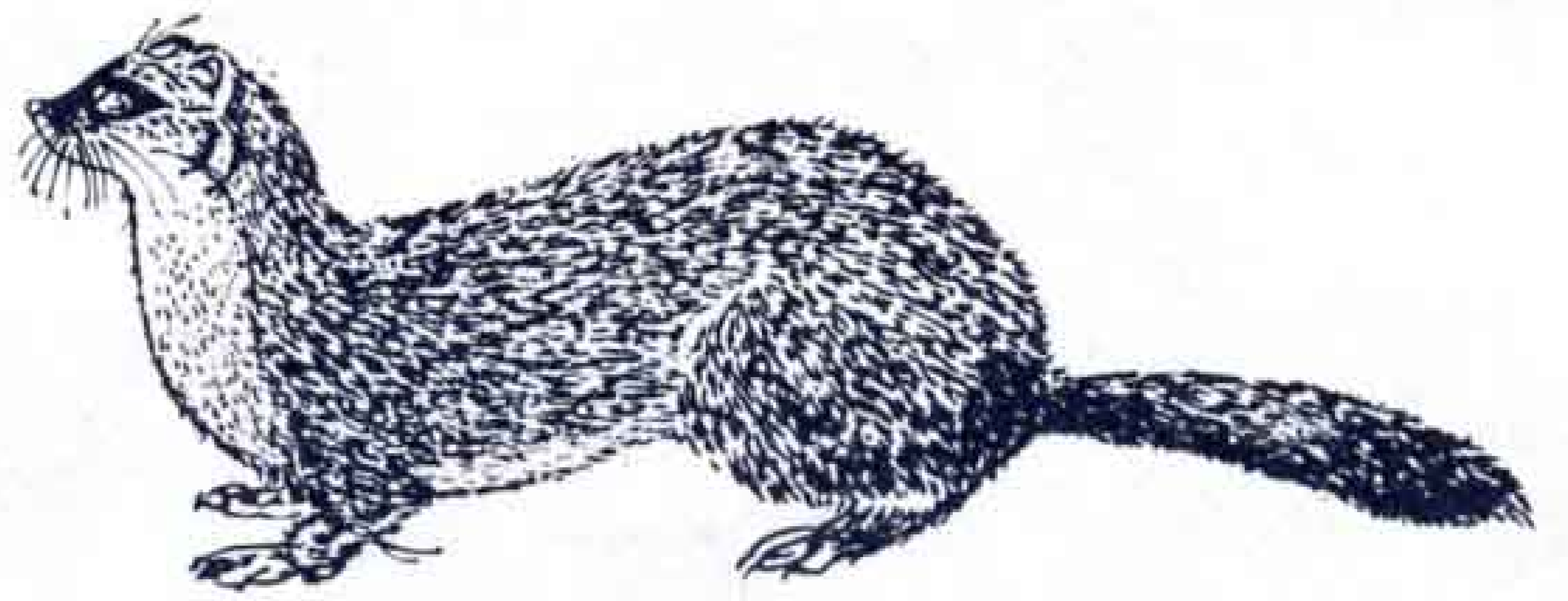
ホンドイタチ (イタチ科)

その昔、沼川に「キツネ橋」の名があるように、富士市の全域にすみついていたことでしょう。