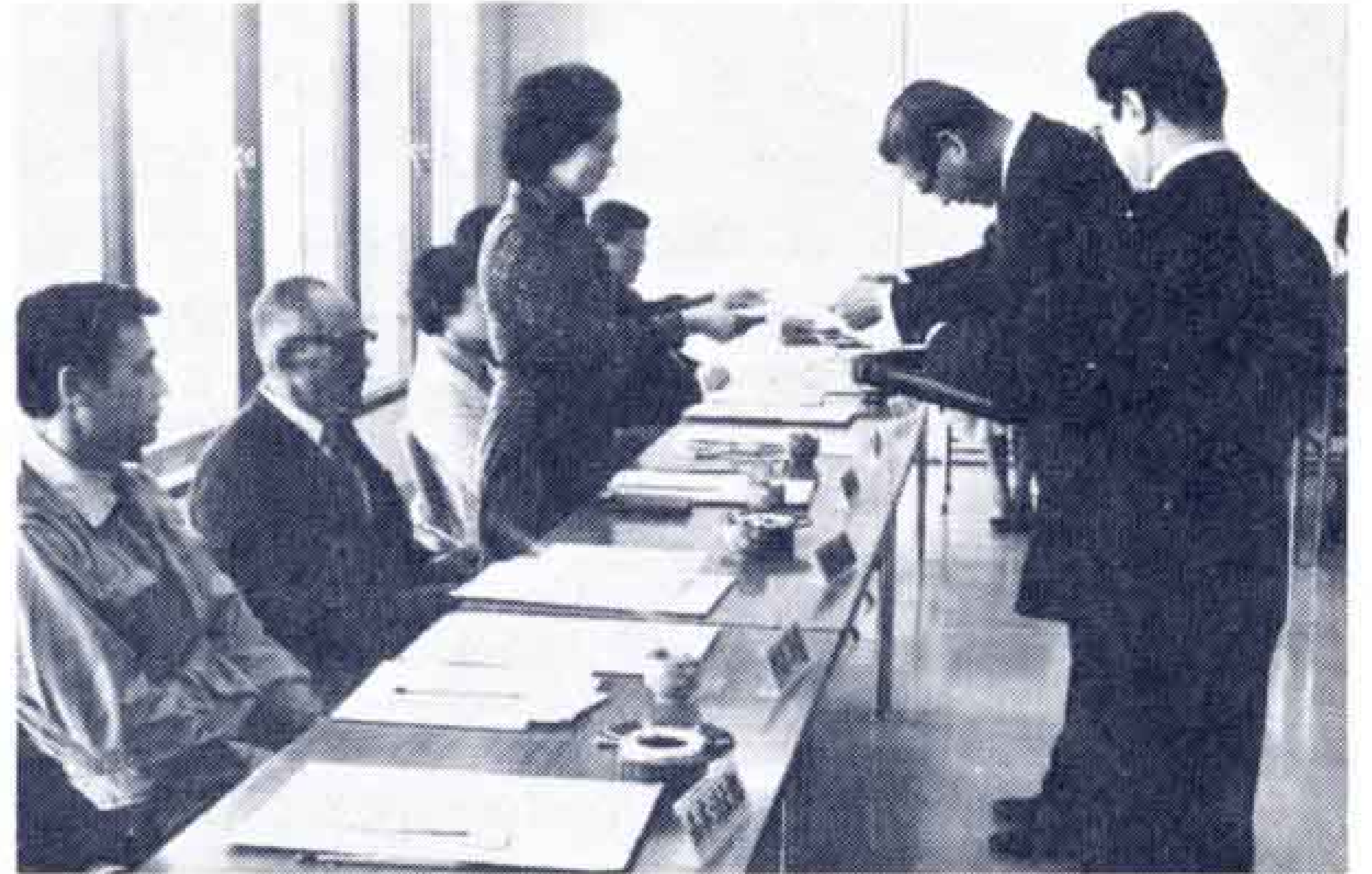
【渡辺市長から委嘱状を受ける市政モニター】

委嘱された、新しいそれぞれのモニターの皆さんに向う1年間、市民・消費者の良き代弁者として“あな