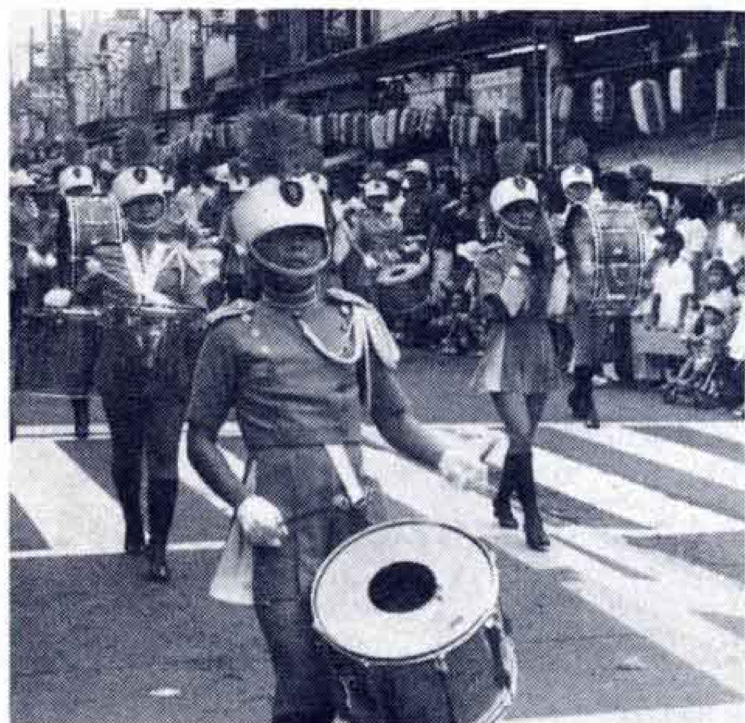
↑東海大学生による鼓笛隊パレード