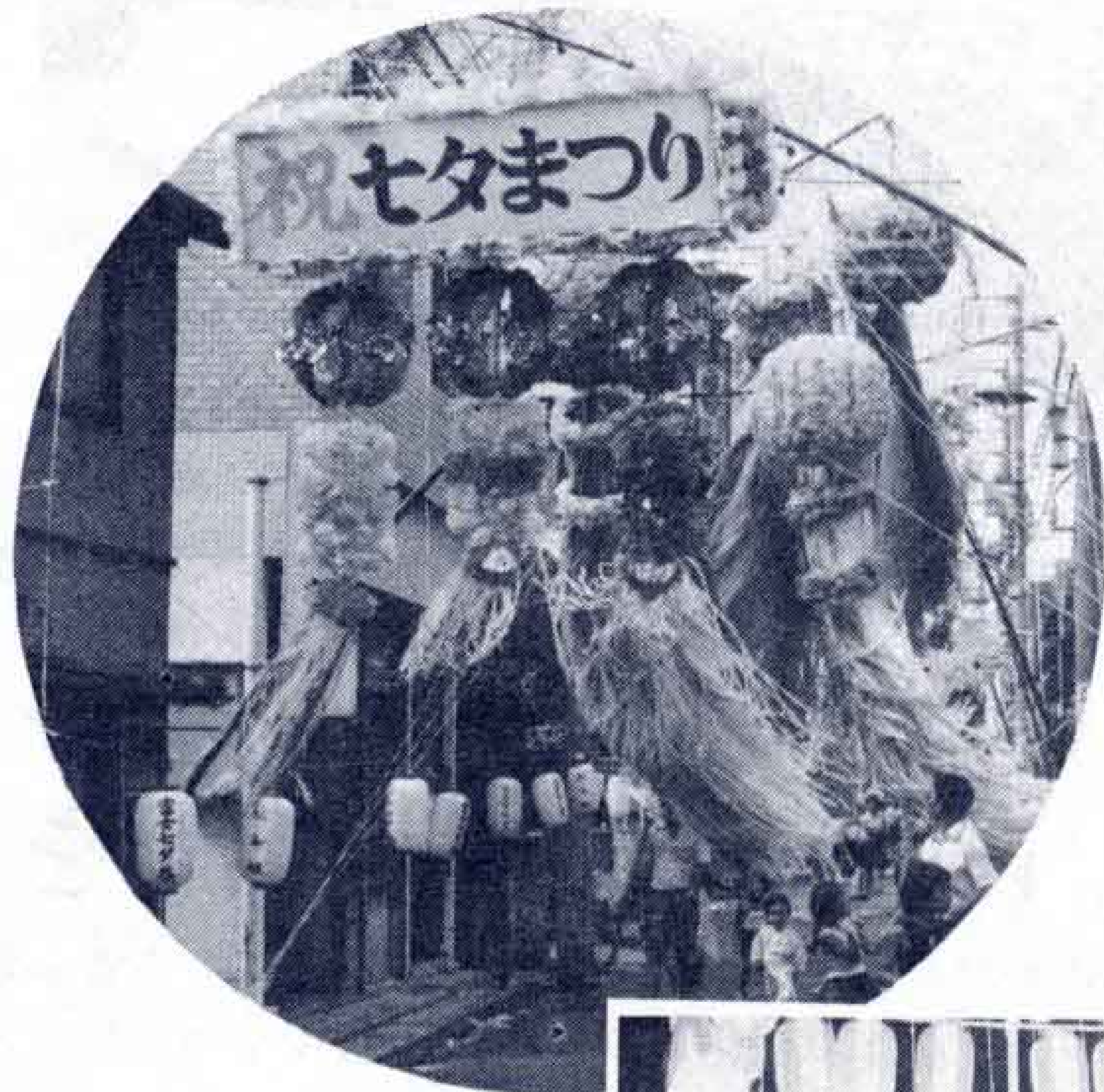
←富士仲見世通りの七夕祭