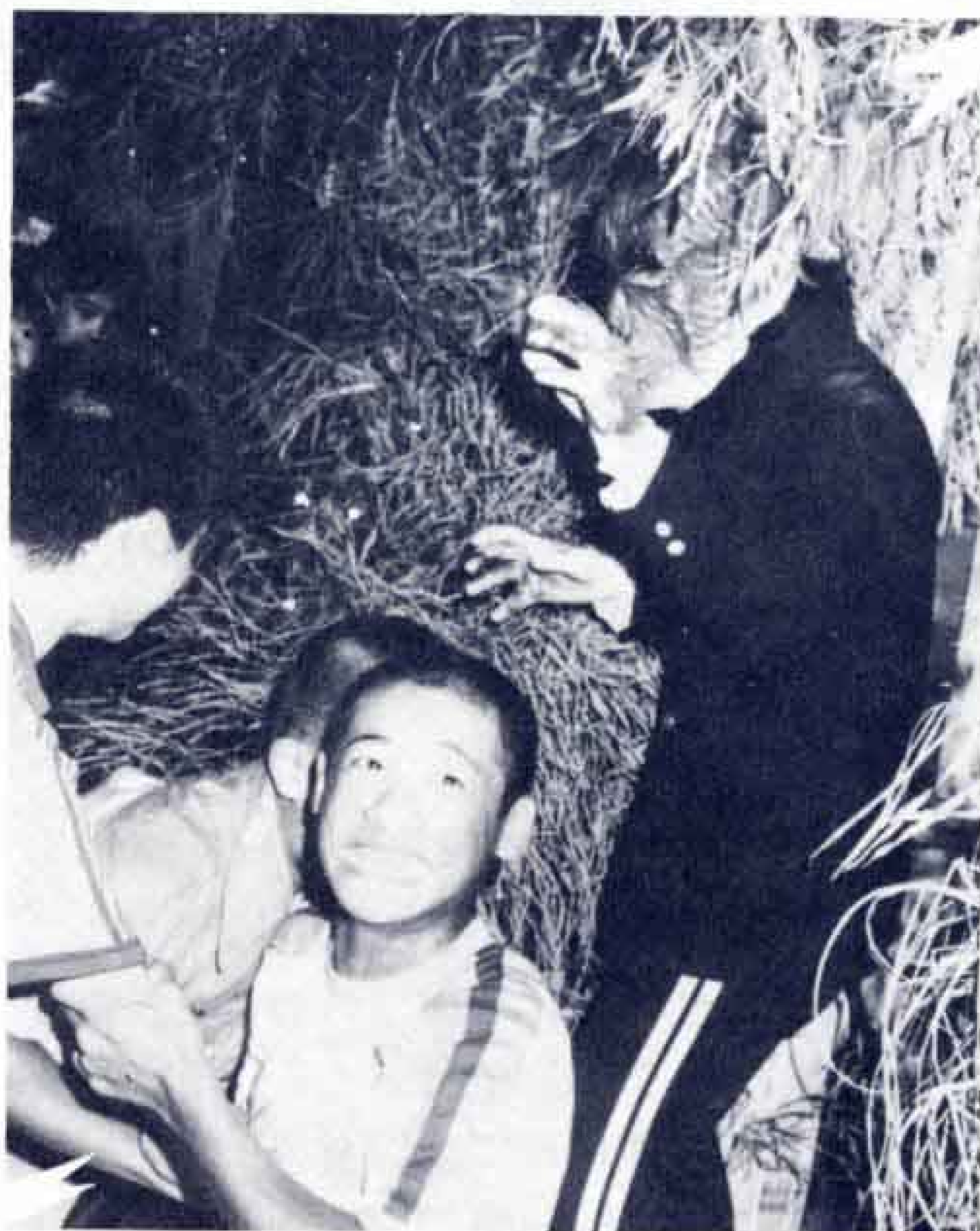
【写真・コワーイ と腰を抜かす中学生】

これは、日頃、勤労青少年ホームを利用しているホームリーダー会の皆さんが、子どもや、おとなの皆さんに楽しんでもらおうと毎年実施しているもので、会場の中では、オオカミ男や、女のおばけに、見物人が悲鳴をあげていました。