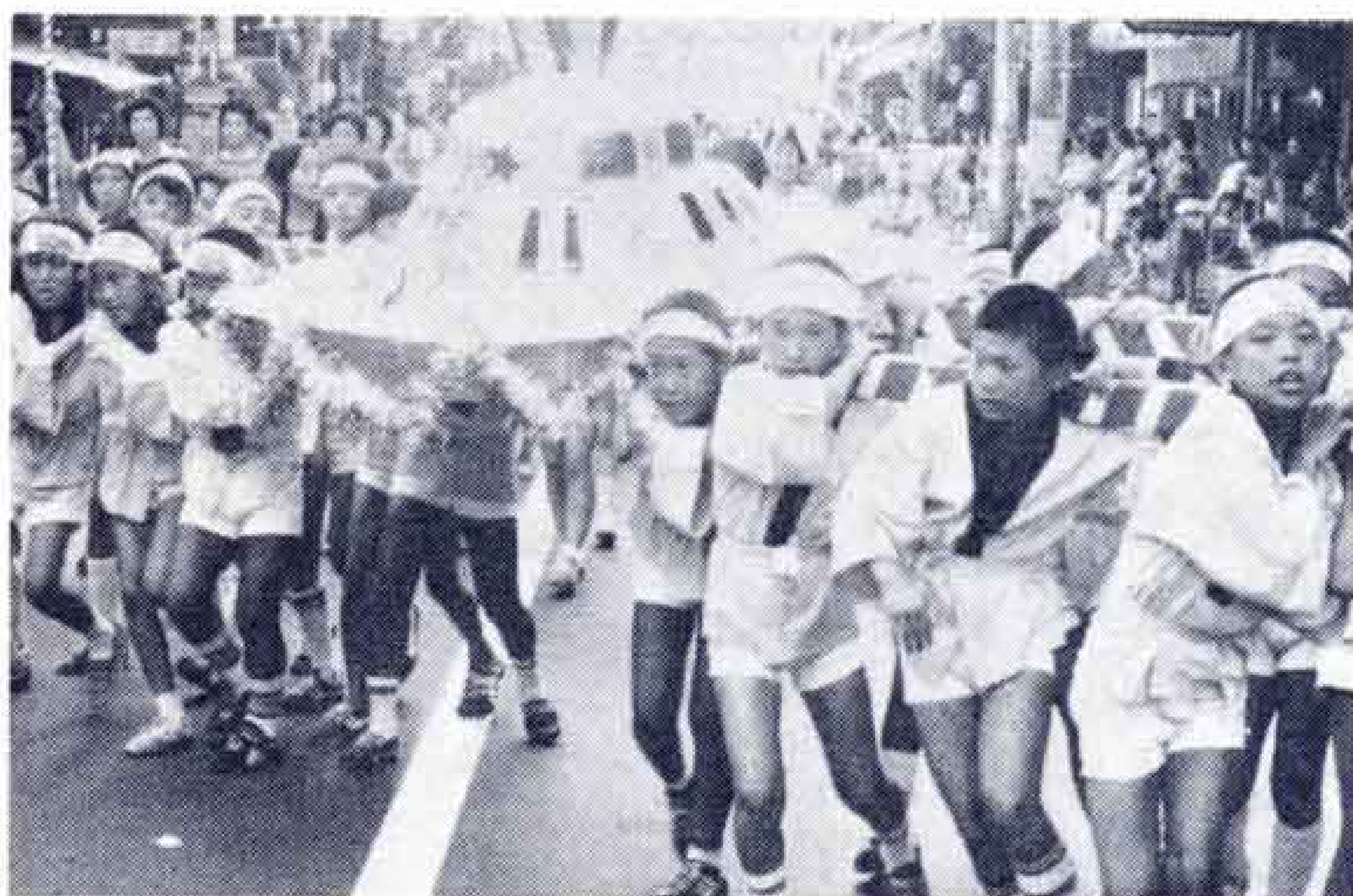
↑ UFOの子どもみこしでパレード