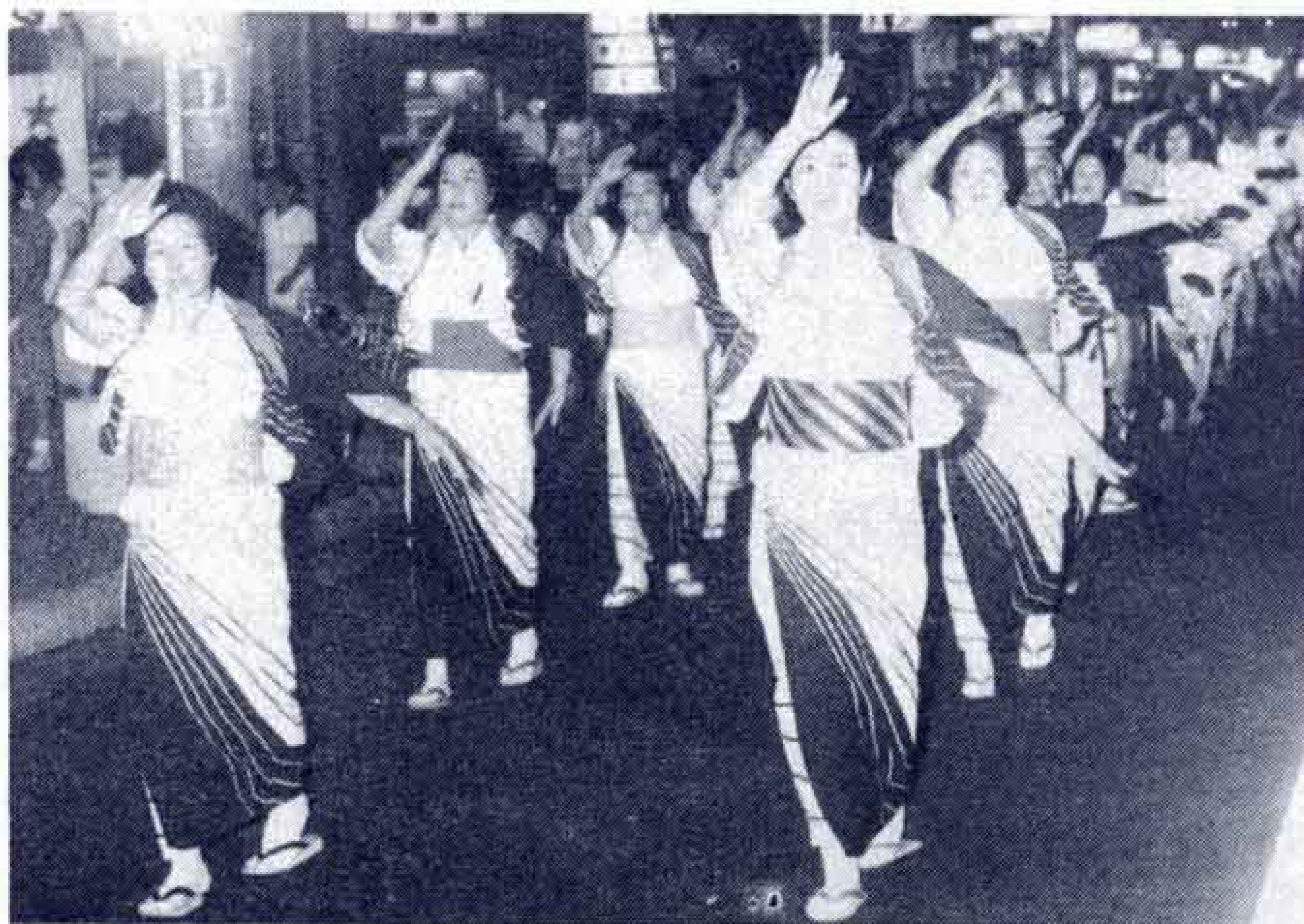
↑商店街をおどり行進するみなさん

みんな歌って踊ろう！ オチャチャノチャと、恒例の富士まつりが8月3日、4日に開かれました。第1日目は、一部の地区を除いて各地区ごとに子どもみこし、おどり大会、第2日目は、吉原、富士、鷹岡の商店街で音楽、みこしパレード、おどり行進が行なわれました。