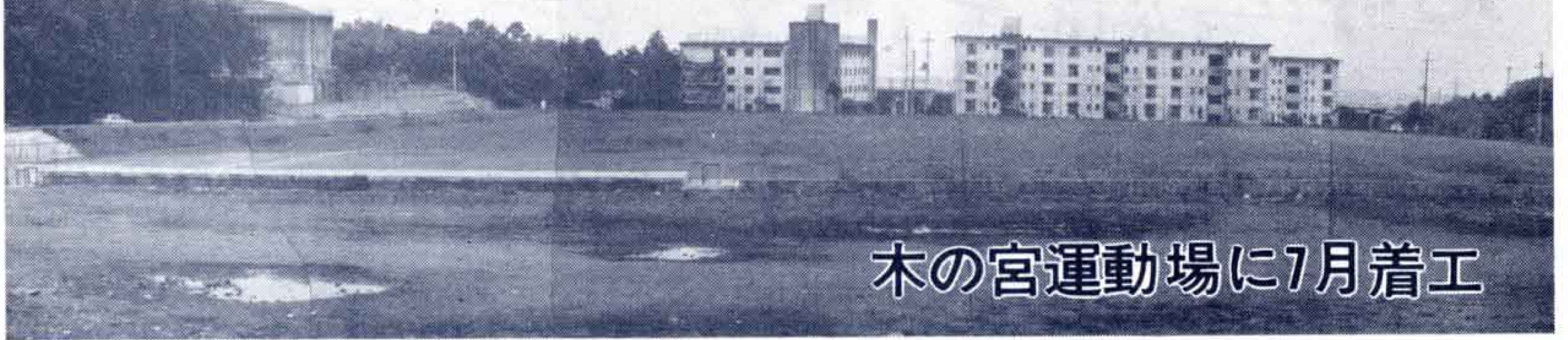
木の宮運動場に7月着工

来年4月開校予定の富士学区の新設高校は、去る4月27日正式に富士市木の宮運動場へ建設されることに県から発表されました。