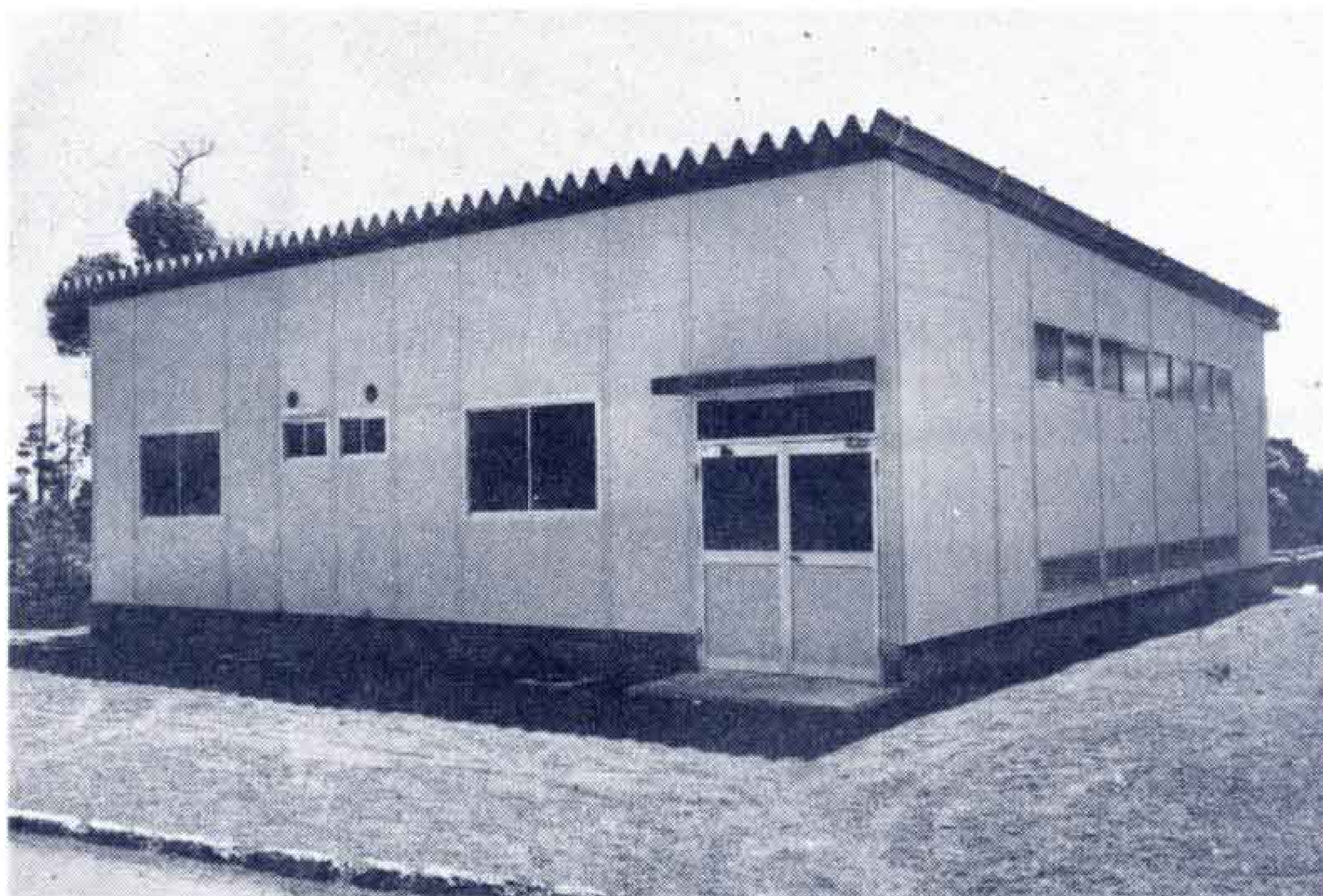
【オープンした卓球場】