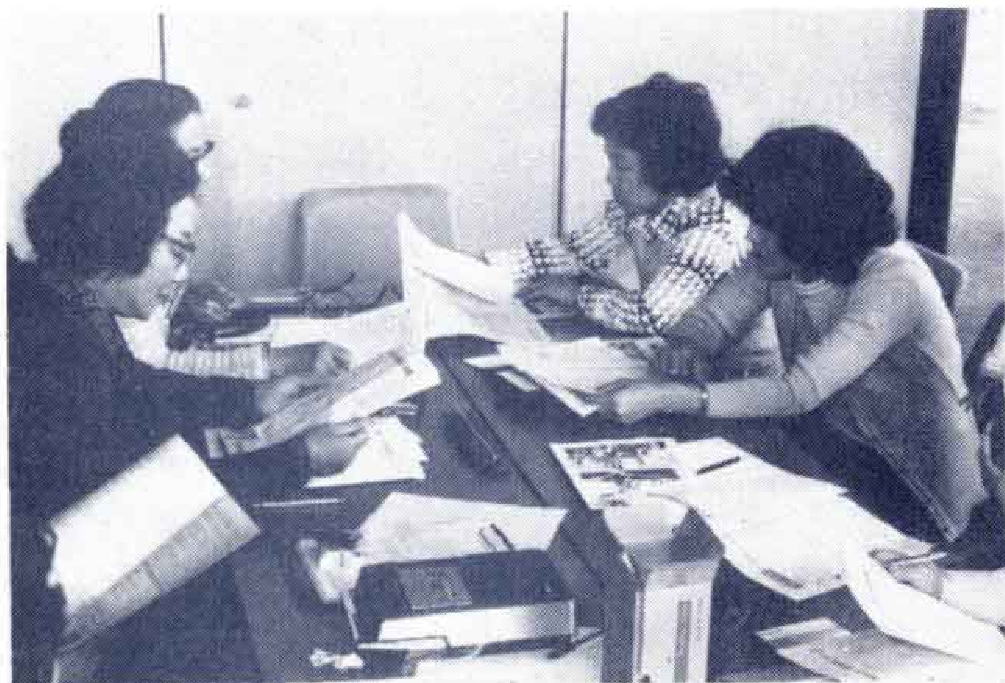
【声を送りつづけるボランティアの人達】

このため、富士市社会福祉協議会は、昨年10月、市内に住む192人の眼の不自由な人からアンケートをとったところ、そのうち39人からぜひ広報ふじの内容を知らせてほしいと希望がありました。社会福祉協議会では、さっそくこの希望にそうためテープレコーダ15台とテープを購入して広報ふじの内容をテープに納め眼の不自由な人に順番に聞いてもらうことになりました。テープの吹込や複製などは、社会福祉協議会に登録されているボランティアの主婦達11人が喜んで引受け、いそがしい家事の合間を利用して毎月声を贈りつづけることになっており、眼の不自由な人からは何よりの贈りものだと言われています。