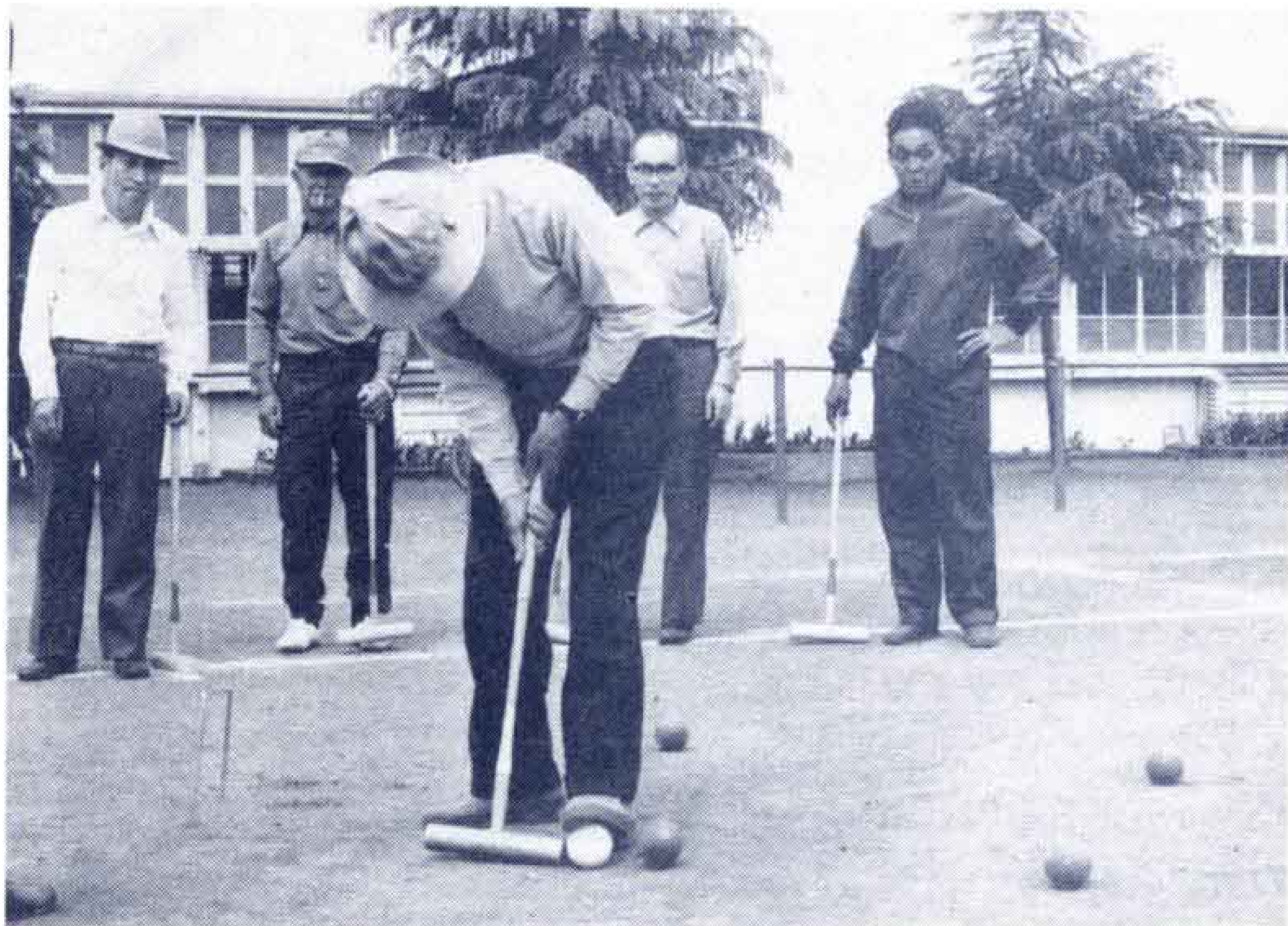
【楽しいゲートボールの講習会】

このゲートボールは、ゴルフに似たスポーツで、ちょっとした空地があればだれでもできることから、教育委員会が、市民健康づくりの一環として市民に普及しようと開いたもの。参加者は、午前中ルールの講習を受けたあと広いグラウンドに出てゲームを楽しみました。