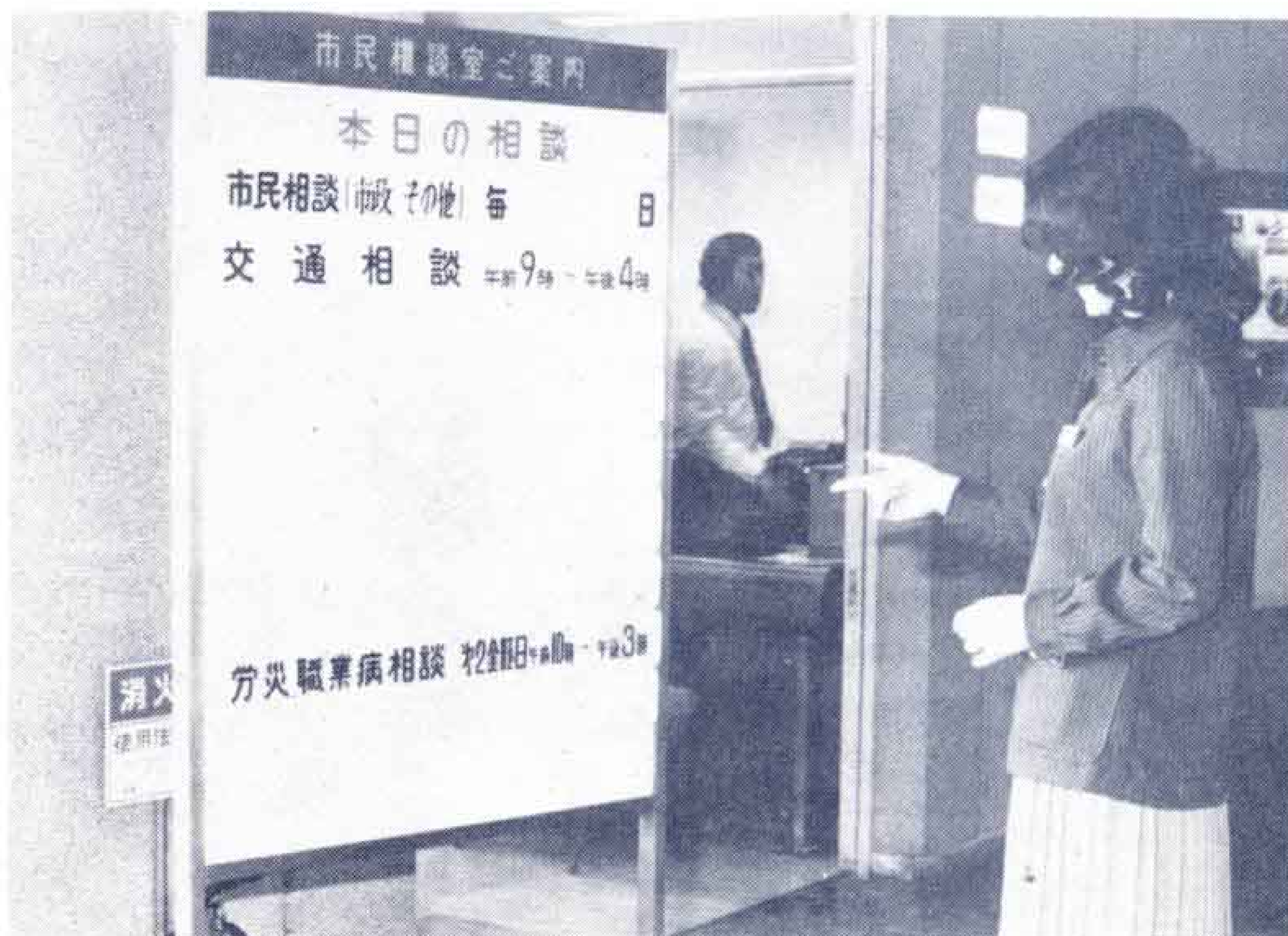
【労災や職業病の悩みごとはどうぞ】

この相談所は、毎月第2金曜日の午前10時から午後3時まで開き、県労働安全センターの専門職員が相談に当たりますので、どうぞご利用のほどを……。