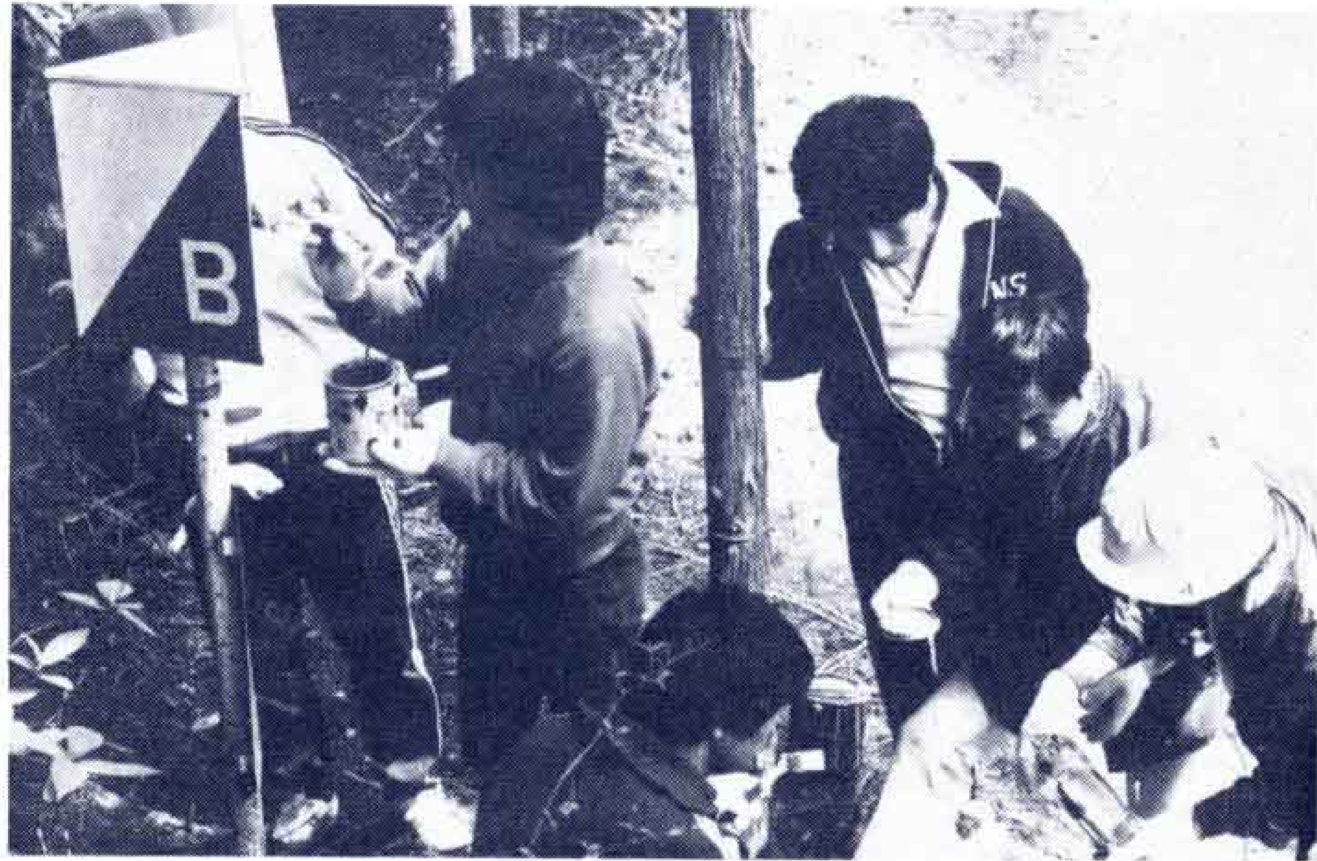
「オリエンテーリングのポストをきれいにするボランティアの人達」

上の人達ばかりです。いろいろなことを知っていて親切に教えてくれますから、楽しい野外活動ができます。みんなも子供会などで、ここを利用するときは少年自然の家ボランティアの人達にお願いして、一緒に生活しながら指導してもらおうといいですね。そのときは、前もって少年自然の家に連絡しましょう。連絡先は、次のところです。