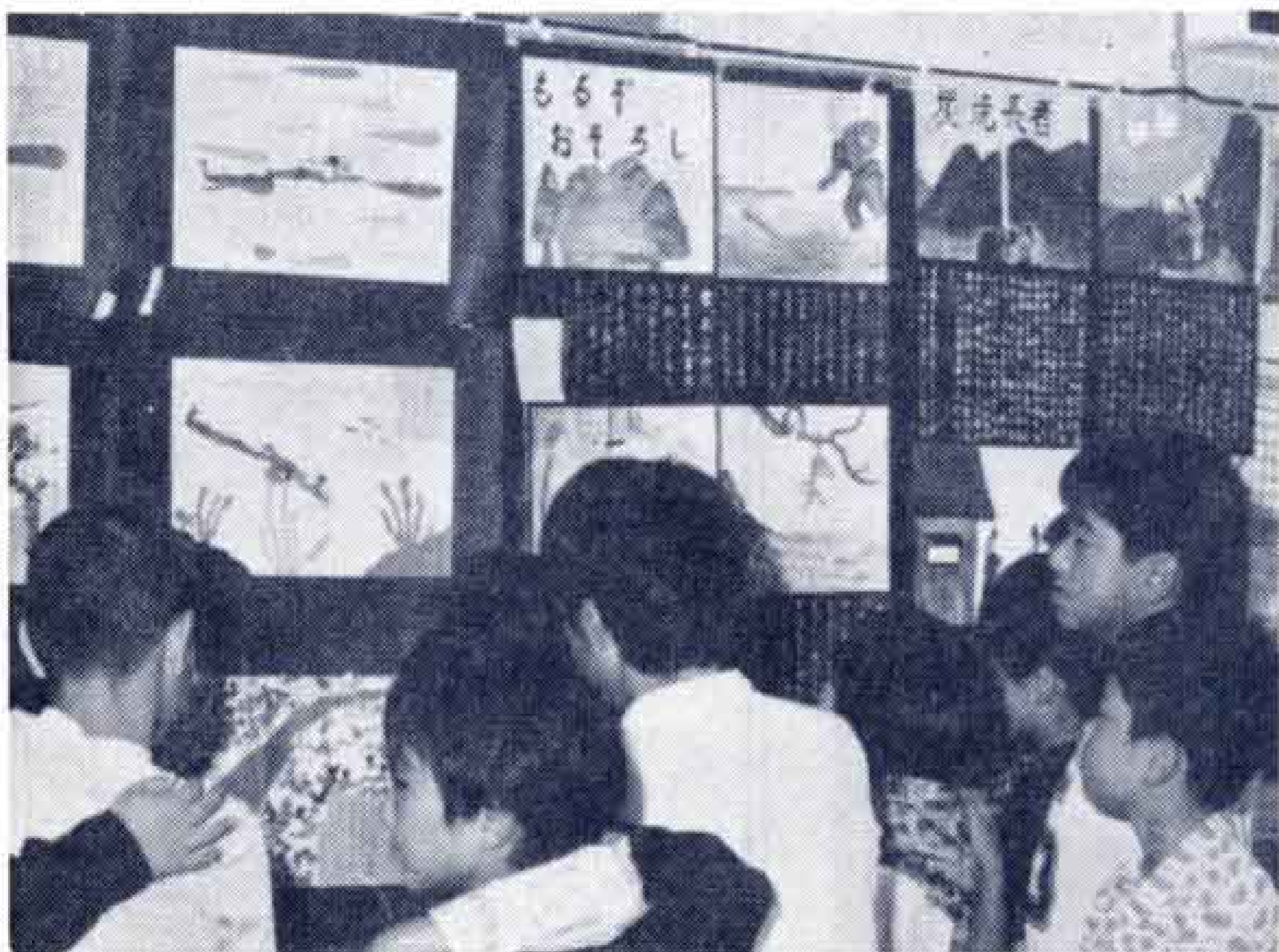
【にぎわった県少年美術展】

この美術展には、県下の少年少女の創作による陶器や素朴な竹細工、ワラ人形など約200点が展示されており、中でも富士市にちなんだ民話などの紙芝居が人気を集めていました。