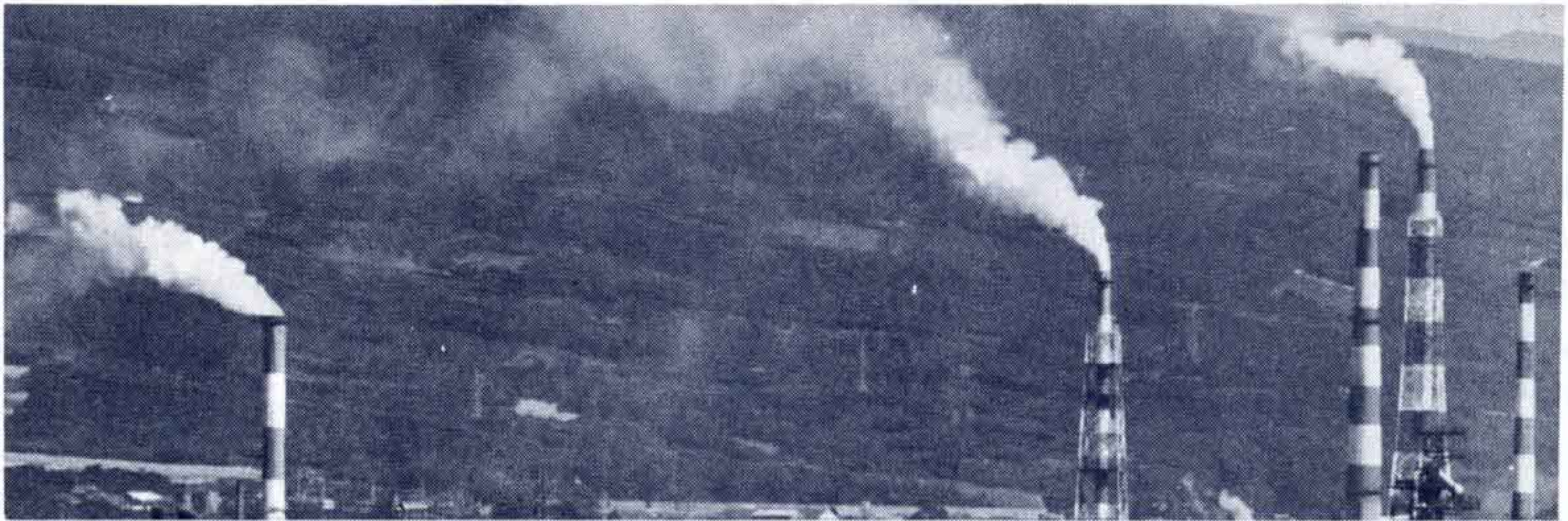
【煙源密集地では燃料転換指導も…】