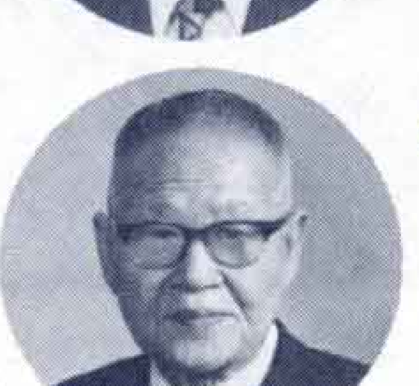
長谷川 恒三 (74才) 吉原3 市議会議員 無 再