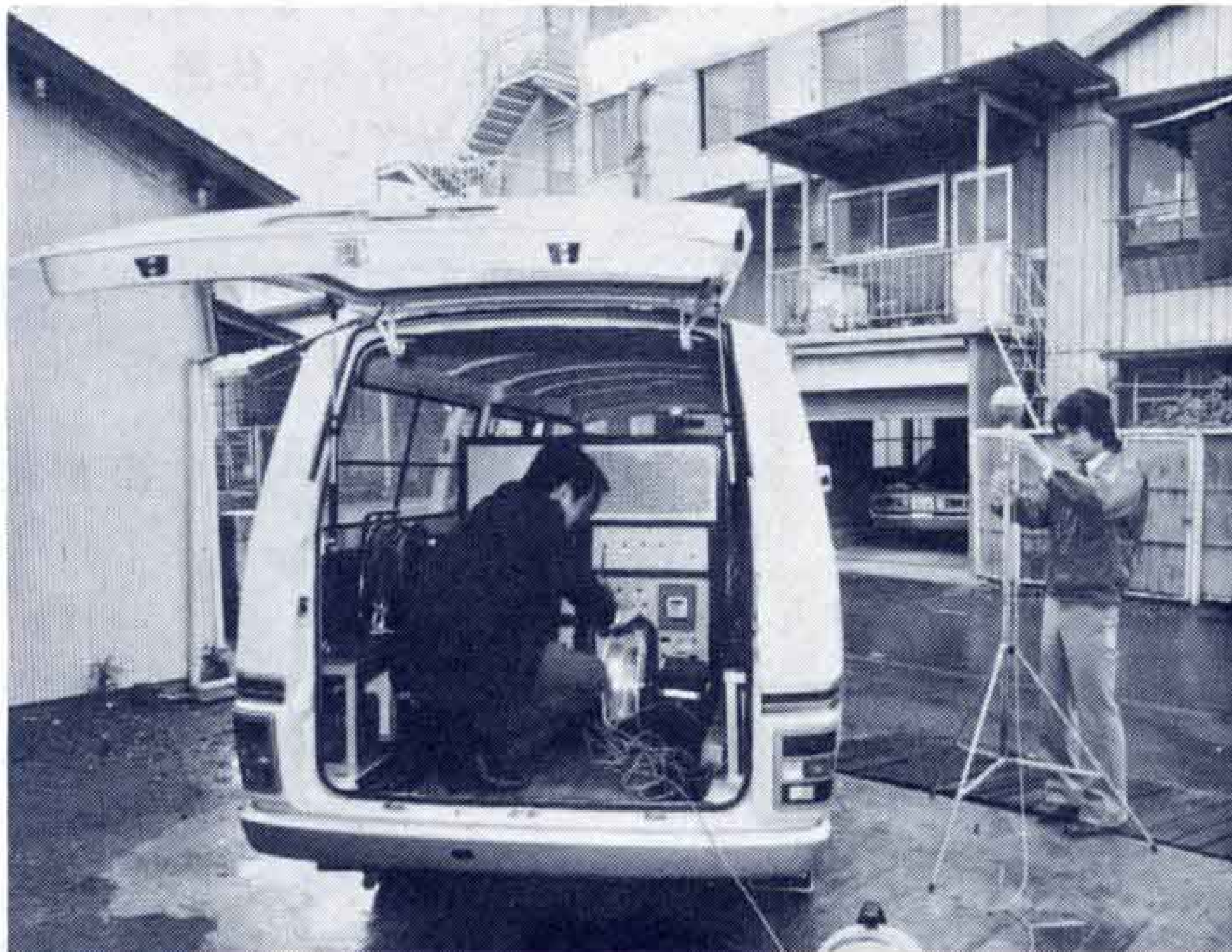
【騒音や振動の測定に活躍する環境監視測定車】

発生する公害苦情約300件の3分の1を占めています。苦情の内容も、市民生活に最も身近なものばかりといえます。