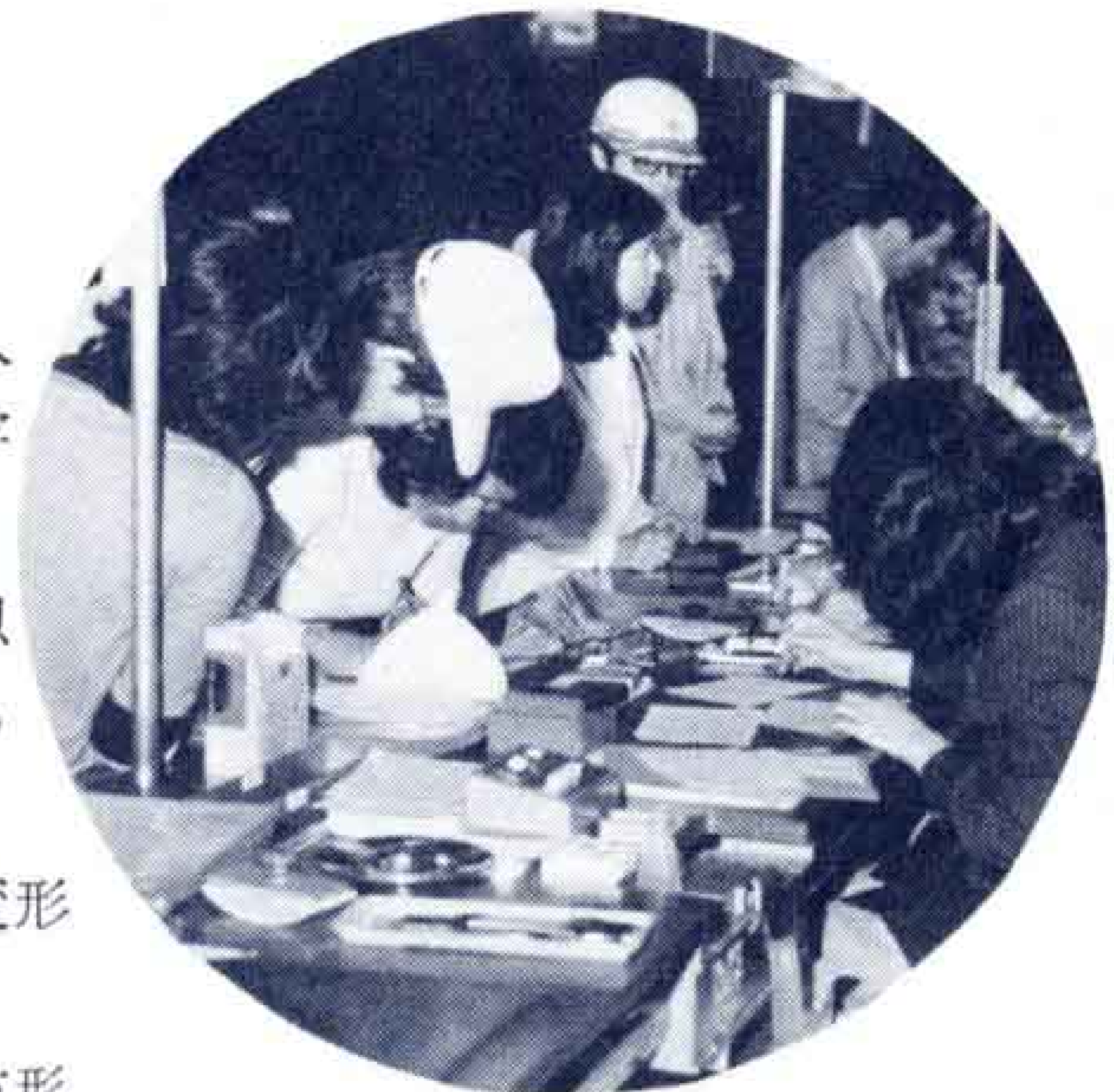
【手続きは市民課窓口で】

官公署の発行した免許証許可証、身分証明書、外国人登録証明書で本人の写真が貼ってあるもので、申請者が本人と確認できる時には、その場で登録し証明書の交付を行います。