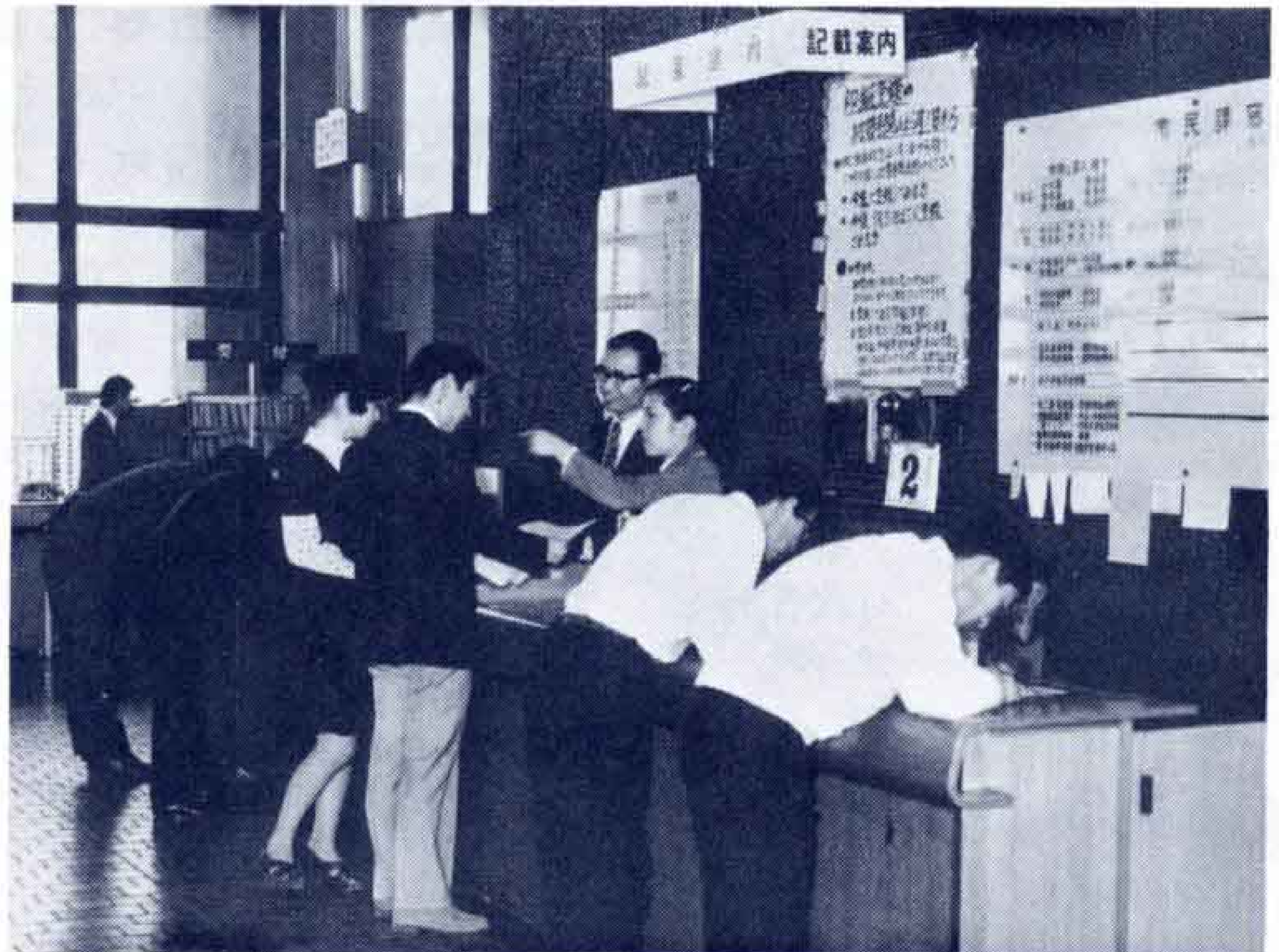
【登録手続きなどでわからないことは記載案内で】

代理人にたのんだ方は、証明書を受取るときに、交付記録と実際の枚数を確認することによって、代理人の不正を防ぐことができます。たとえ枚数をごまかされても、実印がなければ法律行為はできません。