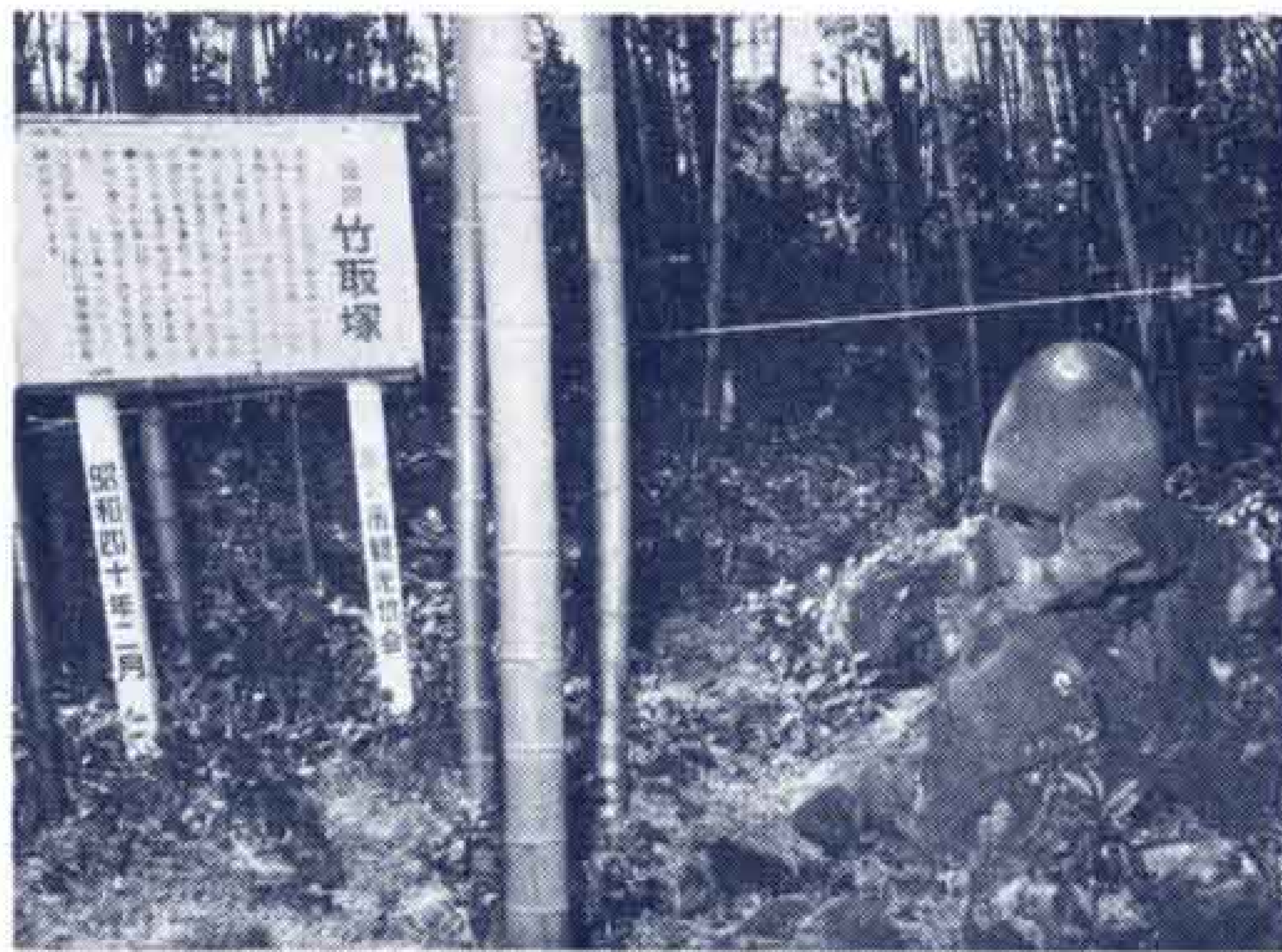
【かぐや姫の竹とり塚】

おじいさんとおばあさんは、かたみの不死の薬を、日本一高い駿河の山に登って燃してしまいました。それ以来、この山のことを不二(ふじ)の山というようになり、煙のたえることがなかったといわれています。