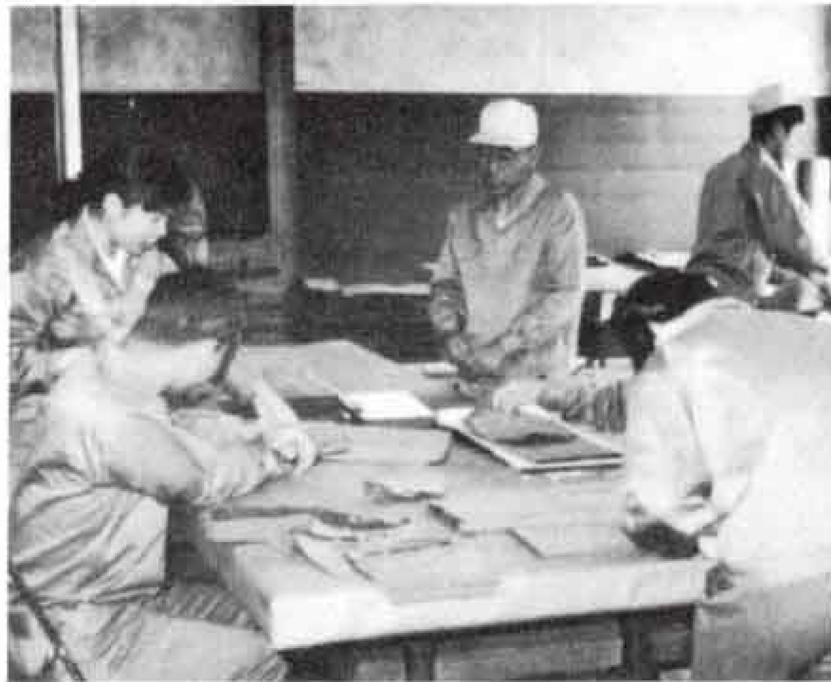
【楽しそうに作業を習う園児たち】

なお、あとの入園者については現在書類選考などを行なつており、7月までには定員いっぱいになる予定です。