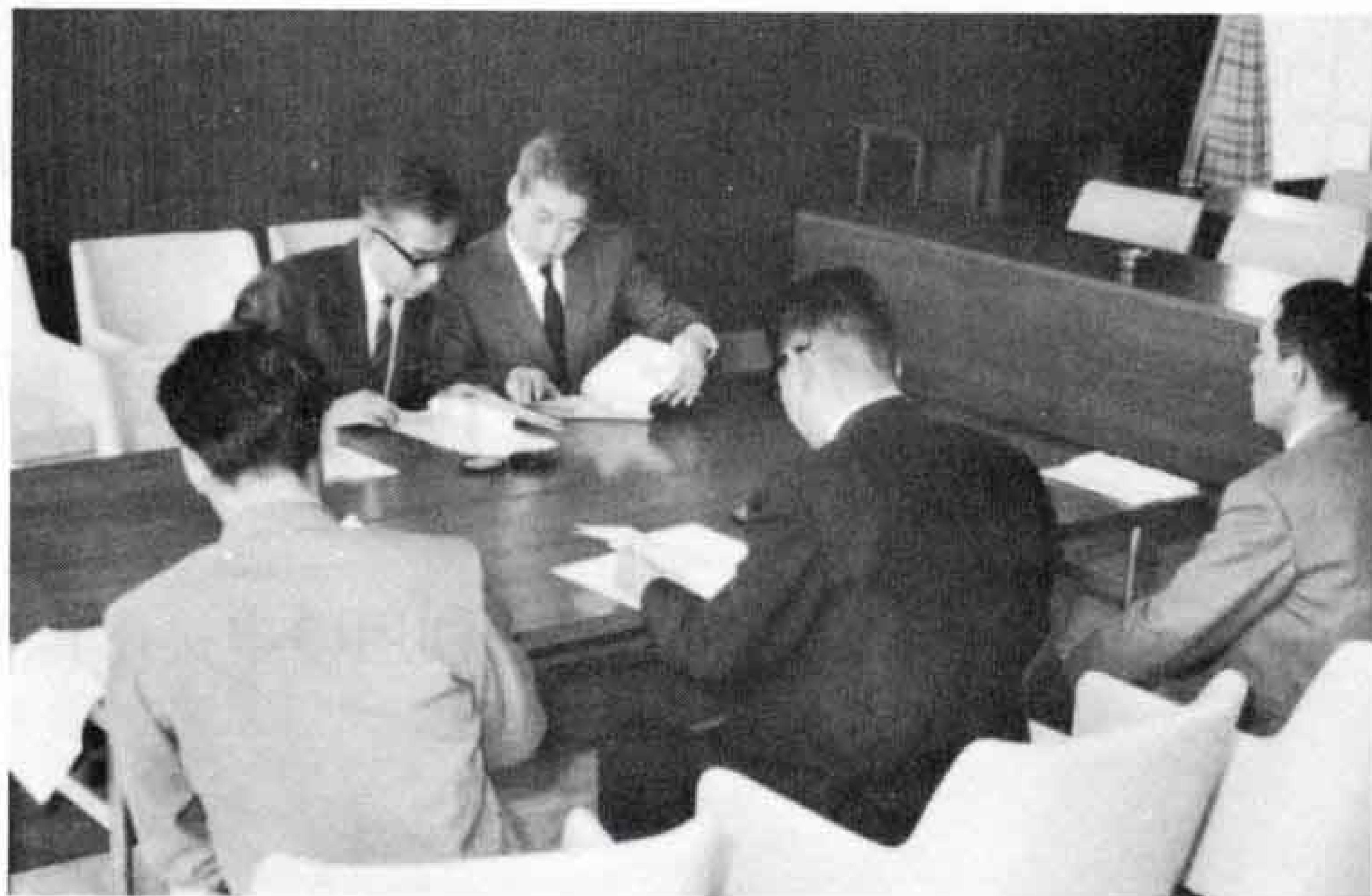
「公害防止協定を結んだのは今回の協定で十五社十七工場になりました。」

これによつて、最大着地濃度は現在の0.043 P P m、0.041 P P m、0.041 P P mが0.020 P P mに減少します。このほか、緊急時にそなえて容量100キロの